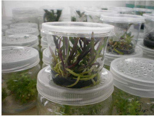
Slika 35. Pupaljci za razmnožavanje