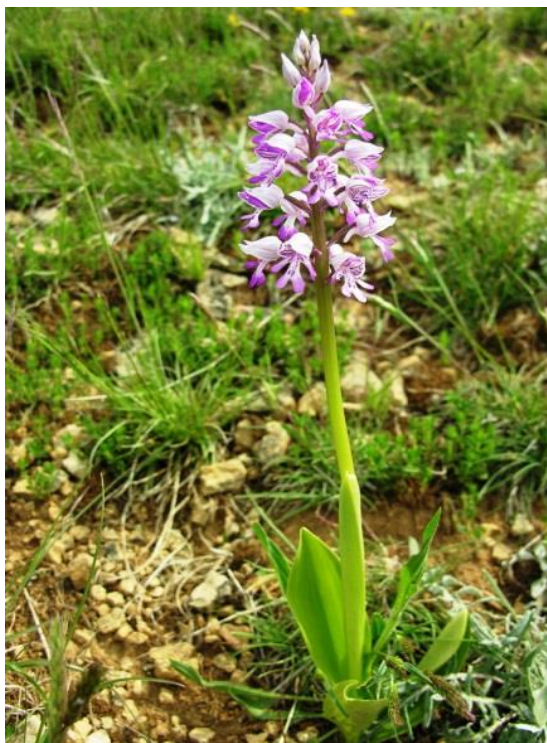
Slika 22. Orchis militaris L.

Rastu na travnjacima, šumskim čistinama i u svijetlim šumama. Cvatu od svibnja do kolovoza.