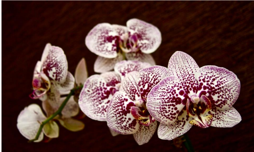
Slika 32. Vrsta roda Phalaenopsis

Orhideje roda Phalaenopsis (Slika 32.) uglavnom rastu na drvetu ali ima vrsta koje rastu u stijenama. Cvjetovi dugo traju, a neke vrste imaju šareno lišće pa su zanimljive i kada ne cvjetaju. Orhideje ovog roda je vrlo jednostavno uzgajati u domaćinstvima. Rastu u jugoistočnoj Aziji, Indoneziji, Indiji, Maleziji i Filipinima.