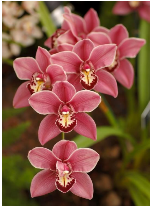
Slika 26. Vrsta roda Cymbidium

Listovi su dugi i zeleni, a stabljika je visoka 60 do 80 centimetara. Cvjetovi su veliki zbog čega se najviše cijene i često koriste kao rezano cvijeće. Zanimljivo je za vrste ovog roda da mogu preživjeti niske temperature, te cvjetaju zimi kada veći dio orhideja ne cvjeta. Rod Cymbidium (Slika 26.) broji oko 52 vrste. Rastu u tropskoj i subtropskoj aziji (Borneo, Filipini, Sjeverna Indija, Kina, Japan), ali i u sjevernoj Australiji gdje rastu na većim visinama i u hladnijim uvjetima.