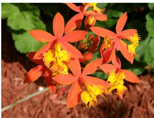
Slika 28. Vrsta roda Epidendrum

Samo ime Epidendrum (Slika 28.) govori da rastu na drveću. Broj i boja cvjetova ovisi o vrsti, a mogu biti orhideje sa pojedinačnim cvjetovima i orhideje sa mirisnim cvatovima. Rasprostranjene su od Južne Karoline do Argentine. Broje oko 750 vrsta.