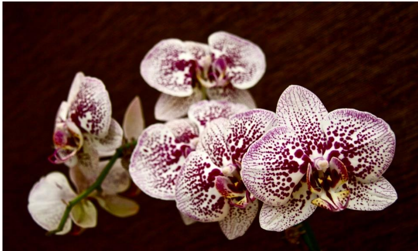
Slika 32. Vrsta roda Phalaenopsis

Orhideje roda Phalaenopsis (Slika 32.) uglavnom rastu na drvetu ali ima vrsta koje rastu u stijenama. Cvjetovi dugo traju, a neke vrste imaju šareno lišće pa su zanimljive i kada ne cvjetaju. Orhideje ovog roda je vrlo jednostavno uzgajati u domaćinstvima. Rastu u jugoistočnoj Aziji, Indoneziji, Indiji, Maleziji i Filipinima.