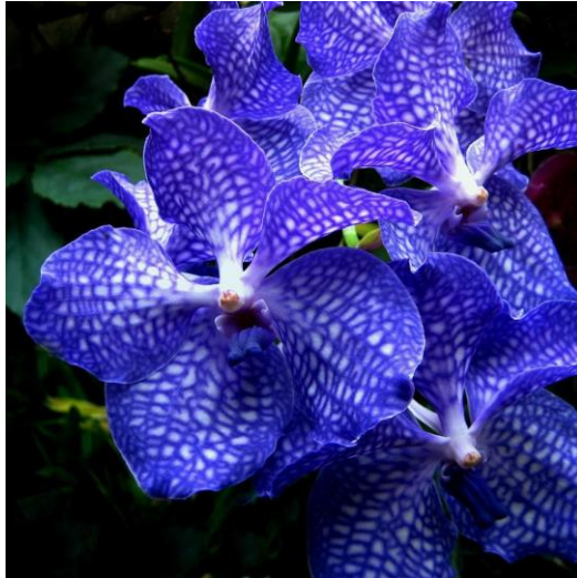
Slika 33. Vrsta roda Vanda