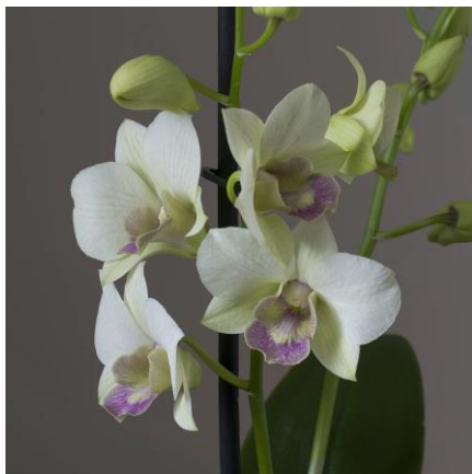
Slika 27. Vrsta roda Dendrobium

uzimaju dugu pauzu, a tijekom ljeta rastu. Staništa su im u istočnoj i jugoistočnoj Aziji, sjevernoj Australiji i Novom Zelandu. Rod Dendrobium (Slika 27.) broji oko 1200 vrsta.