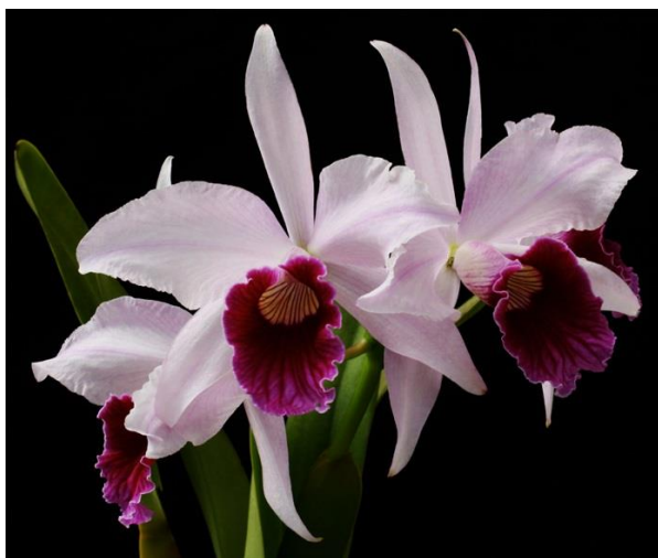
Slika 25. Vrsta roda Cattleya

Vrste roda Cattleya (Slika 25.) su litofiti, odnosno rastu na stijenama. Imaju iznimno velike cvjetove zbog čega su uzgajivačima omiljene i često se koriste kao rezano cvijeće. Ime su dobile po Williamu Cattleyu koji je prvi uzgojio vrstu Cattleya labiata u 19. stoljeću. Rod ima 42 vrste koje rastu od Kostarike do Južne Amerike.