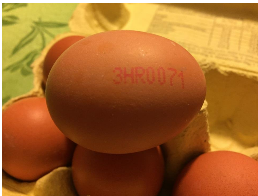
Slika 2. Primjer označavanja jaja prema Pravilniku o kakvoći jaja u RH