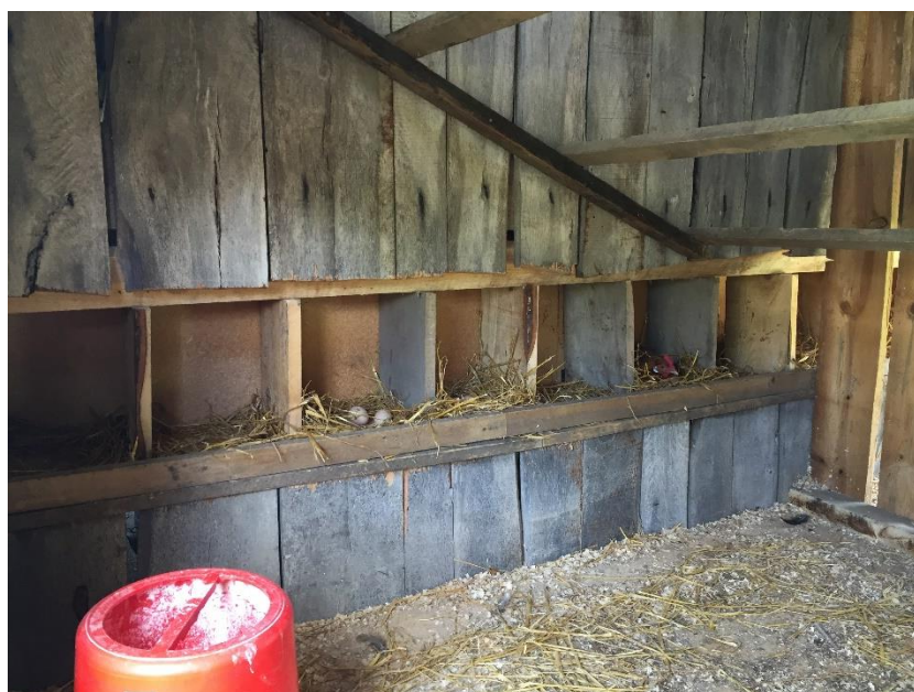
Slika 5. Unutrašnjost nastambe s gnijezdima za nesenje jaja