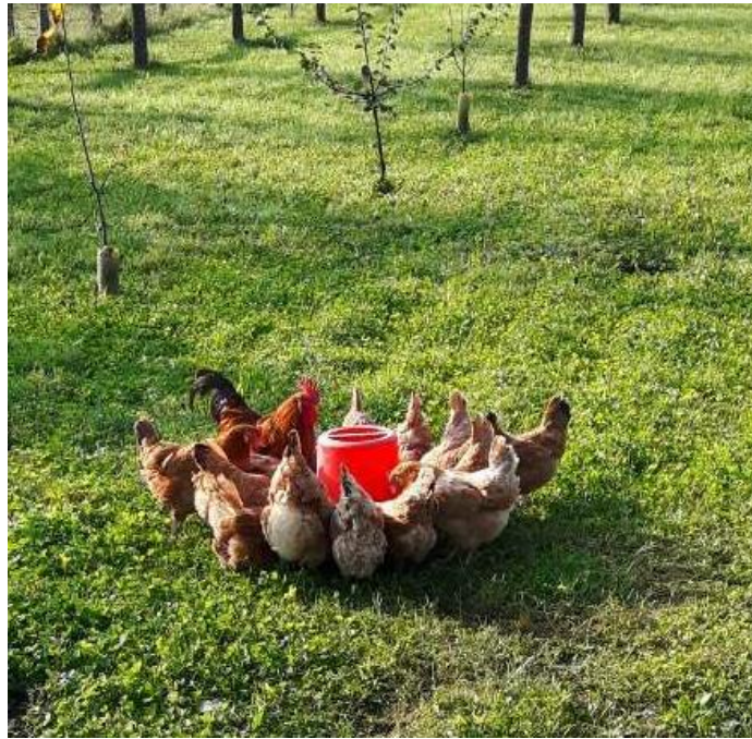
Slika 6. Jato kokoši hrvatica crvenog soja na ispustu

Nakon 4 mjeseca hranidbe nesilica krmnim smjesama iz svake skupine izabrano je po 50 jaja za utvrđivanje kvalitete. Kvaliteta jaja određena je na ukupno 150 jaja. Parametri kvalitete jaja određeni su na svježim jajima (2 dana nakon sakupljanja jaja) i jajima skladištenim 28 dana na +4°C. Od pokazatelja kvalitete jaja izmjereni su masa jaja i osnovnih dijelova, širina i dužina jaja iz kojih je izračunat indeks oblika, boja žumanjka, visina bjelanjka, HJ, čvrstoća i debljina ljuske, pH bjelanjka i pH žumanjka.