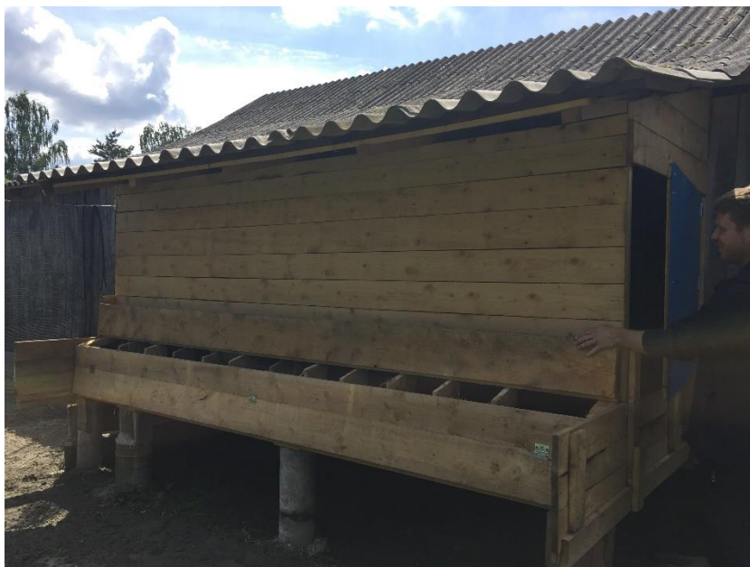
Slika 4. Izgled nastambe za kokoši hrvaticice