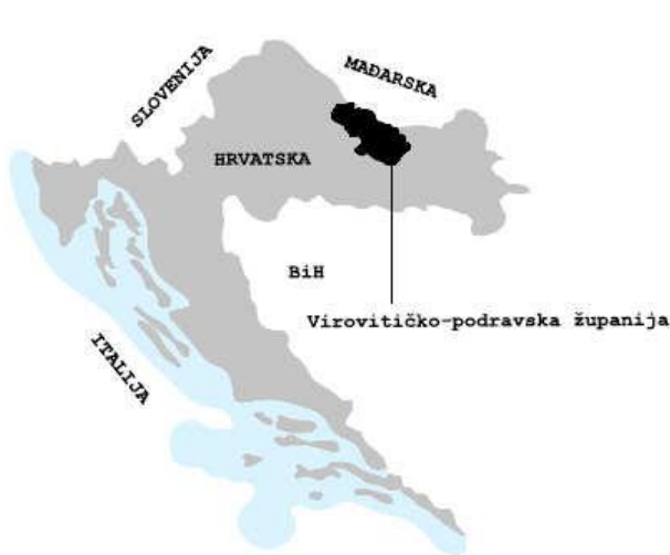
Slika 1_Položaj Virovitičko-podravske županije u Republici Hrvatskoj; izrađivač: ZPUVPŽ

Dvorac se nalazi u središtu naselja Suhopolje, neposredno uz državnu cestu D-2, na udaljenosti od 9,8 km od sjedišta Županije – Grada Virovitice, 157 km od Zagreba i 117 km od Osijeka. Povoljan smještaj dvorca neposredno uz državnu cestu, a ujedno i u neposrednoj blizini samoga središta naselja, otvara mogućnost da se sadržaj koji se planira uvesti u dvorac otvara većem broju korisnika. Stoga je u dvorac poželjno smjestiti sadržaje ugostiteljsko-turističkoga karaktera.