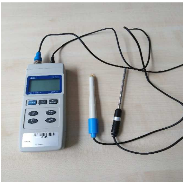
Slika 7. pH metar