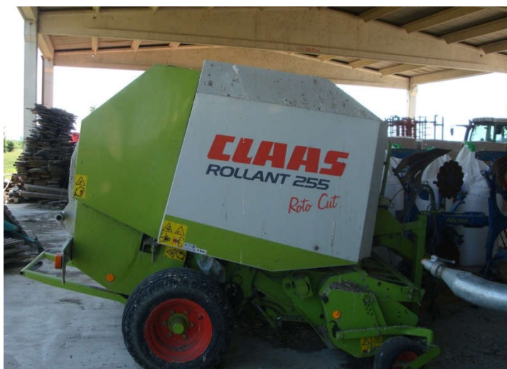
Slika 11. Preša Claas Rollant 255 Roto Cut za valjkaste bale

Osim preše za valjkast bale farma posjeduje i Claas Quadrant prešu za izradu četvrtastih bala dimenzija 120 x 90 cm. Takve preše vrlo kvalitetno prešaju sjenažu ali se u praksi na gospodarstvu ne koriste u tu svrhu jer je takve kvadratne bale vrlo teško omotati u foliju. Stoga se ovaj tip preše koristi konkretno za sijeno i slamu.