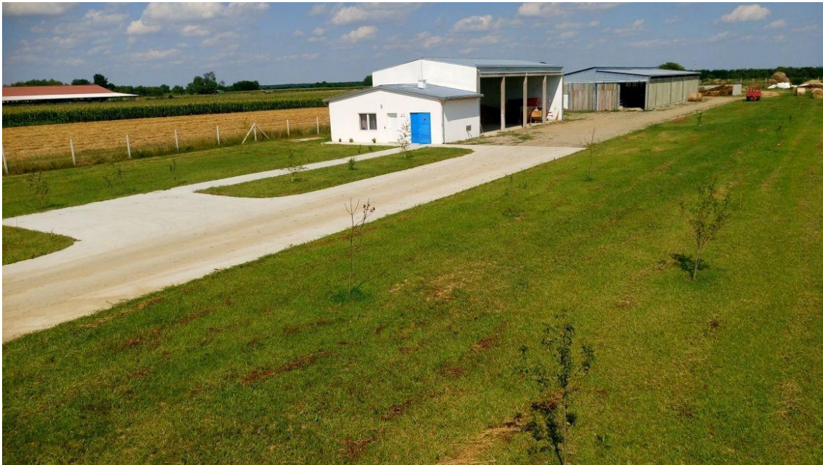
Slika 1. Farma Franković

Obiteljsko poljoprivredno gospodarstvo bavi se tovom junadi već 4 godine. Farma se nalazi na relaciji Gorjani- Đakovačka Satnica i udaljena je 500-tinjak metara od Gorjana. Osim tovom junadi, OPG se bavi i ratarstvom. Obraduje 80 hektara privatne i državne zemlje uz vlastitu mehanizaciju koju je kompletirao tijekom godina, te sam proizvodi svu hranu potrebnu za tov junadi. Na OPG-u nema radnika već cijela obitelj sudjeluje u poslu. Trenutno se na farmi nalaze 93 junice.