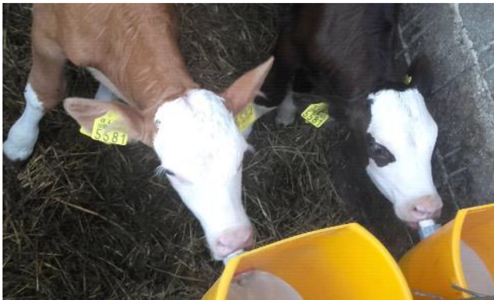
Slika 18. Napajanje teladi zamjenskim mlijekom-zamjenicom

Na gospodarstvu se hranjenje goveda obavlja dva puta na dan, jednom ujutro te jednom navečer. Smjesa se pripravlja od samljevenih žitarica, odnosno kukuruza, ječma i tritikala te se u nju dodaje silaža. Smjesa se miješa u mikserici kako bi sve bilo ravnomjerno izmiješano. Nakon toga, goveda dobiva čisto sijeno, a voda im je dostupna u svako doba dana kroz automatske pojilice. Količina hrane ovisi o dobi goveda. Ukoliko se kupe vrlo mala telad, jedno određeno vrijeme se hrani zamjenskim mlijekom, zamjenicom Milsan koju nabavljaju u poljoprivrednim trgovinama. Teladi se zamjenica sa vremenom smanjuje te se telad uči na konzumaciju voluminozne i koncentrirane krme.