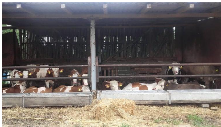
Slika 4. Staja za slobodan način držanja goveda

Drugi objekt za tov goveda ima kapacitet za 30 grla, sastoji se od dva velika boksa. U svaki boks stane 15 grla gdje se goveda drže slobodnim načinom. Ispred sebe imaju valov za hranu, a u oba objekta se napajanje vrši pomoću automatskih pojilica. Čišćenje ovih objekta se radi jednom tjedno, te se tad grla ispuštaju u poseban prostor koji posluži kao privremeni smještaj dok se štala ne očisti. U prvom objektu, staja se čisti svaki dan.