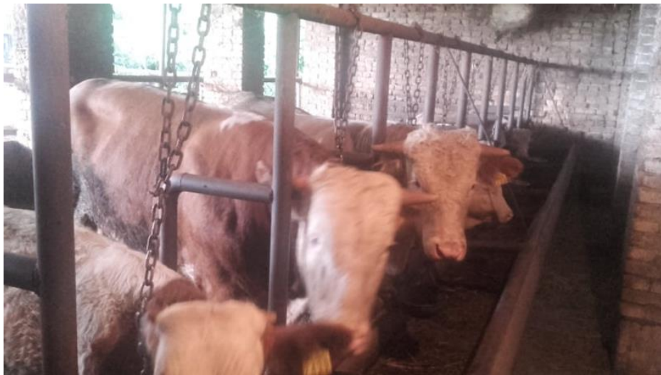
Slika 9. Starija goveda na vezanom načinu držanja