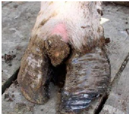
Slika 24. Bolest papaka

https://www.google.com/search?biw=1242&bih=553&tbm=isch&sa=1&ei=sokjXdq1BZS61fAPr6Sg8AI&q=hiperplazija+i+hromost+teladi&oq=hiperplazija+i+hromost+teladi&gs_l=img.3...7870.20533..21173...1.0..0.130.4431.0j39.....0....1..gws-wiz-img.....0..0j0i30j0i5i30j0i24.KhqoR3SVccM#imgcr=ol8Tkb_5tRe6IM: )