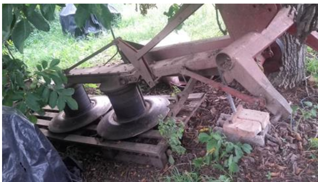
Slika 21. Roto-kosilica za djetelinu