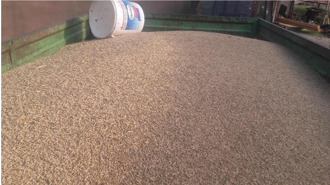
Slika 16. Ovršeni ječam