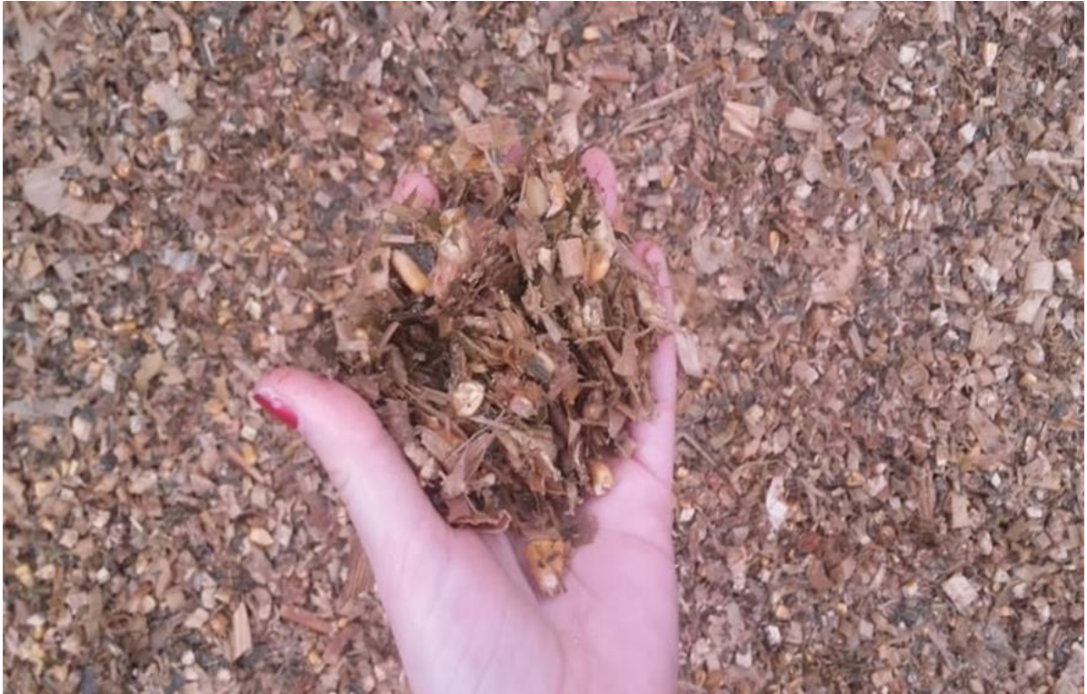
Slika 14. Konzervirana silaža