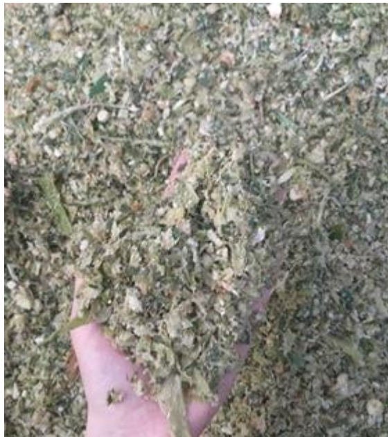
Slika 13. Svježa silaža