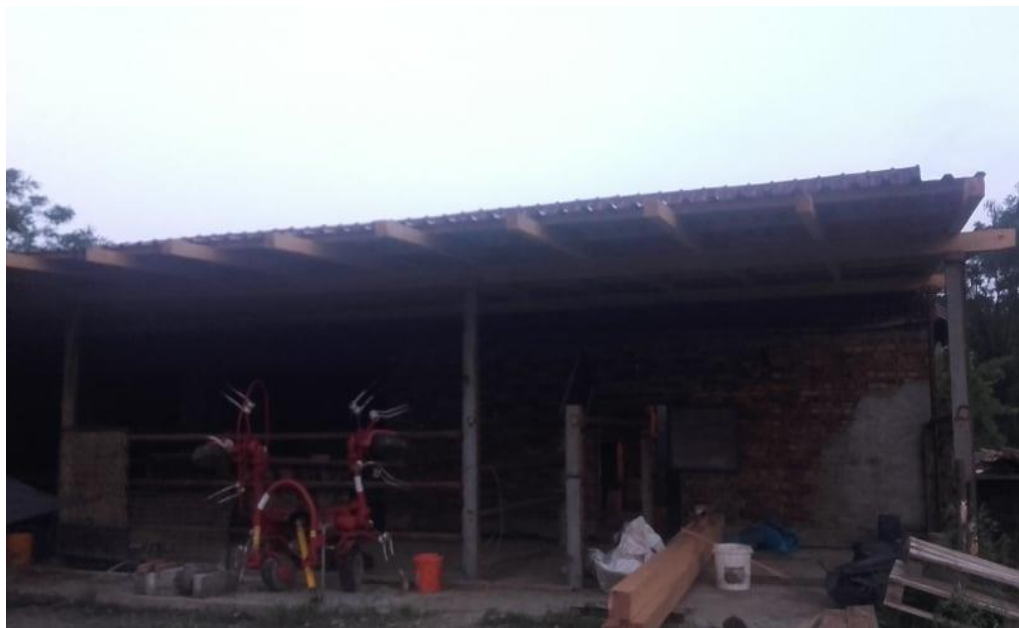
Slika 5. Staja u procesu izgradnje

Treći objekt za tov goveda je još uvijek u procesu izgradnje, kapacitet mu je oko 20-25 grla, sastoji se od tri boksa, dva za držanje grla te treći koji će poslužiti za ispust goveda prilikom čišćenja objekta.