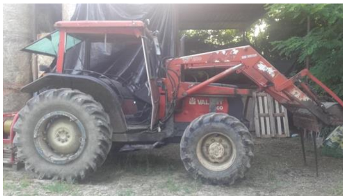
Slika 20. Traktor

Uz govedarstvo, obitelj Markanović se bavi i ratarstvom kako bi mogla proizvesti hranu o kojoj je prethodno napisano. Kako bi se mogli obavljati ratarski poslovi potrebna je određena mehanizacija. Obitelj u svome vlasništvu ima dva traktora, dvije prikolice, rolo balirku te balirku za kockaste bale, sve strojeve za obradu tla, prikolicu za odvoz stajnjaka, silo-kombajn za silažu, berač kukuruza, rasipač za gnojidbu te špricu za tretiranje usjeva od bolest, štetnika i korova. Zahvaljujući skoro kompletnom sastavu mehanizacije za vlastitu obradu tla i proizvodnju hrane, uvelike su smanjeni troškovi s te strane te su izdatci za dodatne poslove za koje ne dostaje određene mehanizacije vrlo mali.