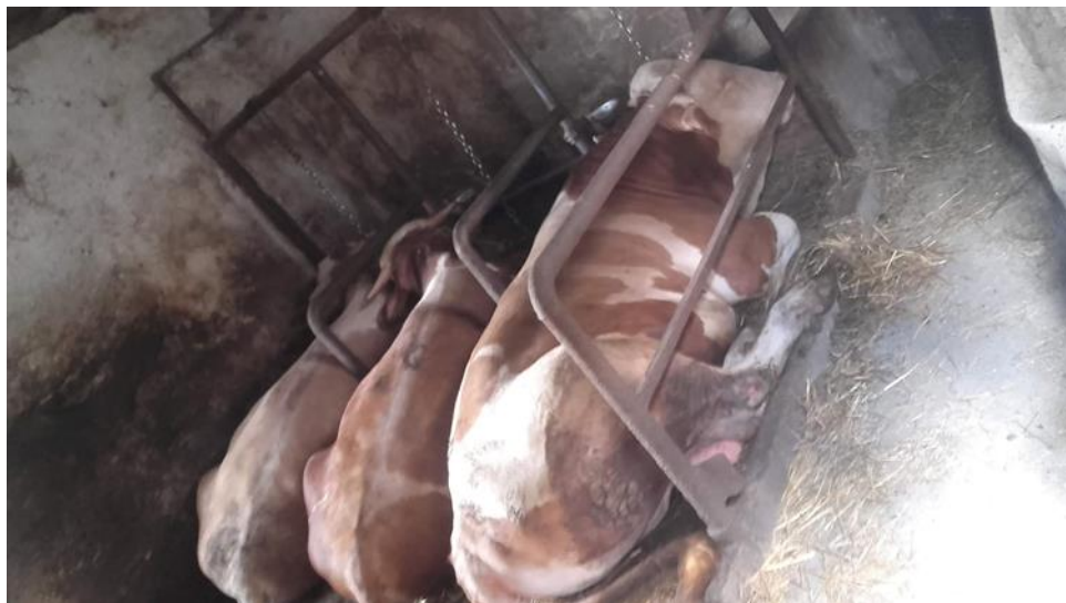
Slika 7. Vezani način držanja

Na obiteljskom poljoprivrednom gospodarstvu trenutno se kombiniraju sva tri načina držanja goveda zbog različite dobi. Mlađa grla uglavnom budu na slobodnom načinu držanja te se kasnije prebace u štalu na vezani način držanja kada su već u završnoj fazi tova. Zbog dobrobiti životinja te pomalo ograničenog prostora kod grla na vezanom načinu, uskoro će sva grla biti prebačena na slobodan način držanja.