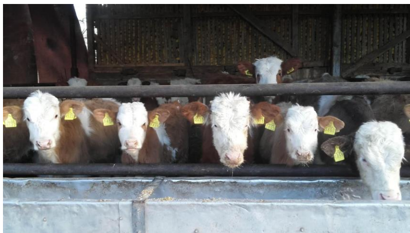
Slika 1. Telad u tovu

U radu ću pobliže pokušati objasniti proizvodnju na vlastitom OPG-u Markanović, Gorica Valpovačka koji se bavi tovom goveda. Objasniti ću način držanja, proizvodnju i pripremu hrane te hranidbu, dnevni prirast, razvoj goveda od ulaska u tov pa sve do završne faze, odnosno izvoza.