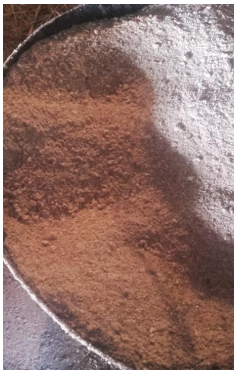
Slika 19. Smjesa za hranidbu