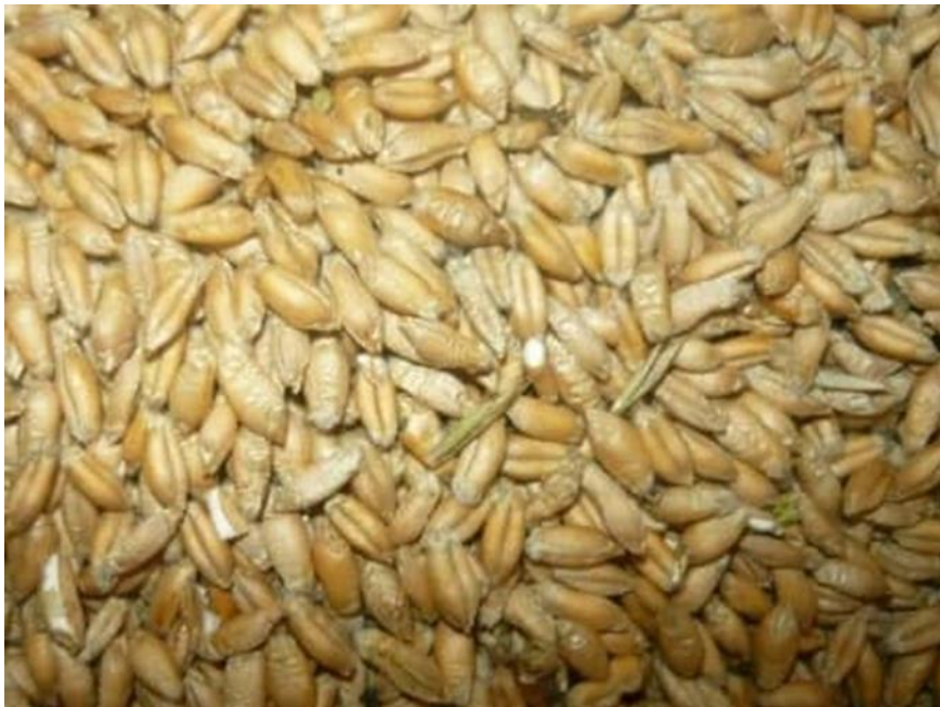
Slika 17. Triticale