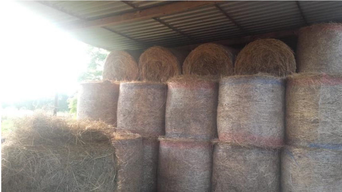
Slika 12. Sijeno