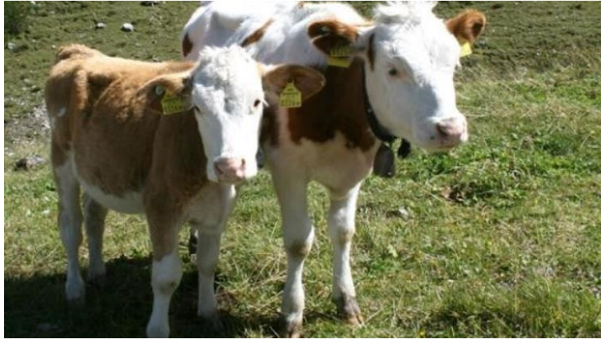
Slika 23. Bolest zglobova kod teladi