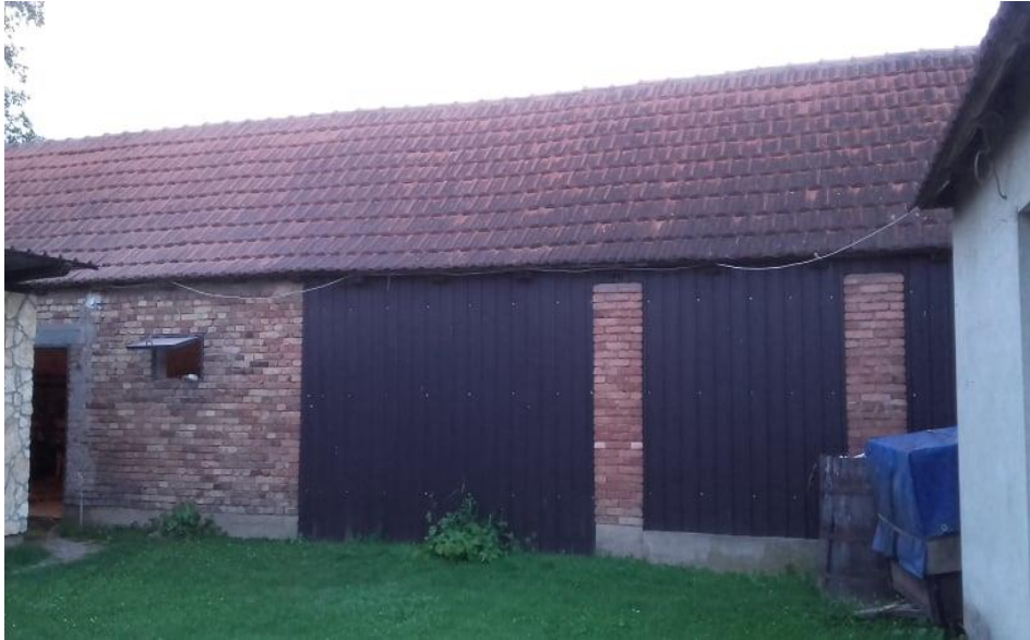
Slika 3. Staja za vezani način držanja goveda