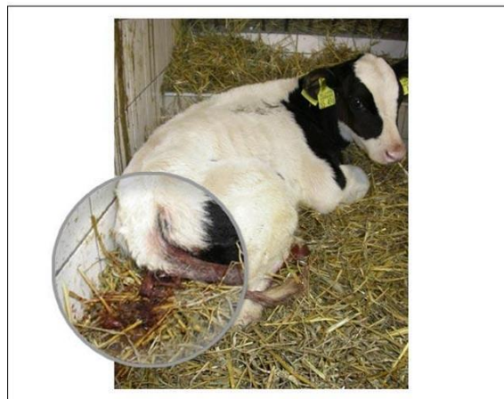
Slika 22. Proljev

Na OPG-u Markanović telad jedino zna imat problema sa proljevom, koji se riješe određenim veterinarski terapijama te prilagođenom prehranom. Kako bi se zaštitilo goveda od bolesti potrebno je voditi brigu o higijeni i uvjetima u kojima goveda borave, paziti na pravilnu ishranu, obaviti cijepljenja propisana za goveda te ukoliko dođe do bolesti pozvati veterinarsku službu te pokušati spriječiti bolest i širenje kako bi se gospodarstvo zaštitilo od ne željenih gubitaka stoke.