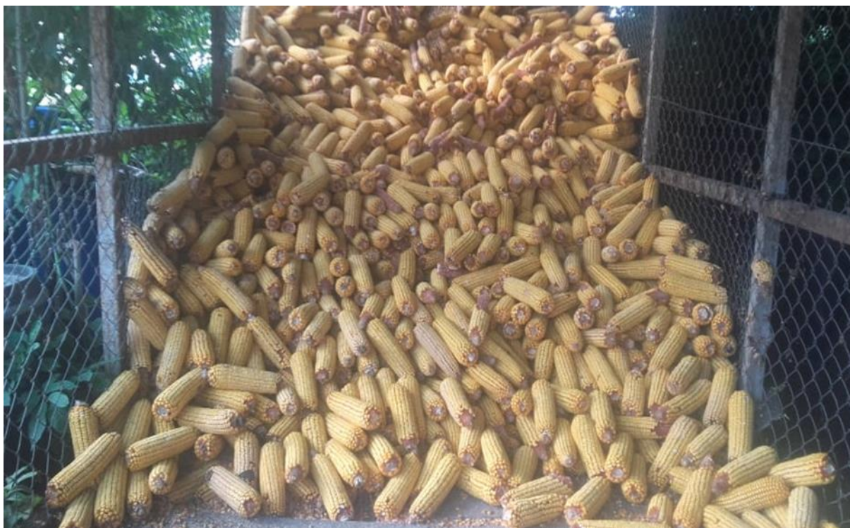
Slika 15. Kukuruz

Od koncentriranih krmiva koja obitelj Markanović koristi u svojoj hranidbi su kukuruz, triticales, ječam i posije.