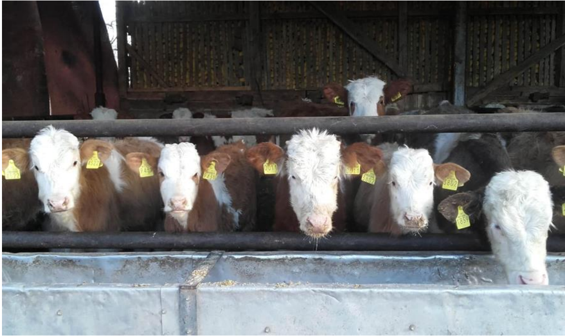
Slika 8. Slobodni način držanja