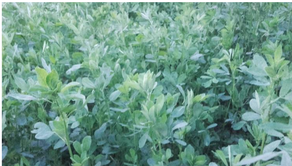
Slika 11. Lucerna