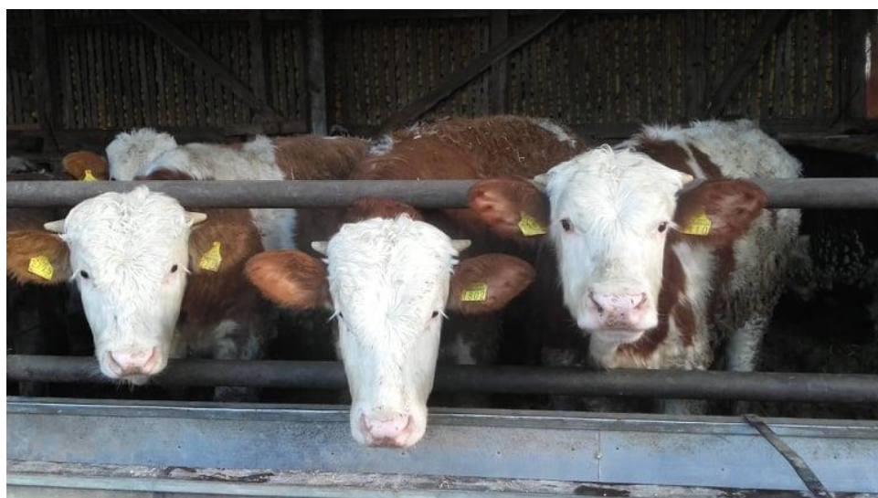
Slika 2. Simentalska telad u tovu

Simentalska pasmina je kombinirana pasmina mliječne i mesne proizvodnje. U Hrvatskoj je ova pasmina dominantna u govedarskoj proizvodnji. Simentalac je dugovječan, vrlo prilagodljiv ima dobar intenzitet iskorištenja. Simentalske krave godišnje mogu proizvesti oko 5000kg mlijeka godišnje. Što se tiče mesne proizvodnje, simentalca ne treba križati nego ga treba izrađivati u čistoj krvi jer je kvaliteta mesa sama po sebi dobra. U pogledu intenziteta proizvodnje, simentalac odgovara svim oblicima i razinama, osim kada je u pitanju visoka proizvodnja mlijeka, tada je Holstein pasmina nezamjenjiva.