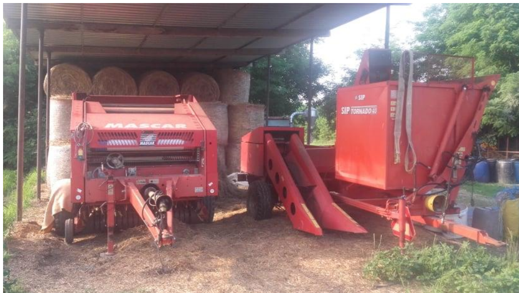
Slika 6. Nadstrešnica za sijeno i dio strojeva

Na gospodarstvu se nalazi i objekt za spremanje mehanizacije kako bi se zaštitili od nepovoljnih vremenskih uvjeta. Uz dva traktora, tamo se nalaze strojevi za obradu tla, berač za kukuruz, silo-kombajn prikolice i dr.