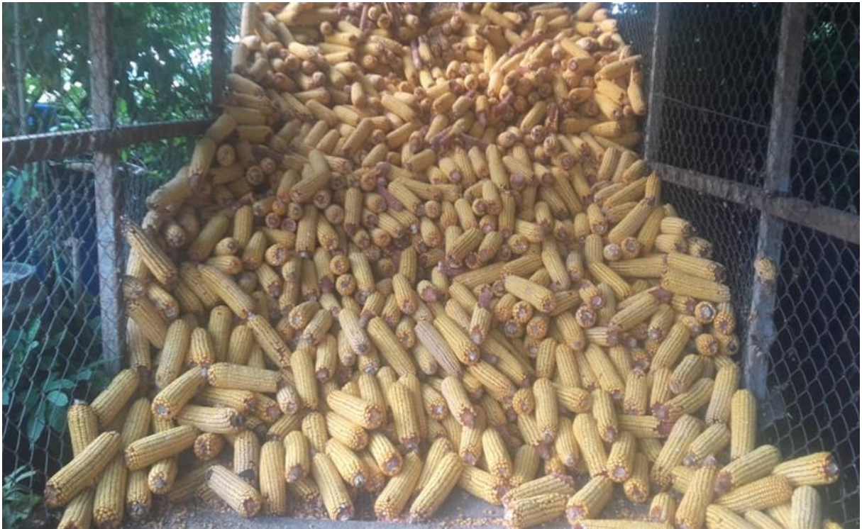
Slika 15. Kukuruz

Od koncentriranih krmiva koja obitelj Markanović koristi u svojoj hranidbi su kukuruz, triticales, ječam i posije.