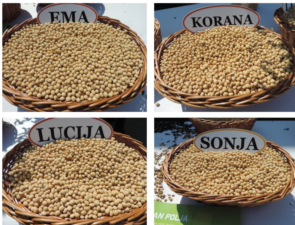
Slika 1. Sjeme ispitivanih sorti soje

( https://www.poljinos.hr/proizvodi-usluge/soja-suncokret/soja/ )