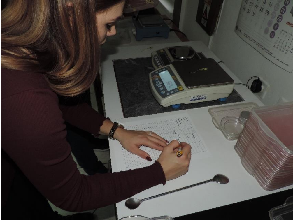
Slika 11. Vaganje biljčica