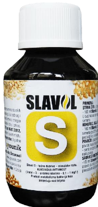
Slika 2. Stimulator rasta korišten pri pokusu

Slavol S (Slika 2.) je regulator rasta koji se koristi za tretiranje sjemena ratarskih i povrtlarskih kultura. On povećava klijavost sjemena, snagu nicanja, energiju klijanja, hektolitarsku masu i prinos. Sadrži indol-3 octenu kiselinu-auksin (esencijalni biljni hormon koji regulira proces rasta i razvoja biljaka). Indol 3 octena kiselina biološki je aktivna i stimulira sve fiziološke procese u biljkama kao i auksin koji se sintetizira u biljnim stanicama. Povećavanjem auksina povećava se fiziološka aktivnost u biljnim stanicama, biljke jače razvijaju korijenov sustav i nadzemni dio biljke što se direktno odražava na prinosu. Dodaje se 5 ml/kg sjemena u kombinaciji sa vodom omjera 1:1 (2,5 ml/kg sjemena Slavol S + 2,5 ml/kg sjemena vode) ( https://agroklub.com ).