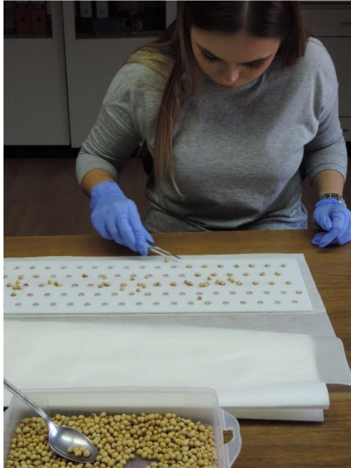
Slika 6. Sijanje sjemenki na filter papir