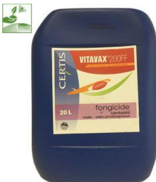
Slika 3. Fungicid korišten pri obavljanju pokusa

Vitavax 200 FF (Slika 3.) je fungicid koji se koristi za zaštitu sjemena i klica od biljnih bolesti. Aktivna tvar je tiram 200 g/l + karboksanil 200 g/l. Kod soje se koristi za suzbijanja uzročnika truleži, paleži klice ( Fusarium spp., Aspergillus spp., Penicillium spp.), crne pjegavosti ( Ohomopsis spp.) i trueži ( Rhizoctonia solani ). Sredstvo nema utjecaj na razvoj kvržičnih bakterija, kojima se vrši inokulacija sjemena soje prije sjetve. Dodaje se 5 ml/kg sjemena u kombinaciji sa vodom omjera 1:1 (2,5 ml/kg sjemena Vitavax 200 FF + 2,5 ml/kg sjemena vode) ( http://pinova.hr/hr ).