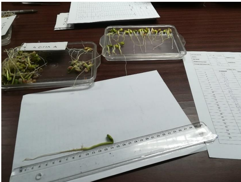
Slika 10. Mjerenje duljine korjenčića i hipokotila pomoću ravnala