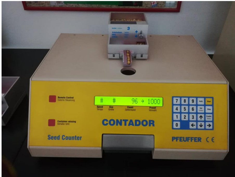
Slika 5. Brojač sjemena (vlastita fotografija)