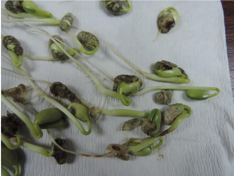
Slika 9. Proklijalo sjeme soje