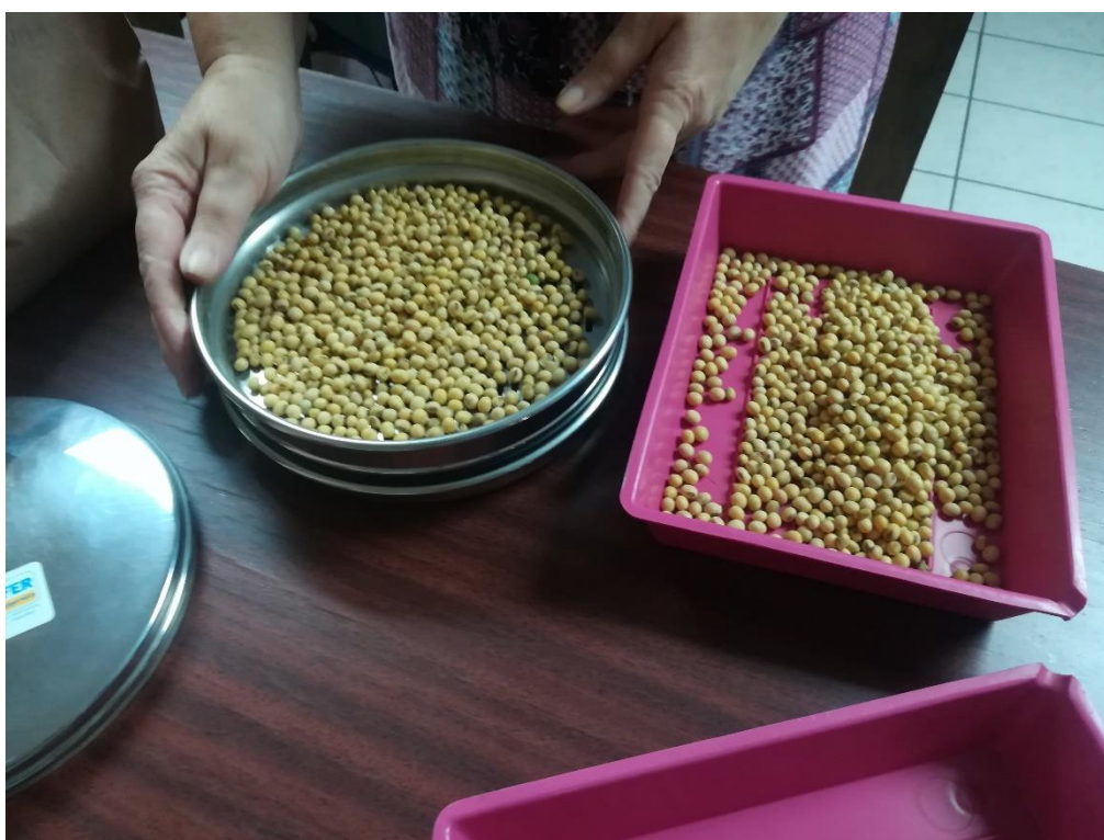
Slika 4. Prosijavanje sjemena

Nakon toga smo tretirano sjeme prosijavali da bismo ga očistili od polomljenog sjemena (Slika 4.). Nadalje, sjeme smo stavili u uređaj Contador (Pfeuffer) za brojanje sjemena (Slika 5.) i izvagali ga kako bismo odredili apsolutnu masu (masu 1000 zrna).