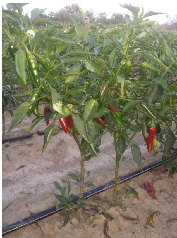
Slika 2. Stabljika, cvijet i plod začinske paprike

Berba paprike odvija se kada je plod u fiziološkoj zriobi. Budući da paprika sazrijeva postupno, zreli podovi beru se u više navrata. Berba je ručna. Prva berba počinje krajem kolovoza, a budu tri berbe. Jedna berba traje jedan dan, a obavljaju je dvadeset radnika po 8 sati. Prva berba i treća berba budu slabijeg uroda, a u drugoj berbi bude najviše zrelih plodova te tada berbu obavlja i više ljudi. Beru se samo zdravi plodovi koji su tamnocrvene boje bez oštećenja i koji nisu bolesni. Bolesni i oštećeni plodovi beru se i ostavljaju na tlu.