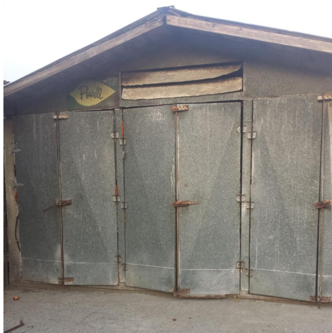
Slika 3. Sušara

Nakon berbe paprika ostane vani oko 7 dana da fermentira. Paprika se suši u sušari koja se nalazi u ekonomskom dvorištu. Sušara je marke Powell. Sušara je zidana blokom. Sastoji se od tri kanala koji su pregrađeni drvenim pločama. Vrata sušare su od drveta, a sa vanjske strane od lima. Betonski temelj služi za prijenos toplog zraka, a na temeljima se nalaze limene ploče sa rupama kroz koje prolazi topli zrak. Sušara ima pogonski motor snage 5 kW. Izvor topline je plamenik koji koristi gorivo iz cisterne zapremnine 1.000 litara. Paprika se iz vreća istresa na pod u slojeve debljine pola metra. Temperatura sušenja prva dva dana iznosi 37 °C, a zatim do kraja sušenja 45 – 50 °C. Kada je paprika suha temperatura se povećava na 70 °C i tako radi 2 sata kako bi se uništile sve bakterije. Sušenje traje tjedan dana, odnosno za tri sušenja 21 dan.