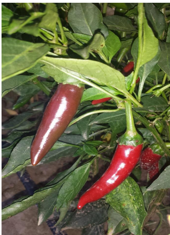
Slika 1. Začinska paprika, Szegedi 80

Szegedi 80 je sorta slatke začinske paprike visećeg položaja plodova na biljci. Biljke su visoke 40 – 50 cm. U fiziološkoj zriobi plodovi su tamnocrvene boje, dužine 12 – 14 cm i težine 8 – 10 grama. Fiziološki zreli plodovi sadrže 20 % suhe tvari. Visoke je tolerantnosti na bolesti. ( http://www.paprikart.hu/node/167 ) 22.08.2015.