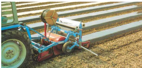
Slika 12. Postavljanje PE folije i polaganje cijevi za navodnjavanje

Prije sadnje stevije na otvoreno potrebno je izraditi gredice širine 60cm i visine 15cm preko kojih se u kontinentalnim krajevima navlači crna PE folija a ispod nje se polažu plastične cijevi za navodnjavanje kap po kap (Slika 12.). (URL 1)