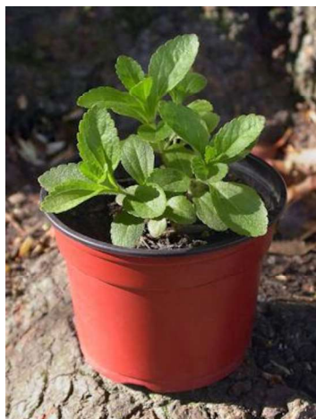
Slika 15. Pikirana sadnica stevije

U našim klimatskim uvjetima biljke stevije se sade na otvoreno polovicom svibnja, kada prođe opasnost od pojave kasnog mraza. Razmaci sadnje ovise o mikro – klimatskim uvjetima, malčiranju i načinu sadnje, a kreću se od 80 – 100 cm x 20 cm, čime se postiže sklop od oko 5 biljaka / m 2 , odnosno 50.000 biljaka / ha. Stevia se može saditi na ravno tlo ili na izdignutu gredicu 15 cm visine i 60 cm širine. Ručnim postavljanjem malča razmak između redova može biti 40 cm, a između biljaka oko 20 cm. Stevija izuzetno loše podnosi korovske biljke (plitak korijen), a primjena herbicida nije dozvoljena u ekološkoj proizvodnji, već samo mehanička obrada. Stoga se preporuča malčiranje tla upotrebom crno-bijele PE folije. U mediteranskom dijelu RH se folija okreće tako da je bijela gore (na koju se sadi), dok se u kontinentalnom dijelu sadi na crnu foliju (Slika 16.). (URL 1)