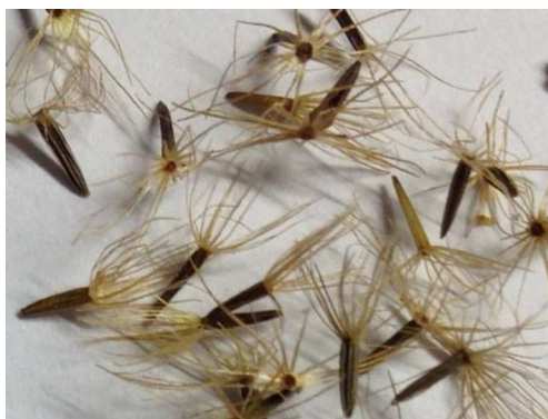
Slika 9. Sjeme stevije

Sjemenka stevije se nalazi u malim roškama veličine 3 mm. Svaka roška ima oko 20 otpornih mekanih dlačica koje pomažu kod širenja sjemena. Sjeme sadrži vrlo malo endosperma, a širi se pomoću vjetra. Shock (1982) and Lester (1999.) navode kako je sjeme stevije slabog i visoko variabilnog postotka klijavosti. Postoje dva tipa sjemena: sjeme crne i sjeme bijele boje (Slika 9.). Sjeme crne boje je bolje i ima veći postotak klijavosti dok sjeme bijele boje neplodno ili vrlo slabo klijava. Sjeme je vrlo malo, masa 1000 sjemenki je 0.3 do 1 gram, što ima za posljedicu spor razvitak biljke. Tako da se biljka može presađivati tek nakon 45 do 60 dana nakon sjetve. Zabilježeni su i prinosi od 8.1 tone po hektaru, ali je prosječna klijavost bila manja od 50%. Kako god ta proizvodnja sjemena može biti dostatna za proizvodnju lista na oko 200 hektara.