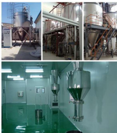
Slika 21. Sušare za steviju