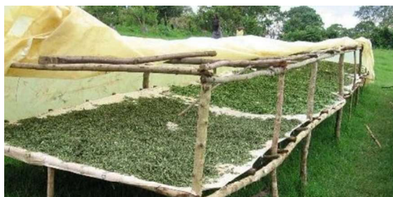
Slika 20. Sušenje stevije

Odmah nakon berbe biljka se mora osušiti. Biljke se u toplim krajevima mogu priručno sušiti vani, na mrežama (sítima), ili tako da se biljka objesi i suši poput duhana (Slika 20.). Najbolje sušenje je svakako u sušarama gdje se može točno namjestiti i kontrolirati potrebna predviđena temperatura i vlaga (Slika 21.). Stevija se posuši vrlo brzo, od 24 – 48 sati na oko 50°C, važnije je da bude dobra cirkulacija toplog zraka u sušari, nego visoka temperatura. Nakon sušenja (lišće se brže suši od stabljike), lišće se mehanički tresenjem vrlo lako skida sa stabljike. Lišće se nakon toga sprema na hladno i suho mjesto (važno je da se spriječi naknadno ovlaživanje lišća), koje može dovesti do truljenja i propadanja lišća. Lišće se pakira u plastične ili kartonske kutije gdje je osigurana zaštita od vlage. (URL 1.)