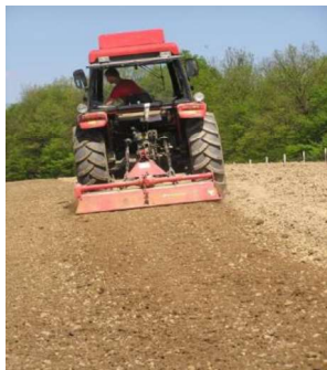
Slika 11. Dopunska obrada tla frezanjem

U proljeće je potrebno što ranije poravnati površinu tla kako bi se spriječio gubitak vode iz tla. Dopunskom obradom tla potrebno je stvoriti supstrat koji je spreman za sjetvu ili sadnju. Dopunska obrada tla obavlja se tanjuranjem, drljanjem ili frezanjem (Slika 11.).