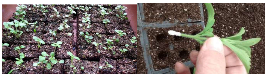
Slika 13. Uzgoj stevije iz sjemena (Lijevo) i iz reznica (Desno) (izvor: http://www.gospodarski.hr/ ; http://stevia-plant.com/ )

Stevija se može uzgajati iz sjemena ili iz reznica (Slika 13.). Stevia se može razmnožavati i kulturom tkiva, što zahtjeva posebne uvjete i dodatna ulaganja (Slika 14.).