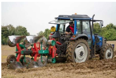
Slika 10. Osnovna obrada tla oranjem

Obradom tla potrebno je postići povoljne vodozračne uvjete u tlu, zatim uništiti korove, unijeti gnojiva u tlo i pripremiti tlo za sjetvu ili sadnju. Obrada tla se sastoji od osnovne obrade tla i dopunske obrade tla, tj. pripreme tla za sjetvu odnosno sadnju. Osnovna obrada tla može biti izvedena kao oranje, rigolanje, podrivanje i dubinsko rahljenje. Kod osnovne obrade tla za uzgoj stevije potrebno je u jesen ili rano u proljeće obaviti oranje i to oranje na dubinu do 30 – 40 centimetara. Oranjem se u tlo unose gnojiva, zaoravaju se korovi i štetnici ako ih ima. Povećava se obujam tla. Tlo upija vodu te tokom zime dolazi do izmrzavanja vode u porama tla čime se postiže fina mrvičasta struktura tla (Slika 10.).