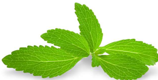
Slika 7. Listovi stevije

Stevia ima alternativan raspored listova i travolik način rasta. Listovi su mali, djelomično srasli na internodiju, različitog oblika. Mogu biti usko eliptični do oblancelasti ili okruglasti, dugi od 2 – 5 cm, nazubljenih rubova i povijeni prema gore. List ima izraženu nervaturu. Osobito je uočljiva središnja žila koja se prostire od baze lista sve do vrha. Središnja žila se zatim grana u različit broj sekundarnih žilica ispreplićući cijelu površinu lista. Obrastao je dlačicama (Slika 7.). Dlačice po duljini možemo svrstati u dvije grupe: velike 4 – 5 \mu\text{m} i male 2.5 \mu\text{m} . 80 dana nakon sjetve indeks lisne površine iznosi 4.83. Kvaliteta lista stevije ovisi o mnogo ekoloških čimbenika uključujući uvjete tla, metode navodnjavanja, sunčevu svjetlost, čistoću zraka, agrotehniku, preradu i skladištenje. List ima ugodno sladak i osvježavajuć okus koji se može dugo zadržavati u ustima (Singh i Rao, 2005.; Shaffert i Chebotar, 1994.; Fronza i Folegatti, 2003.; Maiti i Purohit 2008.).