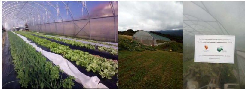
Slika 1. Plastenik na OPG-u „Zvonko Hursa“

Kao jedini problem OPG – a „Zvonko Hursa“ moglo bi se istaknuti manjak poljoprivredne mehanizacije. Naime OPG „Zvonko Hursa“ ne raspolaže sa nikakvom svojom mehanizacijom. Tako da sve poslove pripreme tla za sjetvu i sadnju moraju nadomjestiti uslužno. Gdje im pomaže OPG „Knezić“ iz Lepe Vesi, također iz Donje Stubice koji im pomaže oko svih poslova pripreme tla za sjetvu i sadnju. Oni također strojem za povlačenje folije rade proizvodne trake na površinama, a ujedno polažu i cijevi za navodnjavanje. Sadnu presadnica obavljaju sami ručno. Također i berbu obavljaju ručno. Što se tiče opreme OPG– a „Zvonko Hursa“ ipak bi se mogao istaknuti plastenik (Slika 1.).