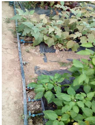
Slika 4. Sustav za navodnjavanje u plateniku

Plastenik je građen iz metalne konstrukcije i prevučen jednostrukom plastičnom folijom. U plateniku nema poda tako da se sva proizvodnja odvija u tlu preko kojeg je povučena crna folija sa sustavom za navodnjavanje (Slika 4.). Sustav za navodnjavanje je izveden u obliku kap po kap, a voda se dobiva uključivanjem na lokalni vodovod.