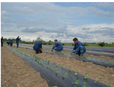
Slika 16. Sadnja stevije na otvoreno

U našim klimatskim uvjetima biljke stevije se sade na otvoreno polovicom svibnja, kada prođe opasnost od pojave kasnog mraza. Razmaci sadnje ovise o mikro – klimatskim uvjetima, malčiranju i načinu sadnje, a kreću se od 80 – 100 cm x 20 cm, čime se postiže sklop od oko 5 biljaka / m 2 , odnosno 50.000 biljaka / ha. Stevia se može saditi na ravno tlo ili na izdignutu gredicu 15 cm visine i 60 cm širine. Ručnim postavljanjem malča razmak između redova može biti 40 cm, a između biljaka oko 20 cm. Stevija izuzetno loše podnosi korovske biljke (plitak korijen), a primjena herbicida nije dozvoljena u ekološkoj proizvodnji, već samo mehanička obrada. Stoga se preporuča malčiranje tla upotrebom crno-bijele PE folije. U mediteranskom dijelu RH se folija okreće tako da je bijela gore (na koju se sadi), dok se u kontinentalnom dijelu sadi na crnu foliju (Slika 16.). (URL 1)