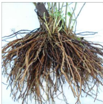
Slika 5. Korijen stevije