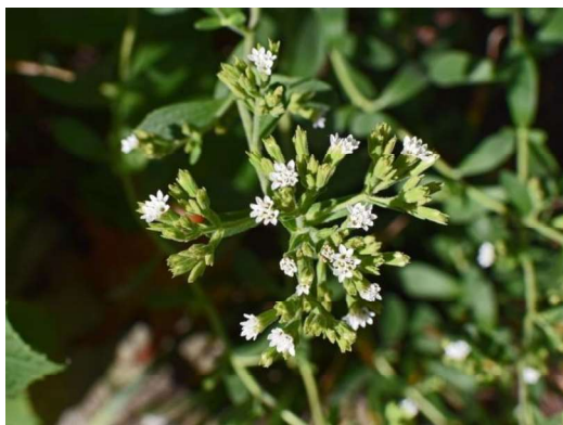
Slika 8. Cvjetovi stevije