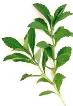
Slika 6. Stabljika stevije s listovima

Stabljika je jednogodišnja, uspravna, poluvunasta, više ili manje obrasla dlačicama, s tendencijom naginjanja, više ili manje razgranata. Tijekom razvoja nema nikakvih posljedica, ali nakon orezivanja, postaje vrlo agresivna biljka koja može razviti i do 25 izboja nakon svakog odsijecanja (Tamayo, 2005.). Stabljika stevije je cilindrična. Iznutra nije šuplja već ispunjena sa srži. Podijeljena je na nodije i internodije. Na nodijima rastu listovi koji su djelomično srasli oko internodija. Stabljika je kratka, a može narasti do svega 100 cm, većinom oko 60 do 80 cm. Na vrhu stabljike izbija cvat sastavljen od 2 do 6 cjetova (Slika 6.).