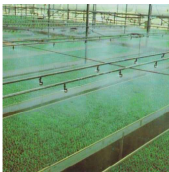
Slika 18. Navodnjavanje mikro-rasprskivačima (izvor: http://pseno.hr/navodnjavanje/ )