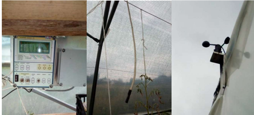
Slika 3. Sustav regulacije bočnih strana plastenika

sondi koje se nalaze duž cijelog plastenika. Također ima i sondu za mjerenje jačine vjetra (Slika 3.).