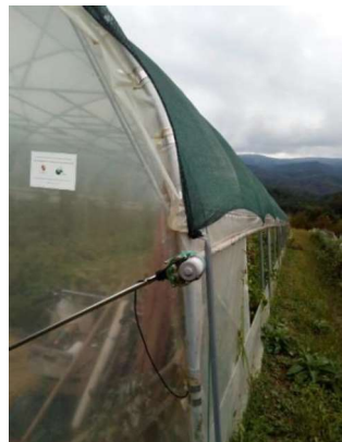
Slika 2. Elektromotor za automatsko podizanje i spuštanje bočnih strana plastenika

Plastenik je podignut uz subvenciju Krapinsko – zagorske županije 2017. godine. Plastenik je veličine 260 m 2 i u njemu se uzgaja sezonsko povrće ( grašak, mladi luk, zelena salata, kupus, rajčica ). Sam plastenik ima automatsko podizanje i spuštanje bočnih strana (Slika 2.).