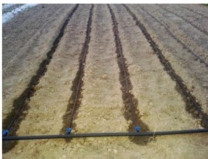
Slika 17. Navodnjavanje cijevima kap po kap

Zbog plitkog korijena steviju treba pažljivo navodnjavati. Na glinasto – ilovastim tlima malčiranim crnom PE folijom , u povoljnim uvjetima, steviju treba zalijevati samo kod sadnje, ili ako su baš iznimno visoke temperature 1 – 2 puta na tjedan ako se vidi da biljka pati zbog nedostatka vode. U mediterasnom dijelu svakako je potrebno predvidjeti navodnjavanje koje treba tijekom ljeta primjeniti 2 – 3 puta tjedno, ovisno o visini temperature i stanju biljke. Važno je naznačiti da se stevija ne smije previše navodnjavati da ne dođe do truljenja korijena, što bi se eventualno moglo desiti u kontinentalnom dijelu Hrvatske (Slika 17.). Navodnjavati se može plastičnim cijevima (T-tape), postavljenim ispod folije, odnosno čvršćim plastičnim cijevima koje mogu izdržati i do 5 godina, ili radi lakše provedbe postavljanjem mikro – rasprskivača (Slika 18.). (URL 1)