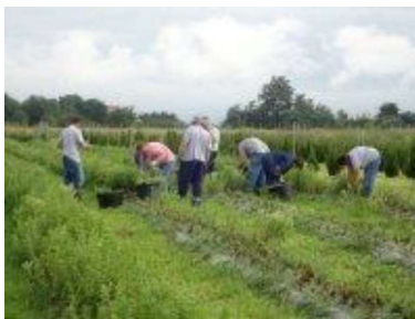
Slika 19. Branje stevije

Vrijeme berbe ovisi o lokaciji, sorti i vremenskim uvjetima tijekom sezone. Obično berba počinje 4 mjeseca nakon sadnje, znači početkom rujna, kada su biljke dosegle visinu od oko 70 cm. Skraćenje dnevnog svjetla inicira cvatnju, a najveća količina steviozida je upravo prije pune cvatnje. Biljke se režu na oko 10 cm iznad tla, slažu se i spremaju za sušenje. Berba može biti jednokratna ili višekratna (biljke se podabiru u određenim razmacima što vrijedi za samo male uzgojne površine). U kontinentalnim uvjetima mora se računati sa jednom pravom berbom, ali ako je duga i topla jesen može se još naknadno pobrati do 1/3 ukupnog prinosa. U mediteranskom dijelu Hrvatske moguće je pobrati u idealnim uvjetima i dvije berbe. Berba se može produljiti do prvih naglih spuštanja temperature, nakon čega nema smisla više brati zbog loše kvalitete lišća (Slika 19.). (URL 1)