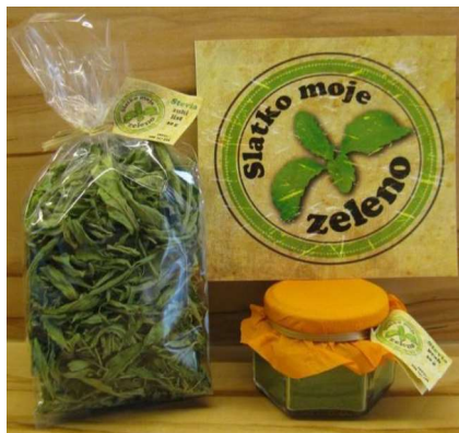
Slika 22. Krajnji proizvod OPG „Zvonko Hursa“

listovi se pakiraju u celofansle prozirne vrećice mase 20g i na njih se stavlja logo OPG – a. Nakon toga se skladišti u posebnu prostoriju i prodaje na raznim sajmovima ili na kućnom pragu.