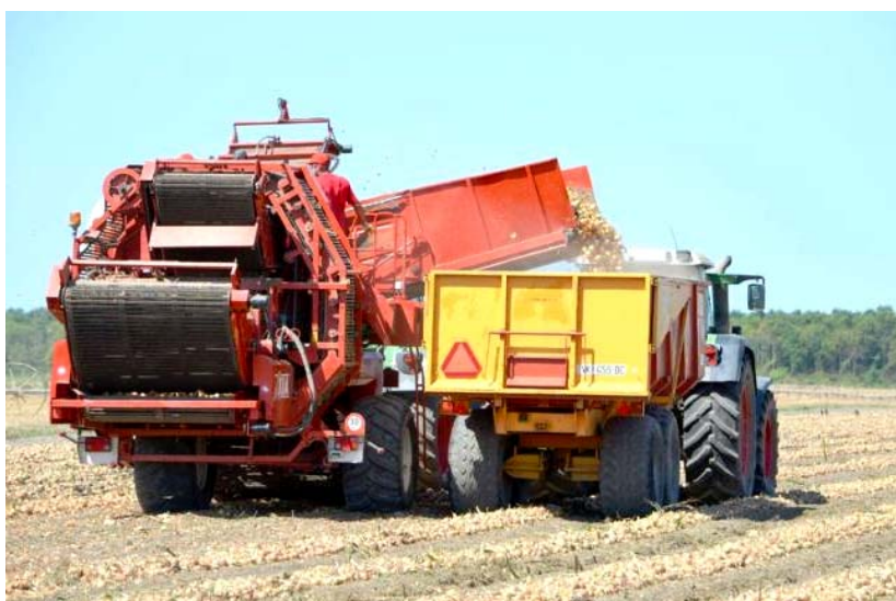
Slika 4. Berba i utovar luka

Tehnološki proces počinje nakon strojne berbe povrća, koja uključuje vađenje, sakupljanje, utovar i transport, njegovim prijemom u pogon za preradu. Slika 4. prikazuje berbu luka kombajnom i utovar u traktorsku prikolicu za transport.