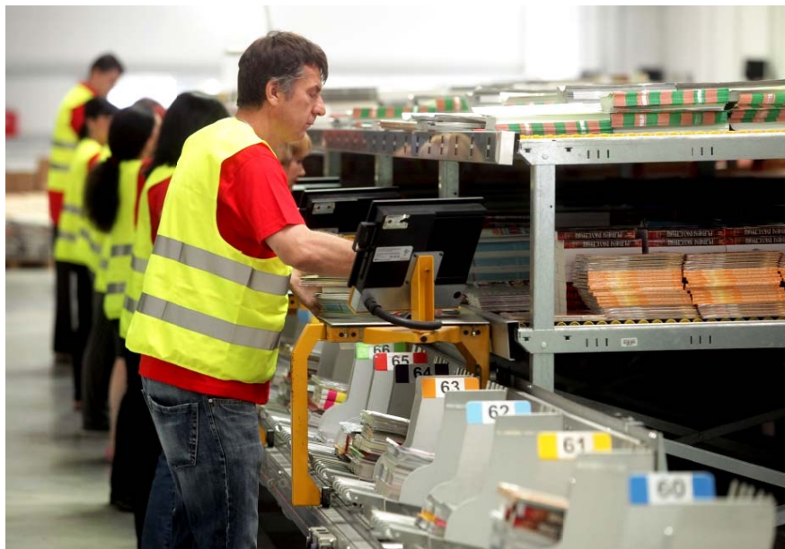
Slika 6. Vaganje i pakiranje luka

Iz skladišta se povrće transportira u pakirnicu gdje se prije pakiranja kalibrira na temelju veličine na više frakcija. Nakon pakiranja na automatskoj vagi, prikazanog na slici 6., proizvodi se slažu na europalette gdje čekaju otpremu za vanjskog kupca po već ugovorenoj dinamici isporuke.