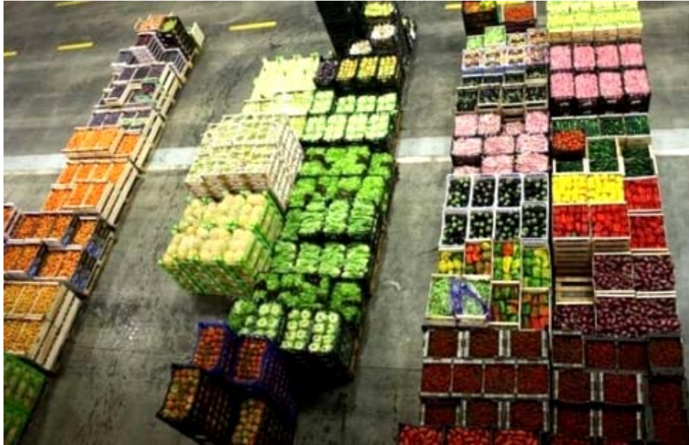
Slika 5. Uskladišteno povrće u paletnom skladištu