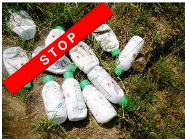
Slika 1. Odbačena ambalaža od pesticida

Većina otpada koji nastaje u poljoprivrednoj proizvodnji neopasni je otpad, no postoji i više vrsta opasnog otpada: fitofarmaceutska sredstva, rabljeno ulje, tekućine od kočnica, olovne baterije, ambalaža od pesticida, fluorescentne cijevi, itd., poput otpada na slici 1.