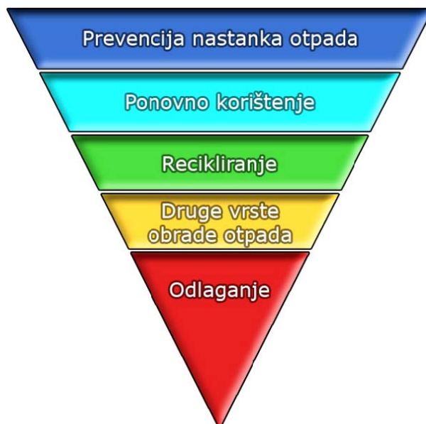
Slika 2. Hijerarhija gospodarenja otpadom

Prema redu prvenstva gospodarenja otpadom prioritet je sprečavanje nastanka otpada, potom slijedi priprema za ponovnu uporabu, zatim recikliranje pa drugi postupci uporabe, dok je postupak zbrinjavanja otpada, koji uključuje i odlaganje otpada, najmanje poželjan postupak gospodarenja otpadom, kao što se vidi na slici 2.