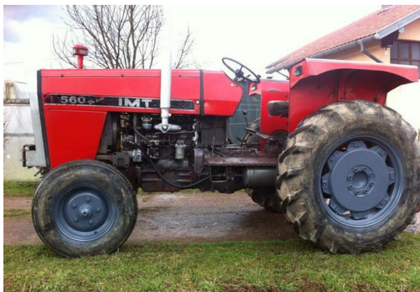
Slika 8. Traktor IMT 560

Gospodarstvo posjeduje 3 traktora: Ursus 1634 snage motora 114kW, IMT 560 snage motora 44kW i IMT 558 snage motora 42kW (Slika 8.). Traktori se koriste sezonski u različite svrhe i tijekom obavljanja različitih agrotehničkih operacija s različitim priključnim strojevima (obrada tla, gnojidba, sjetva, njega i zaštita, košnja trave, sakupljanje trave, baliranje pšeničnih ostataka, odvoz te ostali poslovi).