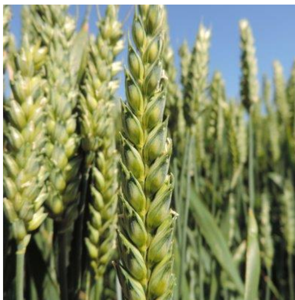
Slika 10. Klas sorte „Kraljica“

„Kraljica“ je najčešće uzgajana sorta u Republici Hrvatskoj. Ovo je visokorodna sorta vrlo dobre kakvoće, koja u velikoj mjeri objedinjuje rodnost i kakvoću. Genetski potencijal rodnosti ove sorte je veći od 11 t/ha. Prosječna visina stabljike iznosi 75 cm. Masa 1000 zrna u prosjeku iznosi 40 g, hektolitarska masa 81 kg/hl, a sadržaj bjelančevina 14,2 %. Vrlo dobre je tolerantnosti na niske temperature i najrasprostranjenije bolesti pšenice, kao i na polijeganje. Optimalni rok sjetve ove sorte je od 10. do 25. listopada u normi sjetve od 500-650 klijavih zrna/m 2 ( https://www.poljinos.hr/proizvodi-usluge/psenica-jecam/psenica/kraljica-i41/ ). Na Slici 10. prikazan je izgled klasa sorte „Kraljica“.