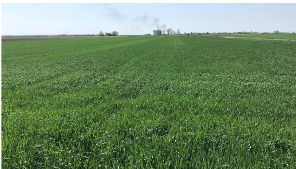
Slika 12. Usjev pšenice sredinom travnja na OPG-u "Smiljka Nedić"

Redovitim praćenjem stanja usjeva pšenice može se pravodobno i pravovaljano zaštititi usjev pšenice registriranim sredstvima za zaštitu bilja od korova, bolesti i štetočina i tako povećati prinos i kakvoću. Izvještajno-prognoznim poslojima u zaštiti bilja predviđa se pojava štetnih organizama, te vrijeme, način i mjere njihovog suzbijanja. Proljetna njega obuhvaća prihranjivanje, drljanje te suzbijanje bolesti, štetnika i korova. Kako je već navedeno, prihrana je obavljena u vrijeme busanja i vlatanja dušičnim gnojivom. Drljanje je obavljeno nakon prihranjivanja kako bi se razbila pokorica. Na Slici 12- prikazana je pšenica u travnju mjesecu na površinama OPG-a „Smiljka Nedić“ iz Bobote.