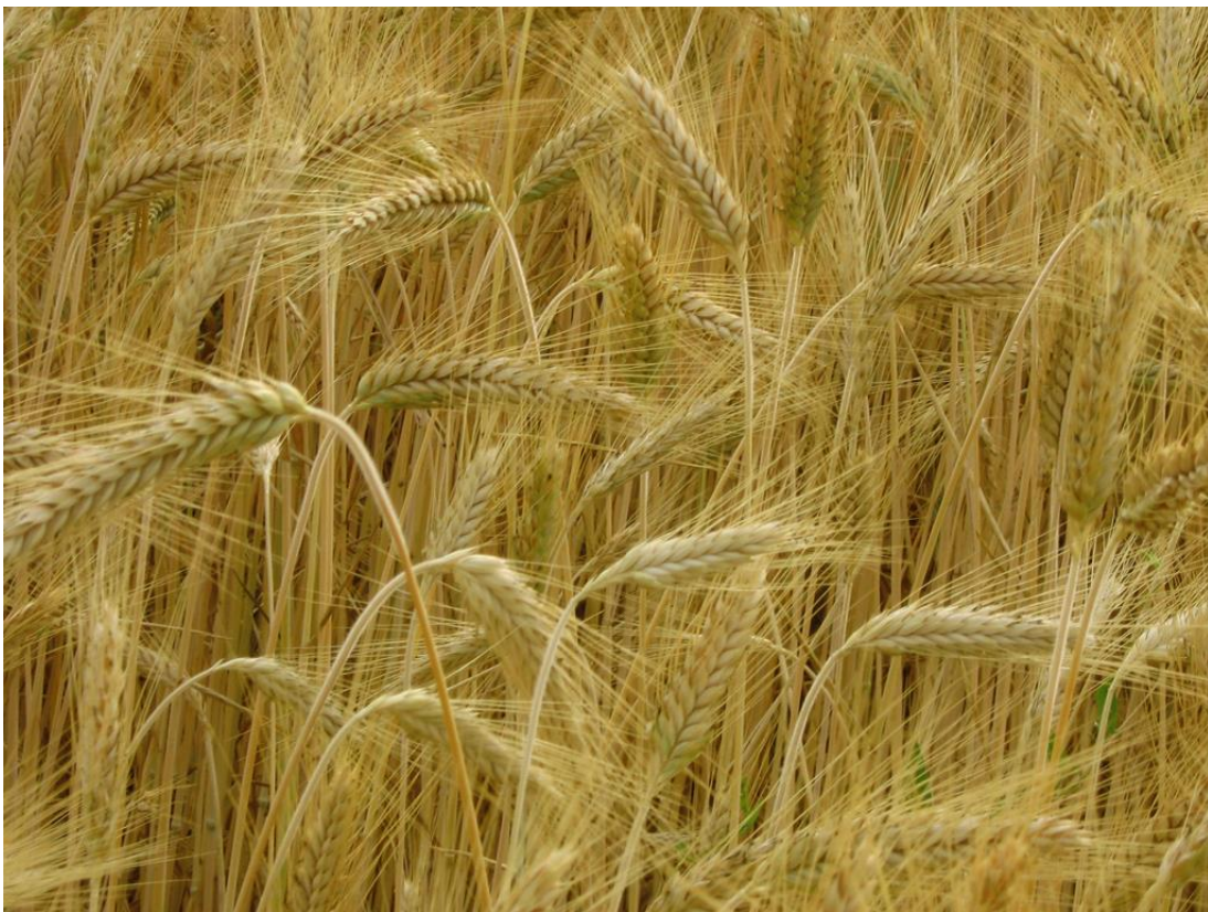
Slika 1. Usjev pšenice

Pšenica ( Triticum aestivum L.) je jednogodišnja biljka iz porodice trava ( Poaceae ). Jedna je od najvažnijih i najrasprostranjenijih kultura na svijetu ( https://www.plantea.com.hr ). Na Slici 1. prikazan je usjev pšenice.