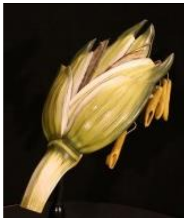
Slika 6. Klasić s izvađenim prašnicima