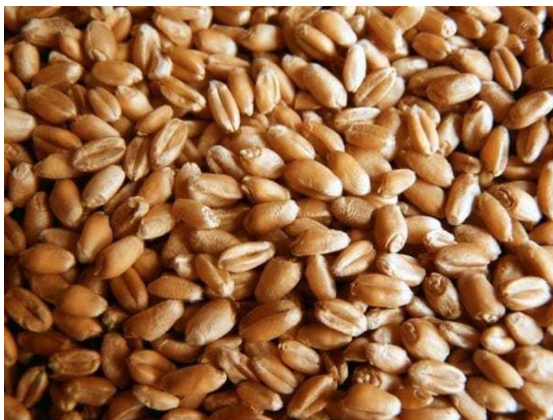
Slika 7. Zrno pšenice