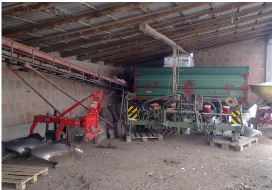
Slika 9. Garažiranje strojeva

Od priključnih strojeva gospodarstvo raspolaže s laganom drljačom, poluteškom drljačom, plugom okretačem, teškom tanjuračom s valjcima, sijačicom, rotacijskom kosilicom, sakupljačem sijena, prikolicama za transport zrna, cisternom i prešom za kockaste bale. Većina strojeva je garažirana ispod nadstrešnica jednostavne gradnje (Slika 9.).