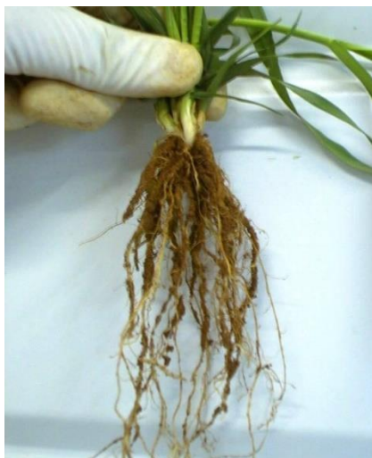
Slika 2. Korijen pšenice

Korijen pšenice je žiličast (Slika 2.), a glavna masa korijenovih žila nalazi se u oraničnom sloju (do 40 cm dubine), a manji dio žila prodire znatno dublje (150-200 cm). Ukoliko je oranični sloj dublji, a tlo povoljnih fizikalnih svojstava, korijen se razvija jače i prodire dublje. Primarno (klicino) korijenje javlja se u vrijeme klijanja sjemena. Ozima pšenica najčešće klija s tri, a jara s pet korjenčića. Ovo korijenje je osnovno korijenje do busanja. Sekundarno korijenje pri optimalnim uvjetima izbija oko tri tjedna poslije nicanja i to iz čvora busanja (Rapčan, 2007.). Optimalna temperatura za rast i razvoja korijena je 20 °C, optimum vlažnosti je oko 60 % PVK, a optimum zbijenosti oraničnog sloja je 1,1-1,25 g/cm 3 (Jurišić, 2007.)