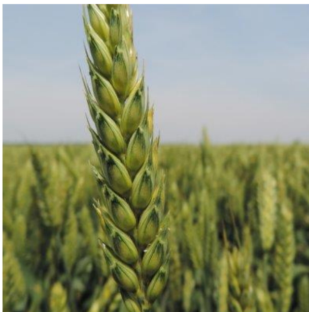
Slika 11. Klas sorte „Srpanjka“

„Srpanjka“ je najranija sorta Poljoprivrednog instituta Osijek. Rana, niska, moderna, stabilna, visokorodna i kvalitetna sorta. Genetski potencijal rodosti veći je od 10 t/ha, a daje visoke i stabilne prinose zrna temeljem velikog broja rodnih klasova po jedinici površine. Ima vrlo nisku stabljiku (oko 64 cm), pa je vrlo dobre tolerantnosti na polijeganje. Masa 1000 zrna u prosjeku iznosi 37 grama, hektolitarska težina 80 kg/hl, a sadržaj bjelancevina 12,8 %. Tolerantna je na niske temperature i brzo se oporavlja nakon zime. Isto tako je tolerantna na rasprostranjene bolesti ozime pšenice. Optimalni rok sjetve je od 10. do 25. listopada un normi sjetve od 650-700 klijavih zrna/m 2 ( https://www.poljinos.hr/proizvodi-usluge/psenica-jecam/psenica/srpanjka-i42/ ). Na Slici 11. prikazan je izgled klasa sorte „Srpanjka“.