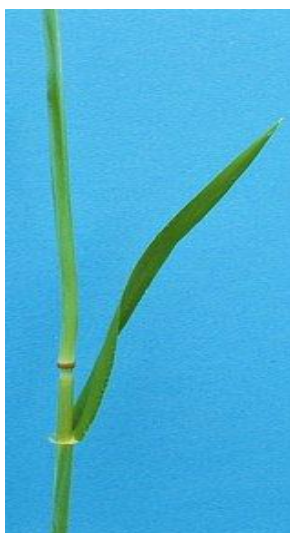
Slika 4. List pšenice

List se sastoji od plojke i rukavca između kojih se nalaze jezičak i uške, kako je prikazano na Slici 4. Pšenica ima dugu, linearnu plojku i najrazvijenije gornje i srednje listove. Po veličini, obliku i boji jezičaka te uški mogu se razlikovati sorte. Sa stajališta formiranja prinosa najznačajniju ulogu ima list zastavica i drugi gornji list, te je važno da se agrotehničkim mjerama ta dva lista održavaju zdravima. Kod pšenice su najrazvijeniji gornji i srednji listovi (Rapčan, 2014.).