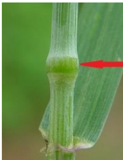
Slika 3. Stabljika pšenice (koljenca vlati označeno crvenom strjelicom)