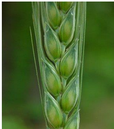
Slika 5. Klasići na klasu pšenice

Cvjetovi su skupljeni u cvat - klas. Klas se sastoji od klasnog vretena, koje je člankovito, a predstavlja produžetak vršnog članka stabljike. Na njemu se nalaze usjeci, pa ono ima koljenast izgled. Na usjecima se nalaze klasići naizmjenično s obje strane (Slika 5.). Razmak među usjecima može biti manji ili veći, pa se razlikuju zbijeni i rastresiti klasovi. Klasić se sastoji od vretenca, dvije pljeve i cvjetova. U jednom klasiću može biti 2-7 cvjetova. Cvijet se sastoji od dvije pljevice, dvije pljevičice, prašnika i tučka (Slika 6.). Oplodnja je autogamna, što znači da pelud pojedinog cvijeta dopijeva na njušku tučka istog cvijeta (Rapčan, 2014.).