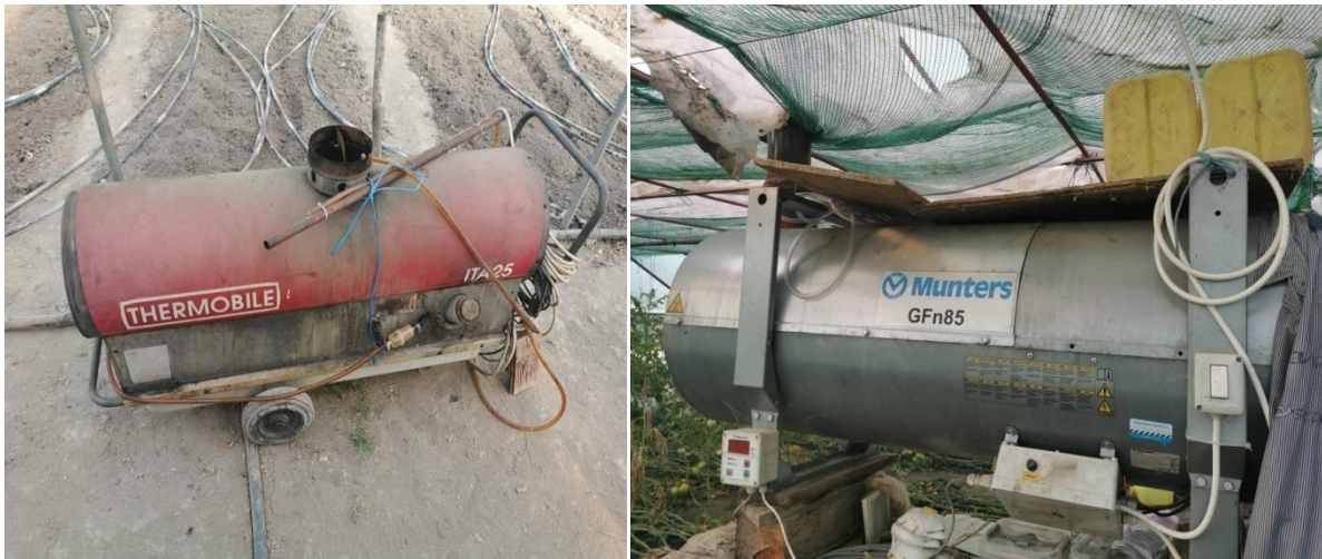
Slika 3. Peći za grijanje tokom zimskih mjeseci

Iz Tablice 1 vidljivo je kako nisu svi plastenici korišteni za proizvodnju u vrijeme zimske sezone, razlog toga je što se dva plastenika koriste za pripremanje zemlje za presadnice i kao prostor za sijanje koji se ne grije. Tri plastenika u kojima se nalaze presadnice griju se s pećima na gorivo prikazanim Slikom 3.