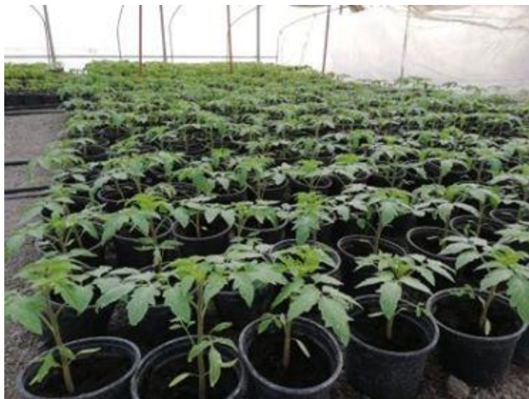
Slika 4. Presadnice rajčice iz vlastite proizvodnje