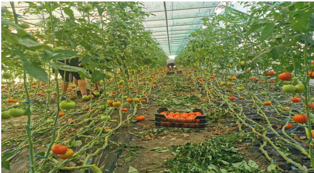
Slika 7. Berba rajčice

oko špage. Kako biljke rastu te grozdovi se penju prema gore, vrši se spuštanje biljaka prema dolje kako je prikazano Slikom 7.