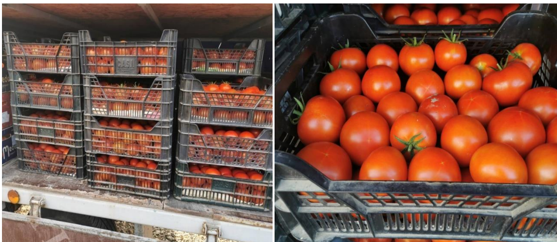
Slika 8. Prva klasa rajčice u ambalaži