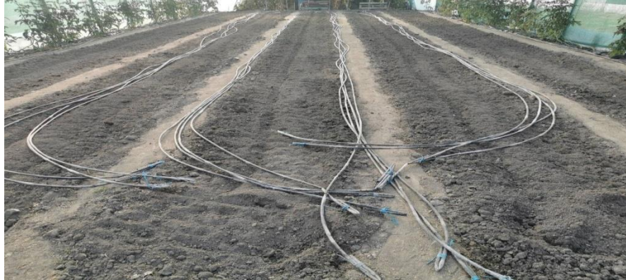
Slika 5. Cijevi za navodnjavanje u plastenicima