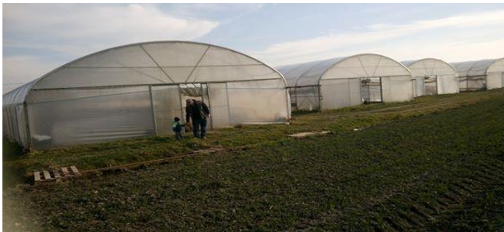
Slika 2. Plastenici i vlasnik OPG-a