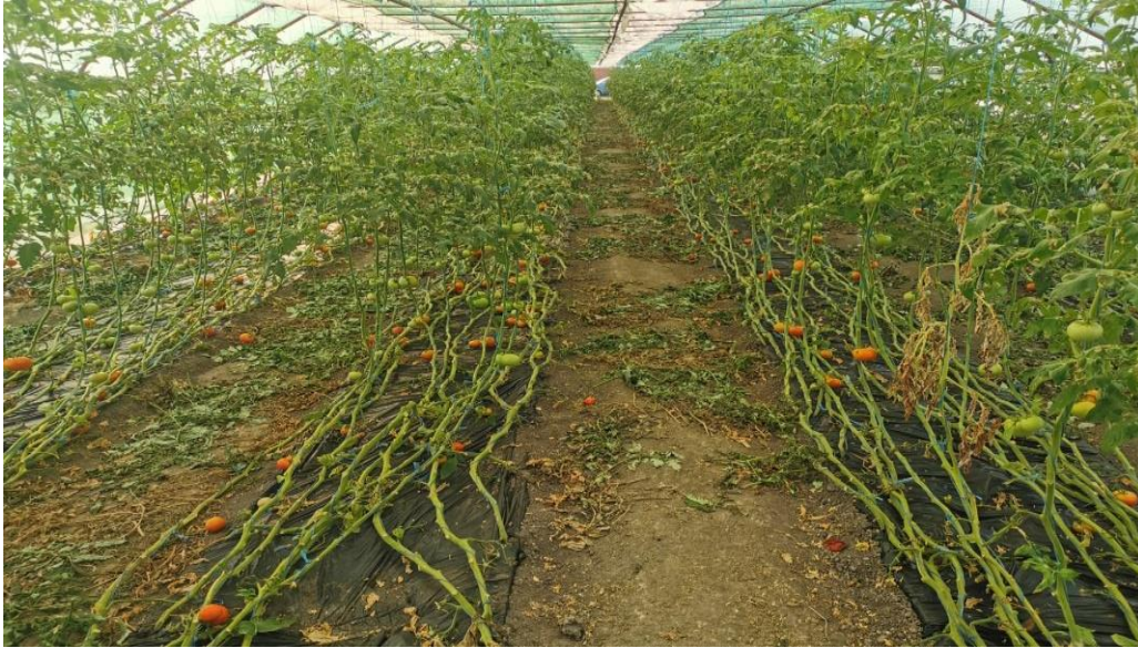
Slika 6. Rajčica u zaštićenom prostoru