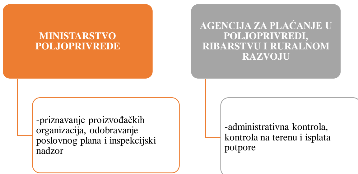
Slika 4. Nadležna tijela proizvođačke organizacije