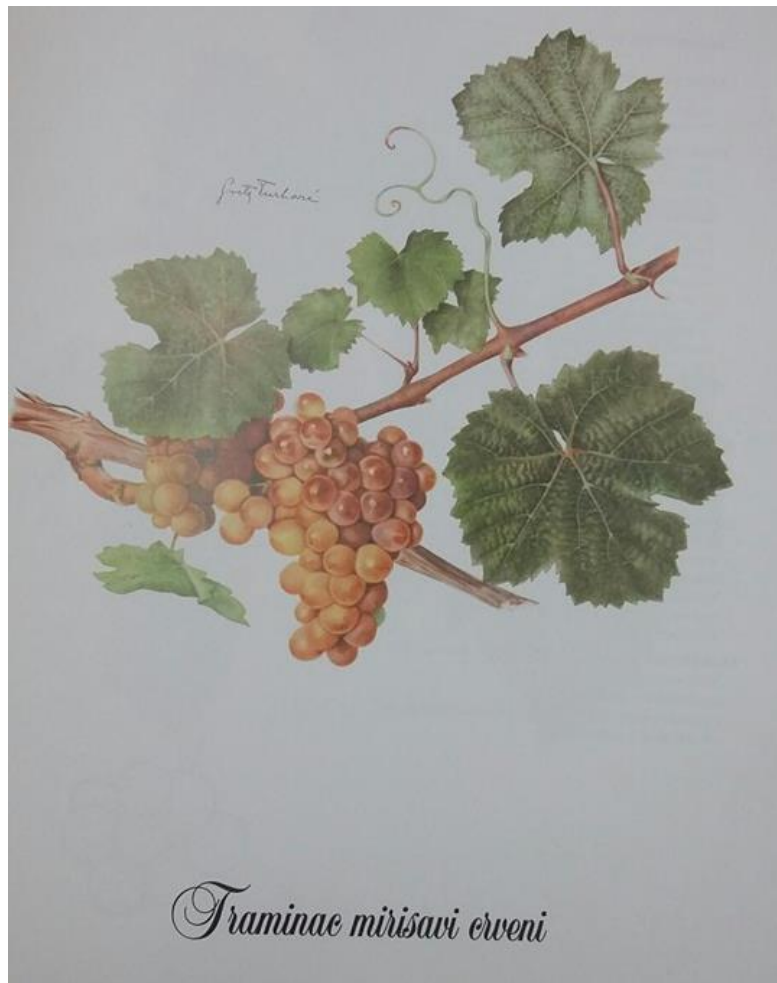
Slika 1. Traminac mirisavi (Mirošević i Turković, 2003.)