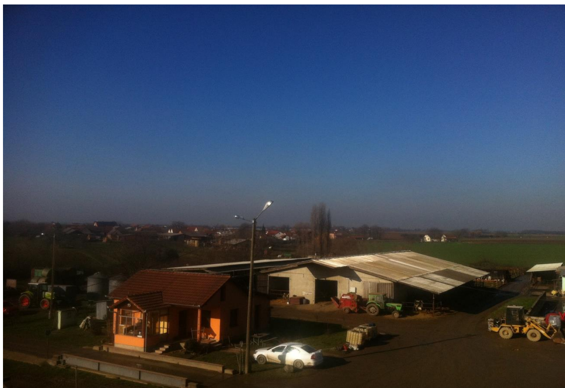
Slika 2. Proizvodni objekti na poljoprivrednom gospodarstvu Rastina