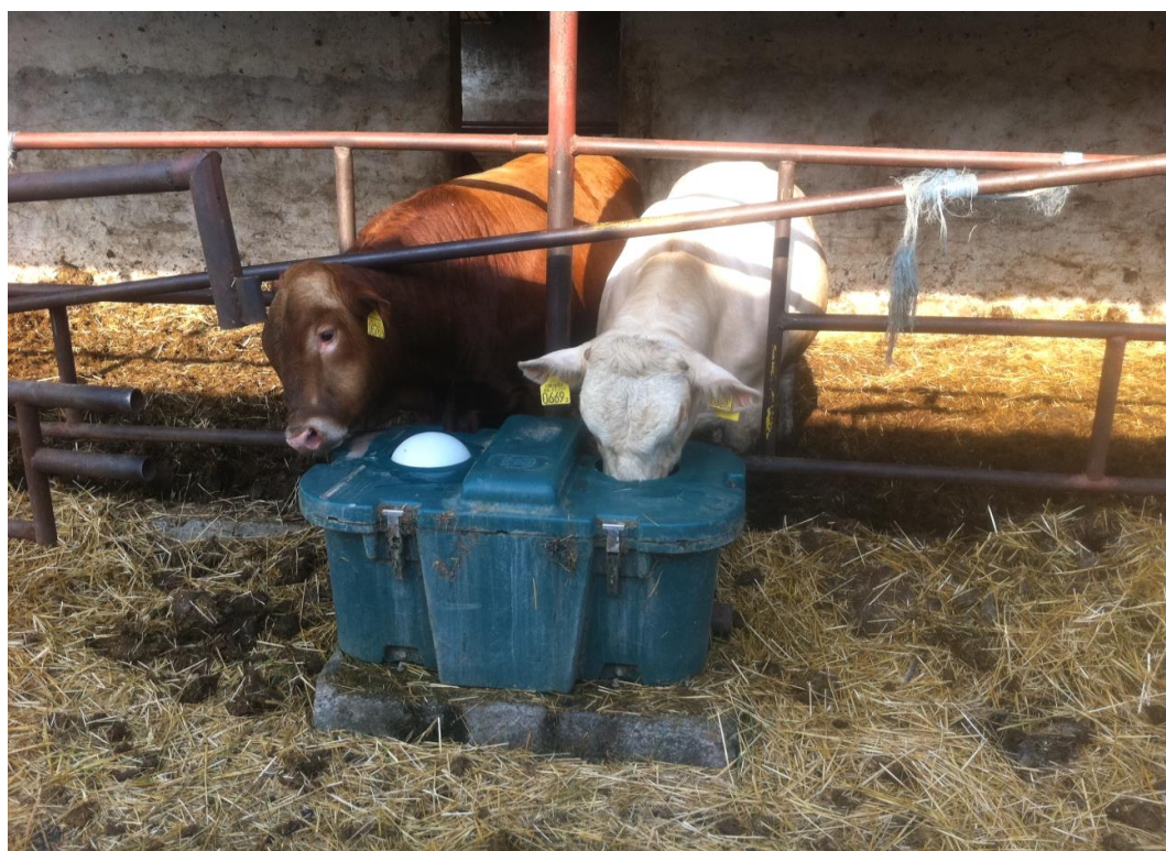
Slika 5. Izvedba pojilica na PG-u Rastina

Visina pojilica trebala bi biti prilagođena visini junadi. Pojilice bi trebalo zaštititi od eventualne štete koja bi mogla nastati prilikom nagurivanja. Pojilice za grupno napajanje goveda koriste se kada je stado u tovilištima veće od 20-ak grla, a primjenu su našle pri držanju junadi u slobodnom držanju. Većih su zapremnina kao i količine vode, te se automatski nadopunjavaju.