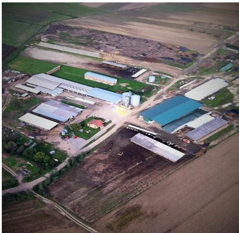
Slika 1. Poljoprivredno gospodarstvo Rastina, Kuševac

silos od 1.000 tona. Na ulazu u gospodarstvo nalazi se mosna ili kolska vaga nosivosti 40 tona. Prema navedenim podacima ali i vidljivom stanju lako je zaključiti kako je gospodarstvo ima zaokružen proizvodni proces, što uvelike olakšava poslovanje ali i opstanak u poljoprivredi.