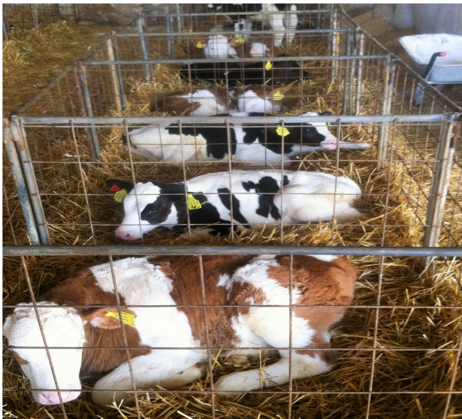
Slika 3. Smještaj teladi dobi do 3 mjeseca na gospodarstvu

Na poljoprivrednom gospodarstvu Rastina junad se tovi primjenom intenzivnog uzgoja i hranidbe. Prosječni dnevni prirast junadi je oko 1.150 do 1.250 grama, ovisno o pasmini i spolu. Nakon što su tovljenici postigli određenu masu, muška telad se odvaja od ženske te ih tove za baby-beef, ili zrelu junetinu ovisno o situacijama na tržištu.