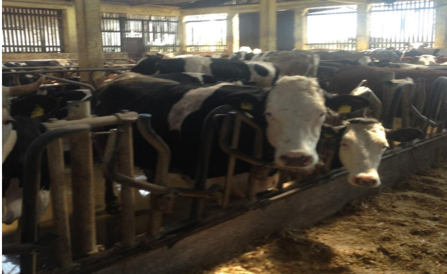
Slika 4. Tovna junad na PG-u Rastina (holstein-friesian, simentalac, limousin, charolais)