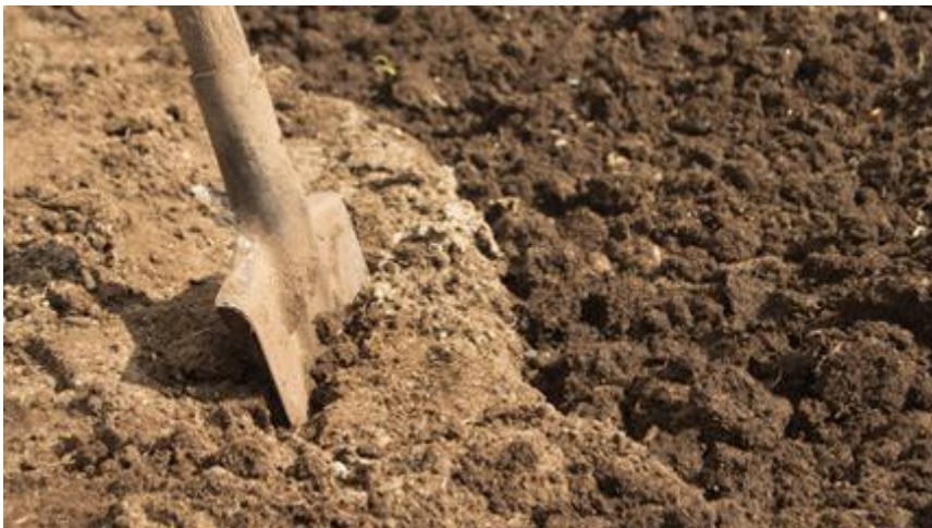
Slika 9. Ilovasto pjeskovito tlo

Dokazano je da postoji uzajamna korelacija između razvijenosti korijenovog sustava i nadzemnog dijela biljke. Stoga će na tlima koja omogućuju dobar razvitak korijena, biti dobro razvijena i nadzemna masa, a samim tim i bolja rodnost (Miljković, 1991.).