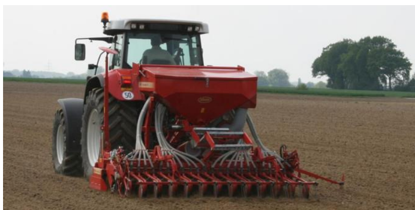
Slika 9. Primjer sijačice za pšenicu

Preporučuje se način sjetve pšenice strojem odnosno sijačicom (Slika 9.). Postoje dva sustava doziranja sjemena kod sijačica, a to su sijačice s pojedinačnim doziranjem sjemena i sijačice sa centralnim doziranjem sjemena (Zimmer i sur., 2009). Sijačicom postizemo povoljan razmak između redova, povoljnu dubinu, dobar vegetacijski prostor i raspored sjemenki. U optimalnim uvjetima razmak između redova bi trebao iznositi 8 cm (Gagro, 1997). Sjetva pšenice na težim i vlažnijim tlima treba biti izvedena pliće, dok za lakša i sušnija tla sjetva treba biti obavljena na većoj dubini zbog lakšeg ostvarivanja kontakta sjemena i vlage. Dubina sjetve bi trebala biti od 4 do 6 cm (Gračan i Todorić, 1990).