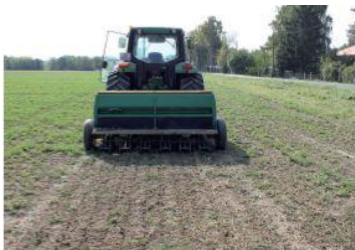
Izravna sjetva u postojeći travnjak

Nedostatci no-tillage sustava su u zahtijevanju nove tehnologije za određenim znanjem proizvođača. Proizvođač mora poznavati: vremensko usklađivanje i primjenu gnojiva koji se razlikuju od klasične gnojidbe, dubinu sjetve, na koji se način ostvaruje kontakt sjemena s tlom i pokrivenost sjemena bez usitnjenog sjetvenog sloja, pravilnu primjenu odgovarajućih herbicida i insekticida u borbi protiv korova i širenja štetnika u zaraženim biljnim ostatcima.