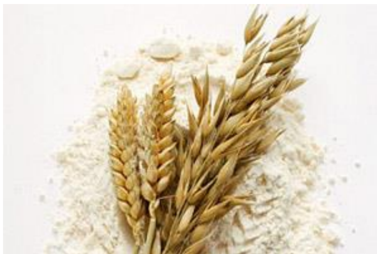
Slika 2. Pšenično brašno

Značaj pšenice je i u agrotehnici. Pogodna je u plodoredu i kao pretkultura za druge kulture. Nakon žetve pšenice koja se relativno rano žanje ostaje dovoljno vremena do sjetve idućeg usjeva za dobru i kvalitetnu obradu tla.