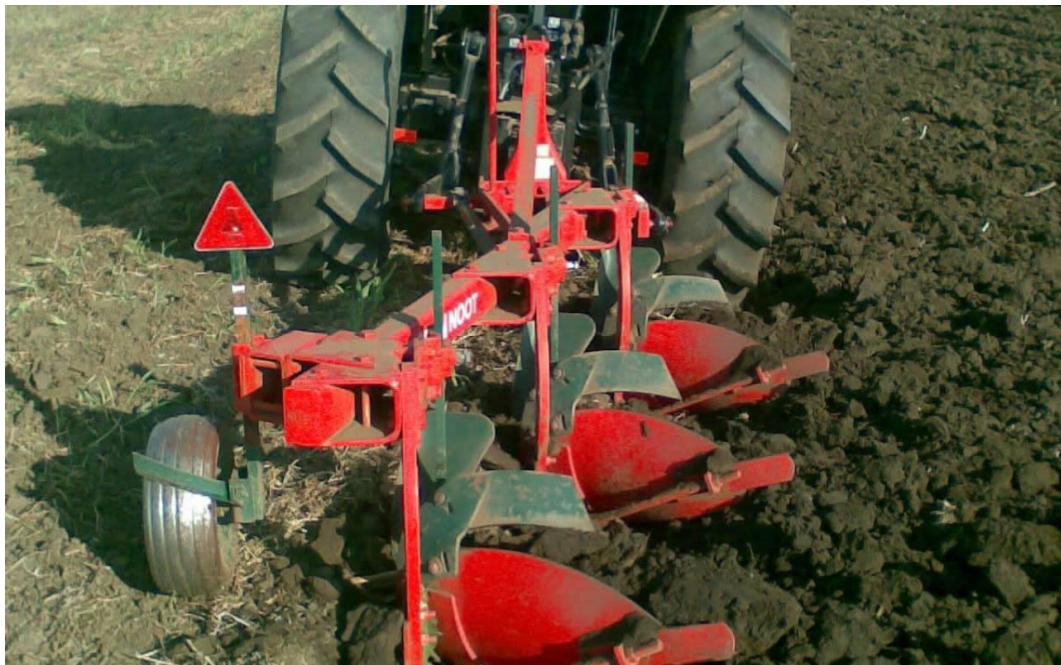
Slika 5. Predsjetveno oranja

Predsjetveno oranje se obavlja na dubinama od 25 – 30 cm i obavlja se oko petnaestak dana prije sjetve (Slika 5.). Poslije srednje kasnih pretkultura se može izvesti plitko oranje na dubinu od desetak centimetara, a zatim na punu dubinu predsjetveno oranje. Nakon kasnih pretkultura obavlja se samo predsjetveno oranje zbog kratkog vremena koje ostaje za pripremu tla. Osnovnom obradom tla postizemo normalan razvoj biljaka i utječemo na visinu prinosa.