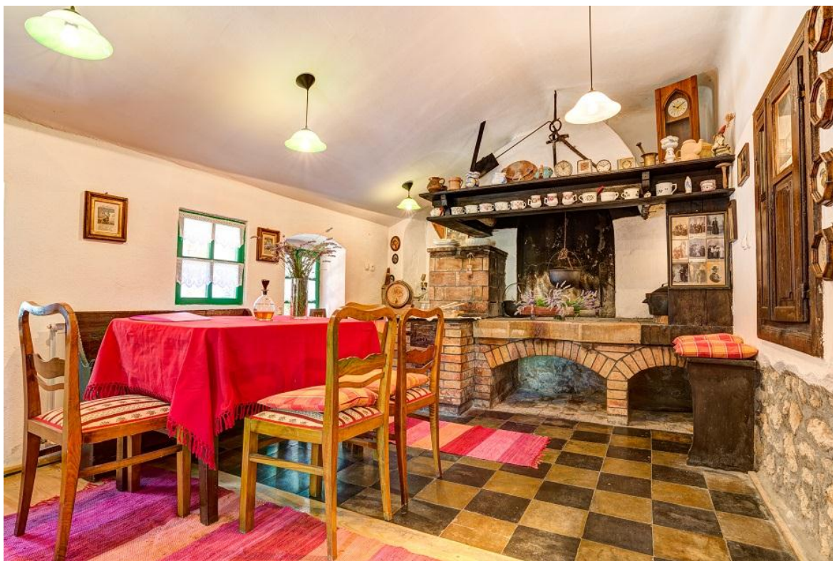
Slika 7: Ognjišće – Villa Vesna

Poljoprivredna proizvodnja bazira se na maslinarstvu, vinogradarstvu i uzgoju lavande. Posađeno je 60 sadnica maslina, pretežito domaće sorte Oblica, 300 sadnica loze domaće, krčko-vinodolske sorte Žlahtina, te 300 sadnica lavande. Poduzetnička vizija je da se u budućnosti, kada masline i loza dođu u rod, maslinovo i lavandino ulje, te vino prodaju vlastitim gostima.