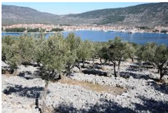
Slika 3: Maslinik PZ Cres ( http://www.pz-cres.hr/obiljezja-otoka-cresa/ )

Ne treba zaboraviti niti na onu osnovnu, poljoprivrednu komponentu. Poljoprivredna zadruga Vrbnik, kao nositelj kvalitete u proizvodnji bijelog vina Žlahtina koje se dobiva od autohtone sorte grožđa istog imena, sa pratećim manjim obiteljskim vinarijama temelj je razvitka vrbničke općine. Na otoku Cresu djeluje Poljoprivredna zadruga Cres čije extra djevičansko maslinovo ulje je jedno od tek šest hrvatska proizvoda (ogulinsko zelje, istarski pršut, krčki pršut, neretvanska mandarina i baranjski kulen) koje ima zaštitu autohtonosti. Tu su i nadaleko poznat ovčari sa Cresa i Lošinja sa svojim proizvodima, kako od mlijeka, tako i od mesa.