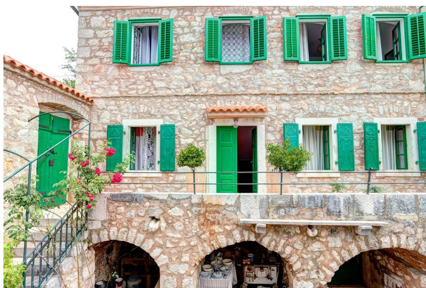
Slika 6: Villa Vesna

Primarna aktivnost tvrtke je ruralni turizam. Na oko pola hektara zemljišta, na brdu koje gleda na Vinodolski kanal i kvarnerske otoke dvije su stogodišnje obiteljske kuće koje se renovirane na način da zadrže duh starih vremena, ali uz sve prednosti 21. stoljeća. Osim kuća obnovljena je i stara štala koja je također, kao i preostale dvije kuće, u funkciji turizma kao kuća za odmor. Svaka kuća ima svoj privatni prostor sa bazenom, sunčalištem i mjestom za roštilj. Posebnost velike kuće koja je dvojini objekt je da je u podrumu, tradicionalnoj konobi i ispod volti uređen mali etnomuzej, a kuće se ukrašene slikama Tonija Franovića, akademskog slikara porijeklom iz vinodolskog mjesta Grižane. specifičnost slika je da su slikane vinom, modrom galicom, blatom, a na staroj posteljini. Uređenje i oprema kuća izvedeno je pod paskom Konzervacijskog odjela u Rijeci.