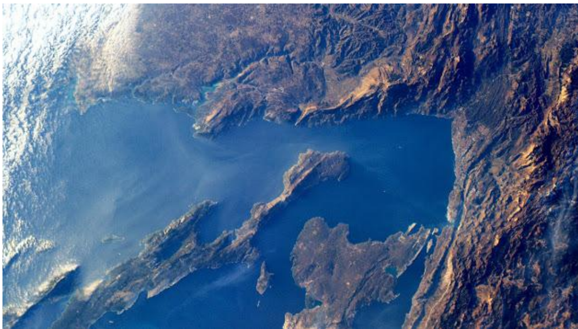
Slika 1: Satelitska snimka Kvarnera

Cilj ovog rada je pobliže se upoznati sa stanjem na terenu, u smislu organizacije poljoprivredne proizvodnje, načinima kako se poljoprivredna proizvodnja može uklopiti u najbitniju privrednu granu regije, te, u konačnici, kako se ruralni predio Kvarnera može valorizirati u nepoljoprivrednim djelatnostima na obiteljskim gospodarstvima. U dijelu rada naglasak će biti stavljen i na mogućnosti financiranja projekata kroz fondove Europske Unije.