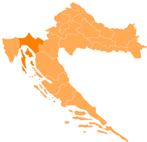
Slika 2: Primorsko-goranska Županija ( https://hr.wikipedia.org/wiki/Primorsko-goranska_%C5%BEupanija )

Primorsko-goranska županija, kako i samo ime kaže, ima svoju primorsku i svoju kopnenu, goransku, komponentu. Uže područje Kvarnera obuhvaća upravo ovaj primorski dio Primorsko-goranske županije. To je područje od Grada Novog Vinodolskog na istoku do mjesta Brseč na zapadu (Općina Mošćenička Draga), te otoke Rab, Cres, Lošinj i Krk sa pripadajućim arhipelazima. Županija obuhvaća prostor od 3.588 km 2 (oko 6.3% površine Hrvatske).