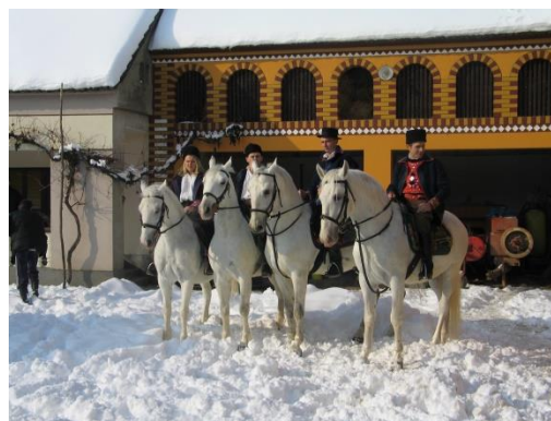
Slika 8. Pokladno jahanje