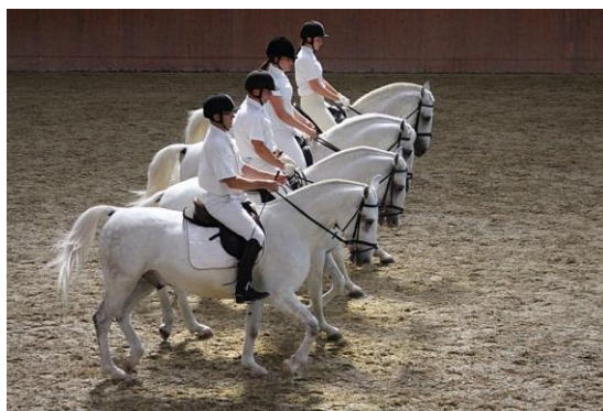
Slika 12. Dresurni jahači ergele Đakovo