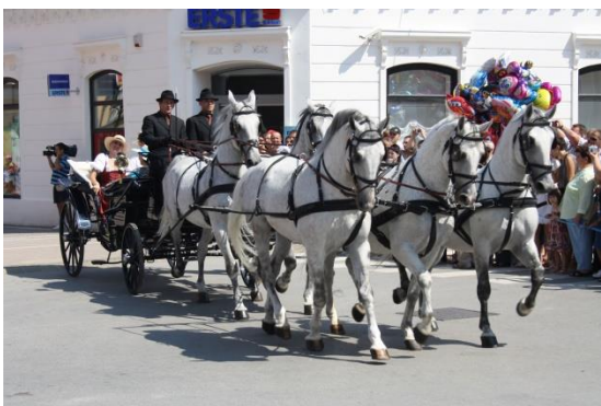
Slika 11. Peteropreg đakovačkih lipicanaca

Prema prikazanim tablicama, zaključuje se da je od autohtonih pasmina u najkritičnijem stanju, pasmina Međimurskog konja, koja broji svega 37 grla, te kako bi opstala potrebno je povećavati broj grla, u svim kategorijama, dok je u najboljem brojčanom stanju zaštićena lipicanska pasmina.