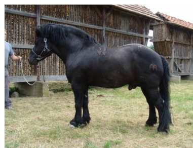
Slika 6. Međimurski konj