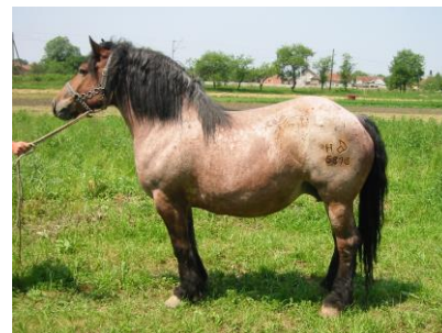
Slika 2. Hrvatski posavac