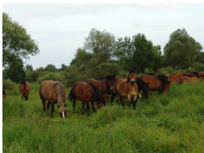
Slika 1. Hrvatski posavci

Počinje se uzgajati u prvoj polovici devetnaestog stoljeća. Eksterijerne odlike hrvatskog hladnokrvnjaka su čvrsta konstitucija, siguran korak i ravnoteža, te je poznat kao težak, širok i robustan nizinski konj.