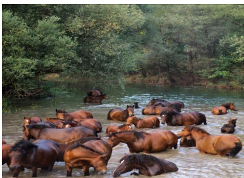
Slika 3. Hrvatski posavci

Hrvatski posavac pripada kategoriji srednje teških konja koje karakterizira čvrsta konstitucija. Glava je suha, mala, širokog čela, ravnog profila, plemenitog izražaja, malih ušiju, velikih i izraženih očiju i nozdrva. Vrat je umjereno dug, sa dobro razvijenim mišićjem, čvrsto nasaden na trup. Grudni koš je širok i dubok. Lopatice su umjereno duge, koso položene, dobro obrasle mišićjem i čvrsto vezane s trupom. Leđa hrvatskog posavca su srednje duga, jaka i široka, kratkog, jakog i širokog spoja. Sapi su dobro razvijenog mišićja, široke, umjereno oborene, te rascijepljene. Trbuh je umjerene veličine i zaobljen, dok je trup zbijen. Noge su suhe i snažne, zglobovi izraženi, a cjevanica kratka, dok su kičice slabo obrasle kratkim dlakama. Stavovi nogu su korektni, dok su kopita široka i povoljno građena. Griva i rep su obrasli valovitom srednje dugom dlakom. (HPRRR, 2010.)