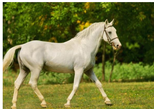
Slika 10. Lipicanac Autor: M. Romulić

U 2018. godini lipicanska pasmina broji 2.112 grla, te se prema FAO/EAAP klasifikaciji smatra neugroženom pasminom.