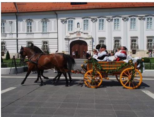
Slika 7. Đakovački vezovi

U Slavoniji lipicanac predstavlja dio tradicije, te je vrlo često prisutan i predstavlja autohtoni nacionalni identitet na različitim manifestacijama koje njeguju brojne konjogojske udruge.