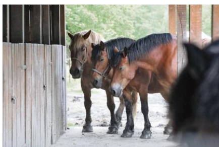
Slika 5. Međimurski konji