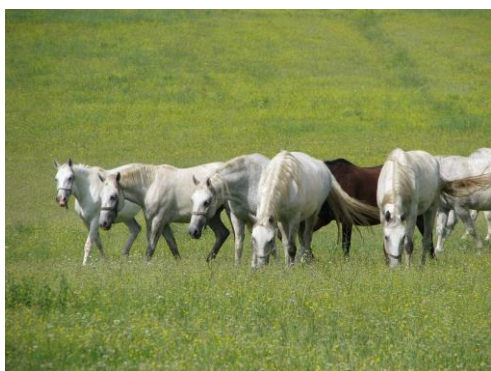
Slika 9. Lipicanci Autor: S. Butković

Lipicanski konji poznati su po plemenitoj i čvrstoj tjelesnoj građi, otpornosti, skromnosti u smještaju i hranidbi, sposobnosti učenja i volji za radom. Glava im je srednje duga, umjerene veličine, a oči su im bistre i radoznale. U nosnom dijelu glave može se javiti umjerena konveksnost. Vrat se ističe lijepom povijenošću, mišićjem i visokom nasadenošću. Prsa su umjerene dubine i širine. Lopatica je duga, blago položena i dobre mišićavosti. Sapi su im blago zaobljene, čvrste i jake. Noge su korektno građene, stav nogu korektan, dok su zglobovi naglašeni i suhi, a upravo im to omogućava njihove elegantne kretnje. Kretnje su izdašne, prepoznate po visokom hodu i dugom koraku. Lipicanac se uzgaja na cijelom području Republike Hrvatske, a naročita intenzivnost uzgoja ističe se u Slavoniji i Baranji. Ergele u Đakovu i Lipiku kao matične ergele lipicanske pasmine predstavljaju centar uzgoja lipicanaca u Hrvatskoj i svojim radom kontinuirano izravno i neizravno utječu na podizanje kvalitete u zemaljskom uzgoju. Lipicanac je uzgojno prisutan u mnogim drugim zemljama, a važniji uzgoji su u Sloveniji, Austriji, Italiji, Hrvatskoj, Mađarskoj, Rumunjskoj i Slovačkoj. (MPRRR, 2010.)