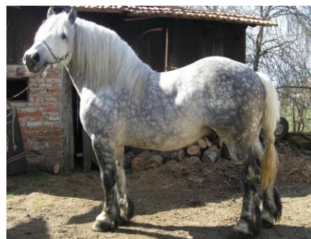
Slika 4. Hrvatski posavac