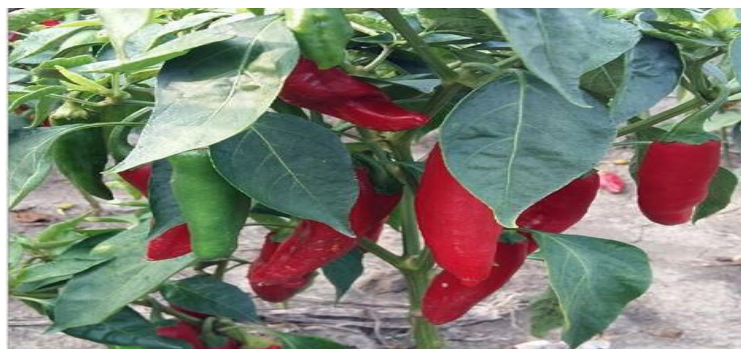
Slika 7. Sorta Szegedi f2

Szegedi f2 (Slika 7.) je sorta ljute začinske paprike visećeg položaja plodova na biljci, a slatka je sorte Katarina . Biljke su visoke 40 – 50 cm. U fiziološkoj zriobi plodovi su tamnocrvene boje, dužine 12 – 14 cm i mase 8 – 10 grama. Fiziološki zreli plodovi sadrže 20 % suhe tvari. Visoke je tolerantnosti na bolesti (Tadijan, 2015.).