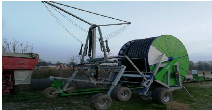
Slika 12. Kišno krilo proizvođača Irtec

sustavom kišnog krila obavlja se tako da se tifon postavi na jednu stranu usjeva (njegov hod u istraživanju je 550 m) te se kreće prema drugom kraju uslijed tlaka u sustavu. Radni zahvat jednog prohoda tifona je 60 m (Slika 13.), a potrebno vrijeme da tifon jednom prođe po usjevu je 5 do 6 sati. Navodnjavanje se obavlja rano u jutro ili kasno na večer zbog najmanjih razlika temperature vode i temperature zraka. Na količinu vode pri navodnjavanju utječe nam stadij razvoja u kojem se biljka nalazi. Tako je nakon sjetve potrebna količina vode od 20 l/m 2 tjedno, a nakon nicanja i ukorjenjivanja biljaka količina se smanjuje na 10 l/m 2 tjedno. Najveća količina vode nam je potrebna kada je biljka u cvatnji i pred zriobu čak 30 – 35 l/m 2 tjedno.