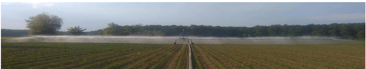
Slika 13. Kišno krilo proizvođača Irtec u radu