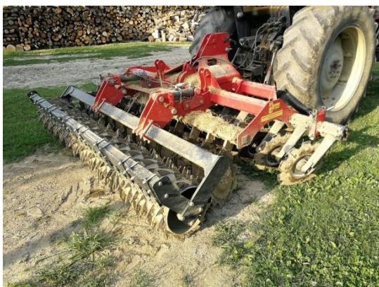
Slika 4. Kratka tanjurača proizvođača Metal – Fach radnog zahvata 3 m