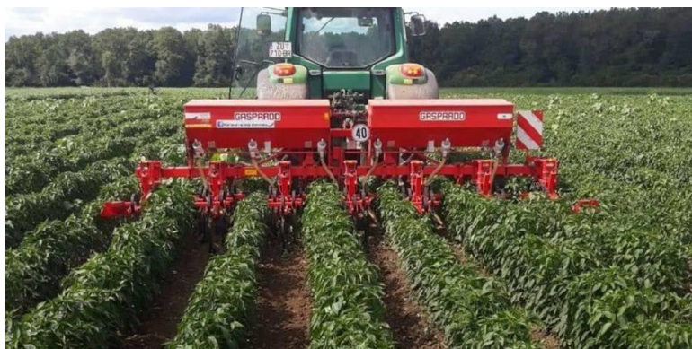
Slika 11. Kultivator Gaspardo HP 6 u radu, treća kultivacija i prihrana