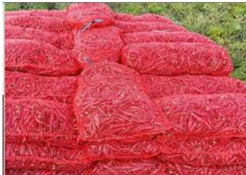
Slika 15. Paprika u mrežastim vrećama

Grane paprike su jako krhke stoga se berba mora obavljati pažljivo kako se ne bi polomile. Nakon što se plod ubere stavlja se u plastične posude. Kada se posuda napuni istrese se u mrežaste vreće (Slika 15.), a vreće se slažu na traktorsku prikolicu (Slika 16.).