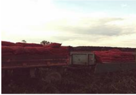
Slika 16. Paprika spremna za transport