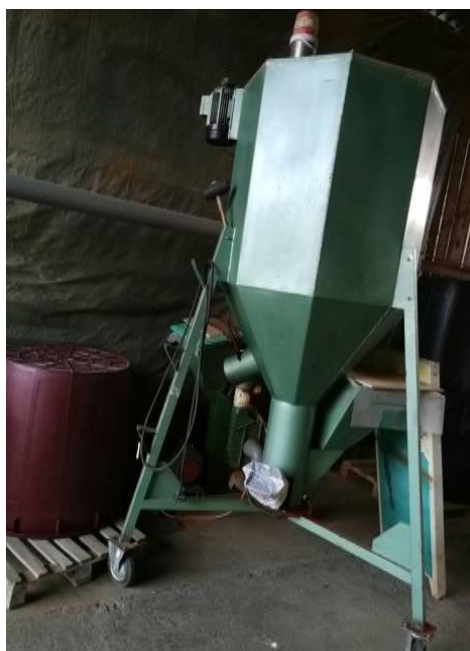
Slika 23. Mješalica za papriku

Tako usitnjena paprika čuva se u posudama i prije pakiranja se miješa u mješalici pogonjenoj trofaznim elektromotorom snage 3,5 kW (Slika 23.). Usitnjena paprika se miješa zbog izjednačavanja teksture i kako bi svi kupci dobili jednak, kvalitetan proizvod. Završni korak u proizvodnji začinske paprike je njezino pakiranje. Paprika proizvedena na poljoprivrednom obrtu „Marić“ strojno se pakira i hermetički zatvara u vrećice mase 100 g, 250 g i 500 g.