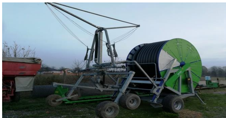
Slika 12. Kišno krilo proizvođača Irtec

sustavom kišnog krila obavlja se tako da se tifon postavi na jednu stranu usjeva (njegov hod u istraživanju je 550 m) te se kreće prema drugom kraju uslijed tlaka u sustavu. Radni zahvat jednog prohoda tifona je 60 m (Slika 13.), a potrebno vrijeme da tifon jednom prođe po usjevu je 5 do 6 sati. Navodnjavanje se obavlja rano u jutro ili kasno na večer zbog najmanjih razlika temperature vode i temperature zraka. Na količinu vode pri navodnjavanju utječe nam stadij razvoja u kojem se biljka nalazi. Tako je nakon sjetve potrebna količina vode od 20 l/m 2 tjedno, a nakon nicanja i ukorjenjivanja biljaka količina se smanjuje na 10 l/m 2 tjedno. Najveća količina vode nam je potrebna kada je biljka u cvatnji i pred zriobu čak 30 – 35 l/m 2 tjedno.