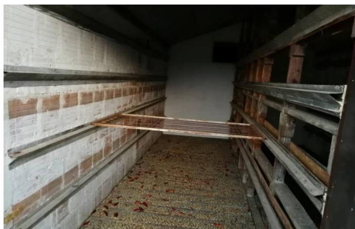
Slika 18. Unutarnji izgled sušare