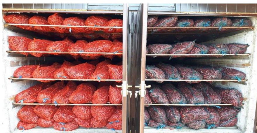
Slika 19. Složena paprika spremna za sušenje