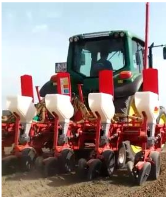
Slika 9. Gaspardo Monika MTR 6 redna sijačica u radu