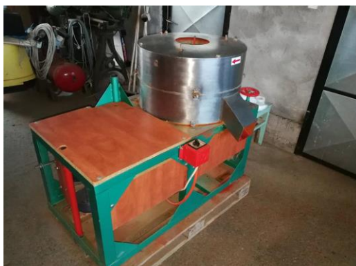
Slika 22. Kameni mlin

Tako usitnjena paprika čuva se u posudama i prije pakiranja se miješa u mješalici pogonjenoj trofaznim elektromotorom snage 3,5 kW (Slika 23.). Usitnjena paprika se miješa zbog izjednačavanja teksture i kako bi svi kupci dobili jednak, kvalitetan proizvod. Završni korak u proizvodnji začinske paprike je njezino pakiranje. Paprika proizvedena na poljoprivrednom obrtu „Marić“ strojno se pakira i hermetički zatvara u vrećice mase 100 g, 250 g i 500 g.