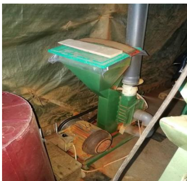
Slika 21. Mlin čekićar proizvođača Pomak d.o.o. Kraljevo

Suha paprika koja je izvađena iz sušare ide na usitnjavanje. Prije samog usitnjavanja potrebno je iz sve paprike izdvojiti one koje su oštećene ili slabije kvalitete. Usitnjavanje se obavlja mlinom čekićarom (Slika 21.) kojeg pogoni trofazni elektromotor snage 7,5 kW. Paprika se usitjava tri puta. Prvi put se usitjava mlinom čekićarom na 1,2, a drugi put na sito 0,6. Posljednje treće usitnjavanje se obavlja na kamenom mlinu pogonjenom trofaznim motorom snage 7,5 kW (Slika 22.), kako bi se dobila potrebna finoća.