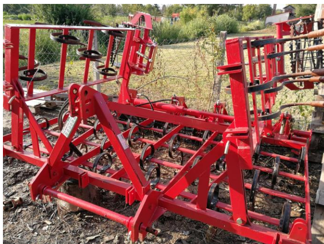
Slika 5. Sjetvo spremač proizvođača Consum radnog zahvata 3,6 m