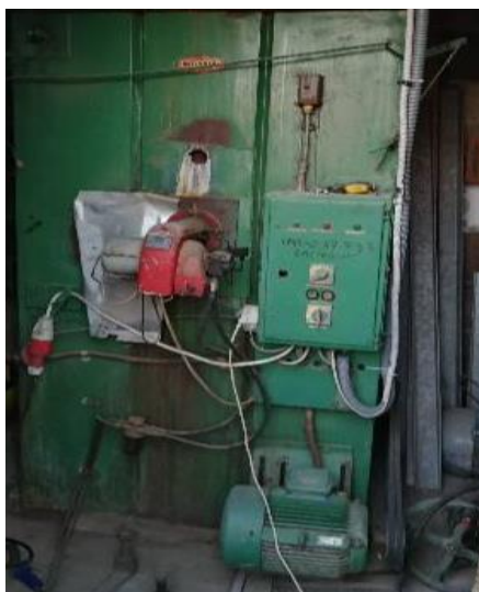
Slika 20. Pogon sušare, plamenik i elektromotor proizvođača Končar