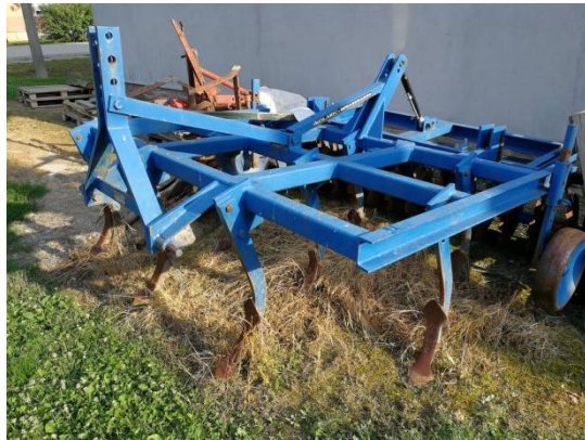
Slika 3. Podrivač proizvođača Rabewerk radnog zahvata 2,5 m