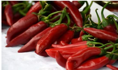
Slika 14. Zreli plodovi paprike

bude najviše zrelih plodova te tada berbu obavlja i više ljudi. Beru se samo zdravi plodovi koji su tamnocrvene boje bez oštećenja i koji nisu bolesni. Bolesni i oštećeni plodovi beru se i ostavljaju na tlu.