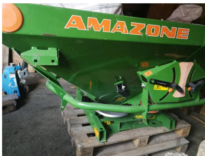
Slika 6. Raspodjeljivač stajskog gnojiva proizvođača Amazone