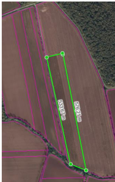
Slika 1. Parcela na kojoj je uzgajana začinska paprika 2018. godine, arkod broj 3199573

uljarice. Obrt se također bavi proizvodnjom i drugih povrćarskih kultura, paprika, kupus i češnjak. Za sve te potrebe gospodarstvo koristi raznovrsnu mehanizaciju. Tri traktora različitih snaga motora, jedan žitni kombajn sa svim potrebnim priključcima za sve kulture. Također više vrsta sijačica, za pšenicu i žitarice, te za okopavine i koju na obrtu koriste za sjetvu začinsku papriku. Strojevi za osnovnu obradu tla koju koristi gospodarstvo su plugovi okretači Vogel&Noot 3 brazde (Slika 2.) i Lemken 5 brazdi, te podrivači (Slika 3.) i ostali rahljači tla. Za dopunsku obradu strojevi koji se upotrebljavaju su teške drljače, tanjurače, kratke tanjurače kao što je tanjurača Metal – Fach radnog zahvata 3 m (Slika 4.), te sjetvospremači (Slika 5.). Od ostalih strojeva tu su još raspodjeljivači za mineralna (Slika 6.) i stajska gnojiva te kultivatori i sustavi za navodnjavanje, od kojih će jedan biti naveden i objašnjen u uporabi. U sezoni gospodarstvo zapošljava i sezonske radnike ponajviše za branje začinske paprike te ostalih poslova na gospodarstvu.