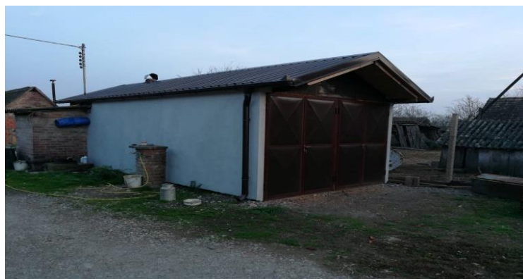
Slika 17. Vanjski izgled sušare