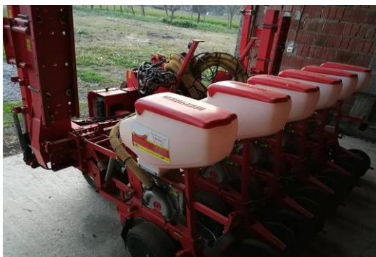
Slika 8. Gaspardo Monica MTR 6 redna sijačica

Sjetva paprike na poljoprivrednom obrtu „Marić“ obavlja se od 10. do 15. svibnja ovisno o uvjetima tla. Sjetva se obavlja Gaspardo Monica MTR 6 rednom sijačicom na dubinu od 2 cm, razmak biljaka unutar reda je 5 cm, a međuredni razmak je 70 cm (Slika 9.). Gaspardo Monica MTR 6 je pneumatska sijačica sa hidrauličnim podešenjem međurednog razmaka. Sjetvene pločice na sijačici prilagođenoj za sjetvu začinske paprike imaju 36 rupa promjera 1,1 mm. Sijačica (Slika 8.) ima hidraulički podesive markere i spremnik za sjeme zapremine 32 l (Link 4.). Nakon sjetve usjev se navodnjava sa 20 l/m 2 tjedno.