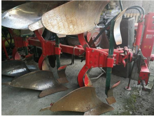
Slika 2. Plug okretač proizvođača Vogel&Noot 3 brazde