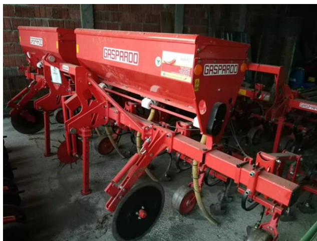
Slika 10. Kultivator Gaspardo HP 6