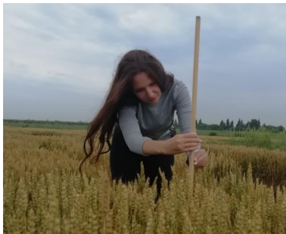
Slika 3. Mjerenje visine biljaka pomoću metra

Neposredno prije žetve, 03.07.2019., ručno su uzeti uzorci biljnog materijala s površine od jednog kvadratnog metra, a prije nego što su uzorci uzeti ručno je određen broj klasova po m^2 na način da se metalni kvadrat površine 0,25 m^2 postavio u središnjem dijelu parcele te se izbrojao broj klasova unutar kvadrata (postupak je ponovljen 4 puta za svaku parcelu). Uzorci za daljnje ispitivanje uzeti su uz pomoć istog metalnog kvadrata koji se koristio za određivanje broja klasova. Metalni kvadrat postavio se u središnji dio parcele te su odrezane biljke, uz pomoć škara, koje su se nalazile unutar površine kvadrata (Slika 4.). Postupak je ponovljen 4 puta za svaku parcelu kako bi se dobio uzorak za 1 m^2 ( 4 \times 0,25 m^2 ).