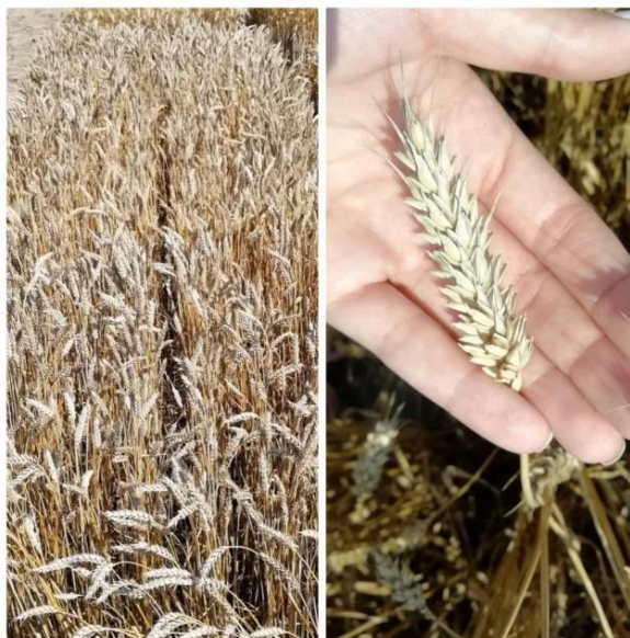
Slika 12. Sorta Viktorija

ozime pšenice u Republici Hrvatskoj i šire. Ima visoku pekarsku kakvoću (sadržaj vlažnog lijepka veći je od 35 %, a proteina od 15 %, te ima izuzetno visoke ekstenzogramske vrijednosti). Tolerantna je na osnovne bolesti pšenice, otporna je na sušu i niske temperature. Masa 1000 zrna kreće se od 42 do 44 grama. Optimalni rok sjetve je od 5. do 25. listopada u količini od 600 do 650 klijavih zrna/m 2 (Agrigenetics, 2019.).