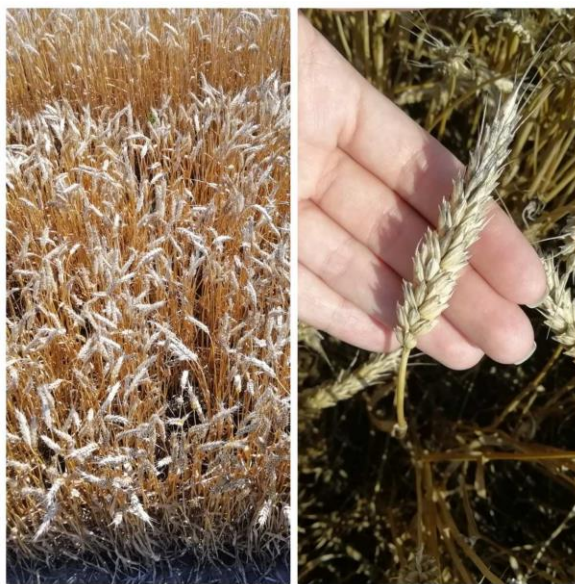
Slika 11. Sorta Srpanjka

Sorta Srpanjka je najranija sorta Poljoprivrednog instituta Osijek (Slika 11.). Bila je jedna od najraširenijih sorti ozime pšenice u proizvodnji u Republici Hrvatskoj, a i danas se često koristi u proizvodnji. Ozima je sorta vrlo niske stabljike, oko 64 cm, te je vrlo dobre tolerantnosti na polijeganje. Moderna je, stabilna, visokorodna i kvalitetna sorta. Genetski potencijal rodnosti veći je od 10 t/ha. Masa 1000 zrna u prosjeku se kreće oko 37 grama. Tolerantna je na niske temperature i brzo se oporavlja nakon zime. Tolerantna je i na rasprostranjene bolesti ozime pšenice. Priznata je još 1989. godine. Ima visok i stabilan urod zrna, koji se ostvaruje temeljem velikog broja rodni klasova po jedinici površine. Optimalni rok sjetve za ovu sortu kreće se od 10. do 25. listopada sa 650 do 700 klijavih zrna/m 2 (Poljoprivredni institut Osijek, 2019.).