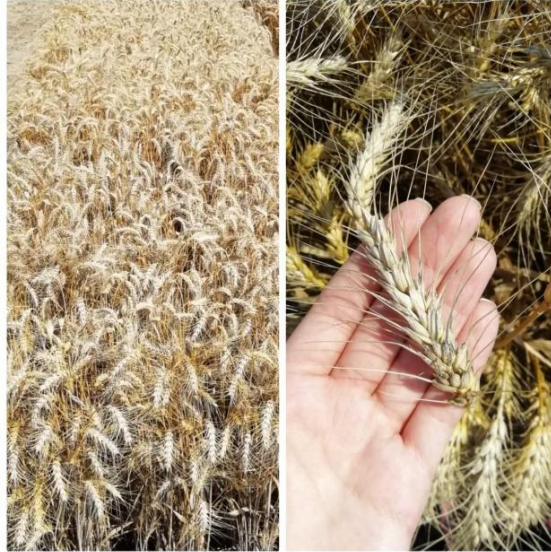
Slika 13. Sorta Maja

Sorta BC Anica (Slika 14.) spada u najbolje sorte u regiji. Visokorodna je, rana, krušna, ozima pšenica. Klas joj je bijele boje. Visina se kreće od 75 do 80 cm. Otporna je na polijeganje. Masa 1000 zrna kreće se od 40 do 45 g, a hektolitarska masa kreće se od 80 do 84 kg/hl. Optimalni rok sjetve je od 10. do 25. listopada, a preporučena norma sjetve za ovu sortu je od 650 do 700 kljavih zrna/m 2 . Ima visok sadržaj proteina (od 12,6 % do 14,2 %) te vlažnog lijepka (26 do 34,2 %) (BC institut Zagreb, 2019.).