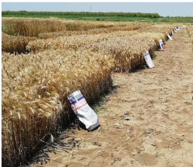
Slika 5. Uzorci svake parcele

Uzorci s oznakama svake sorte i svakog ponavljanja su potom spremljeni u papirnate vreće (Slika 5.) i prevezeni u Praktikum za specijalno ratarstvo na Fakultet agrobiotehničkih znanosti Osijek gdje su provedene daljnje analize. Žetva cijelih parcelica je obavljena 22. srpnja 2019., odnosno nakon uzimanja potrebnih uzoraka, pomoću Wintersteiger kombajna radnog zahvata 1,2 m koji je specijaliziran za rad na manjim pokusima. Podatci o prinosu i hektolitarskoj masi su dobiveni od navedenog kombajna na temelju vlage u trenutku žetve.