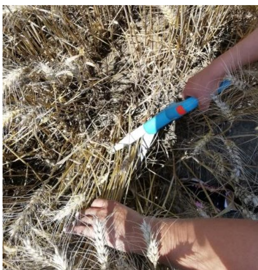
Slika 4. Uzimanje uzoraka

Neposredno prije žetve, 03.07.2019., ručno su uzeti uzorci biljnog materijala s površine od jednog kvadratnog metra, a prije nego što su uzorci uzeti ručno je određen broj klasova po m^2 na način da se metalni kvadrat površine 0,25 m^2 postavio u središnjem dijelu parcele te se izbrojao broj klasova unutar kvadrata (postupak je ponovljen 4 puta za svaku parcelu). Uzorci za daljnje ispitivanje uzeti su uz pomoć istog metalnog kvadrata koji se koristio za određivanje broja klasova. Metalni kvadrat postavio se u središnji dio parcele te su odrezane biljke, uz pomoć škara, koje su se nalazile unutar površine kvadrata (Slika 4.). Postupak je ponovljen 4 puta za svaku parcelu kako bi se dobio uzorak za 1 m^2 ( 4 \times 0,25 m^2 ).