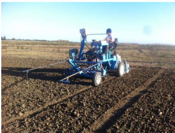
Slika 1. Sjetva pšenice s Wintersteiger sijačicom

Istraživanje je provedeno tijekom vegetacije pšenice 2018./2019. godine na površinama Fakulteta agrobiotehničkih znanosti Osijek (45.51'79" sjeverne geografske širine, 18.77'83" južne geografske širine). Sjetva je obavljena 31. listopada 2018. godine malom sijačicom Wintersteiger Tool Carrier 2700 specijaliziranom za sjetvu pokusa (Slika 1.).