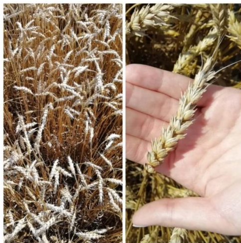
Slika 10. Sorta Tata Mata

Sorta Tata Mata je nova, rana sorta ozime pšenice (Slika 10.). Visokorodna je i dobre kakvoće. Genetski potencijal rodnoći veći je od 11 t/ha. Dobro je tolerantnosti na umjerenu sušu, ima izraženu otpornost na osipanje i proklijavanje zrna u klasu. Također ima vrlo dobru otpornost na polijeganje, niske temperature i najraširenije bolesti pšenice. Njena prosječna hektolitarska masa iznosi 83 kg/hl. Masa 1000 zrna iznosi oko 25 g, a visina stabljike oko 77 cm. Optimalni rok sjetve kreće se od 10. do 25. listopada s 500 do 650 klijavih zrna/m 2 (Poljoprivredni institut Osijek, 2019.).