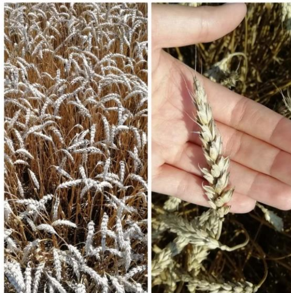
Slika 14. Sorta BC Anica

Sorta BC Anica (Slika 14.) spada u najbolje sorte u regiji. Visokorodna je, rana, krušna, ozima pšenica. Klas joj je bijele boje. Visina se kreće od 75 do 80 cm. Otporna je na polijeganje. Masa 1000 zrna kreće se od 40 do 45 g, a hektolitarska masa kreće se od 80 do 84 kg/hl. Optimalni rok sjetve je od 10. do 25. listopada, a preporučena norma sjetve za ovu sortu je od 650 do 700 kljavih zrna/m 2 . Ima visok sadržaj proteina (od 12,6 % do 14,2 %) te vlažnog lijepka (26 do 34,2 %) (BC institut Zagreb, 2019.).