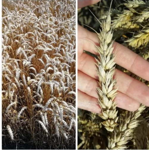
Slika 9. Sorta Tika Taka

Sorta Tata Mata je nova, rana sorta ozime pšenice (Slika 10.). Visokorodna je i dobre kakvoće. Genetski potencijal rodnoći veći je od 11 t/ha. Dobro je tolerantnosti na umjerenu sušu, ima izraženu otpornost na osipanje i proklijavanje zrna u klasu. Također ima vrlo dobru otpornost na polijeganje, niske temperature i najraširenije bolesti pšenice. Njena prosječna hektolitarska masa iznosi 83 kg/hl. Masa 1000 zrna iznosi oko 25 g, a visina stabljike oko 77 cm. Optimalni rok sjetve kreće se od 10. do 25. listopada s 500 do 650 klijavih zrna/m 2 (Poljoprivredni institut Osijek, 2019.).