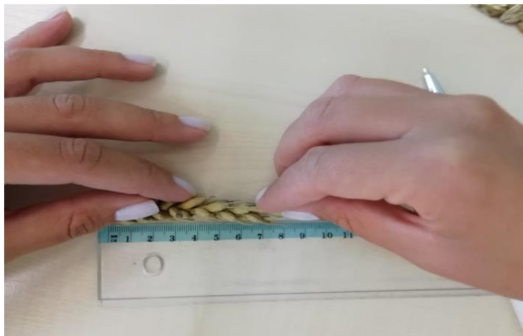
Slika 6. Mjerenje dužine klasa pomoću metra

Masa 1000 zrna određena je na način da se iz mase zrna ručno izdvojilo 1000 zdravih i neoštećenih sjemenki (Slika 7.), po principu slučajnog odabira, te su potom sjemenke izvagane pomoću analitičke vage KERN 440 35 A.