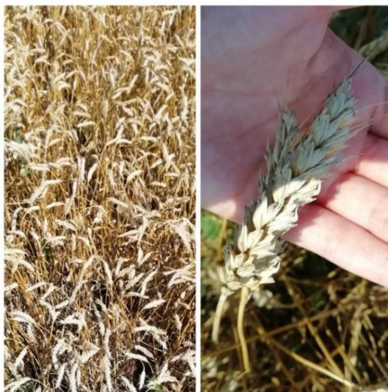
Slika 8. Sorta Kraljica

Sorta Kraljica je srednje rana, ozima sorta pšenice (Slika 8.). Najraširenija je u proizvodnji u Republici Hrvatskoj. Prosječna visina stabljike iznosi 75 cm. Visokorodna je sorta koja u velikoj mjeri objedinjuje rodnost i kakvoću (genetski potencijal rodnosti veći je od 11 t/ha). Njena hektolitarska masa kreće se oko 81 kg/hl. Masa 1000 zrna u prosjeku iznosi 40 grama. Vrlo je dobre tolerantnosti na niske temperature i najrasprostranjenije bolesti pšenice. Vrlo je dobre tolerantnosti na polijeganje. Njen optimalni rok sjetve kreće se od 10. do 25. listopada s 500-650 klijavih zrna/m 2 (Poljoprivredni institut Osijek, 2019.).