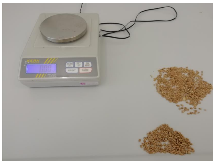
Slika 7. Određivanje mase 1000 zrna

Masa 1000 zrna određena je na način da se iz mase zrna ručno izdvojilo 1000 zdravih i neoštećenih sjemenki (Slika 7.), po principu slučajnog odabira, te su potom sjemenke izvagane pomoću analitičke vage KERN 440 35 A.