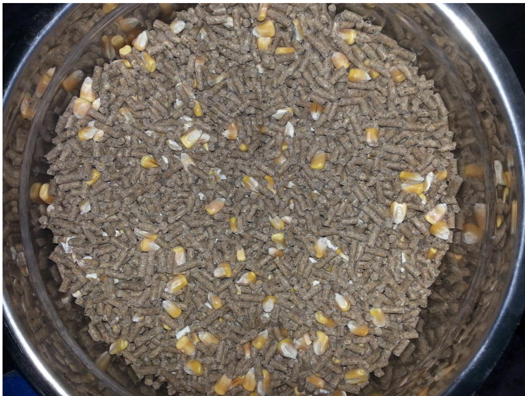
Slika 2. Obrok pokusne skupine (smjesa + 10 % cijelog zrna kukuruza); (Izvor: fotografije Svena Zečevića)

U laboratoriju Inspecto d.o.o. u Osijeku provedena je osnovna kemijska analiza krutog obroka (kontrolne smjese i smjese s dodatkom zrna kukuruza). Za analiziranje sadržaja hranjivih tvari u krutom dijelu obroka korištene su sljedeće referentne metode: za sirove proteine HRN ISO 5984-2: 2005., za sirova vlakna HRN ISO 6865: 2001., za sirovi pepeo HRN ISO 5984: 2004. (ISO 5984: 2002.), za sirovu mast HRN ISO 6492: 2001., a za vodu HRN ISO 6496: 2001. Sirovinski sastav obroka prikazan je u Tablici 1., a u Tablici 2. naveden je nutritivni i mineralni sastav obroka.