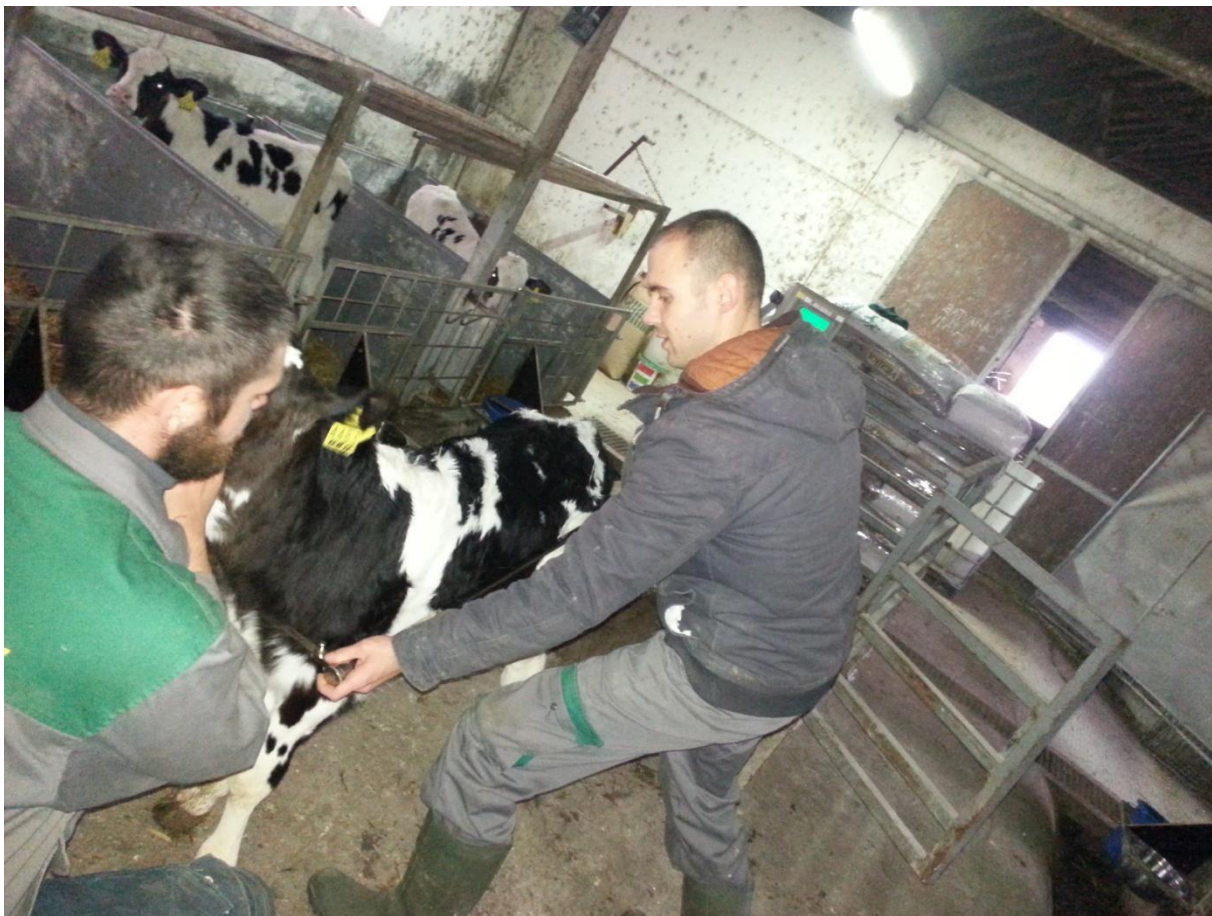
Slika 3. Uzimanje tjelesnih mjera