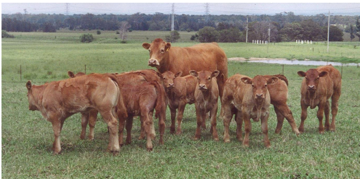
Slika 7: Krava s telićima

Pasmina je dobre otpornosti prema vremenskim utjecajima što uz boravak na otvorenom i na svježem zraku povoljno utječe na plodnost i dugovječnost te je radi toga dobra pasmina za uzgoj u sustavu krava-tele.