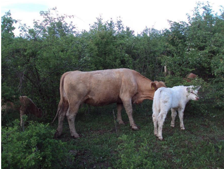
Slika 11: Krava s teletom

i 46 ženske). Starost teladi pri prodaji iznosi 5 do 7 mjeseci, ovisno o prirastu, a teški su od 180 do 220 kg. Ženska telad najčešće se prodaje za daljnju reprodukciju, dok muška telad se prodaje za tov i klanje, a rjeđe za pripust. Ukoliko se prodaju za klanje, kupci su Vlado Tangar iz Trogira i Dragan Ikić iz Zadra.