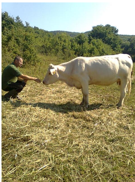
Slika 4: Charolais pasmina