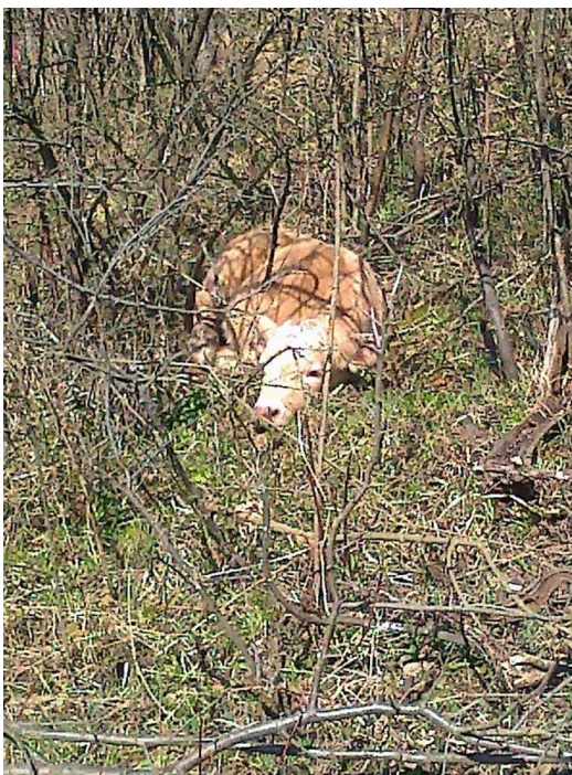
Slika 10: Skriveno tele nakon poroda

Krave tele zdravu i vitalnu telad koja već pola sata do sat, a u nekim slučajevima i ranije, nakon telenja ustaje, traži majčino vime i počinje sisati. Prilikom teljenja nije poželjna čovjekova pomoć zbog mogućnosti odbacivanja teleta od strane krave, no cjelokupan proces teljenja je potrebno nadzirati radi potencijalno potrebne intervencije. Krave se za telenje pripremaju dan prije na način da se odvaja od stada i traži mjesto za telenje. Nakon što se oteli skriva tele u gusto raslinje i izvodi ga u stado 3 do 5 dana nakon telenja.