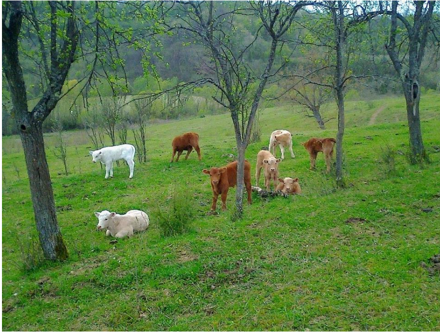
Slika 3: Telići