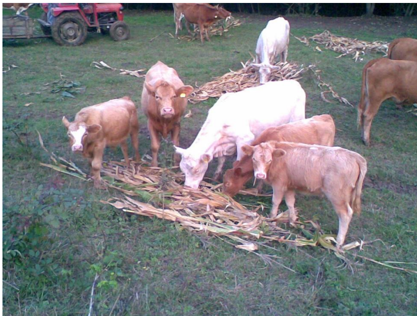
Slika 2: Mesne pasmine goveda

U našoj zemlji nema značajnijeg uzgoja odnosno sustava mesnog govedarstva. Glavni razlozi su u osobitosti našega podneblja, nedostataka trajnih travnjaka i raspoloživih prostora za ektenzivno govedarstvo te proizvodna nekonkurentnost mesnog goveda kombiniranom i mliječnim govedu (Caput, 1996.). Mesno govedarstvo je usko specijalizirano za proizvodnju mesa. Zajedničko svim mesnim pasminama je da se drže u pašnom sustavu, tj. u pregonim pašnjacima. Treba napomenuti da paša mora biti količinski obilna, bez obzira na kvalitetu iako je i kvaliteta pašne jako bitan čimbenik.