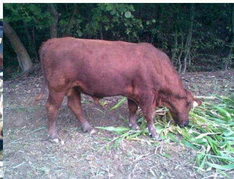
Slika 6: Bik pasmine crveni angus