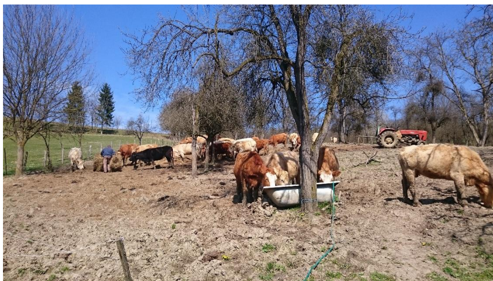
Slika 1. Ekstenzivan način uzgoja goveda

Svaki proces proizvodnje ima svoj tijek, pa tako se i ovaj sustav sastoji od nekoliko faza. Prva faza u sustavu krava-tele je telenje. U pravilu se krave moraju teliti same ili uz minimalni asistenciju čovjeka. Porodajna masa teladi je između 30 i 45 kg, ovisno o pasmini. Sljedeća faza je laktacija. Ona započinje telenjem, a završava odbićem teladi kada oni budu 6-7 mjeseci starosti. U ovom sustavu je sve izlučeno mlijeka namijenjeno teletu. Suhostaj je treća faza ove proizvodnje. U tome razdoblju je jako bitno da se krava oporavi od sisanja teleta i da do slijedećeg pripusta stekne dobru rasplodnu kondiciju. Posljednja faza ovoga sustava je pripust. U sustavu krava-tele uglavnom se koristi prirodni pripust.