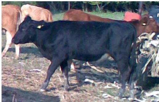
Slika 5: Krava pasmine crni angus