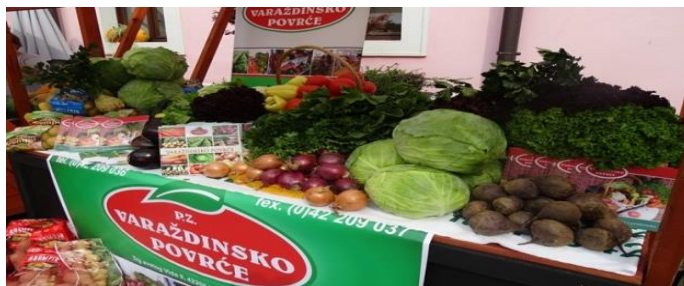
Slika 8. Poljoprivredna zadruga Varaždinsko povrće

Ukoliko poduzeće usvoji koncept društveno odgovornog poslovanja ima dobar izgled za dugoročno poslovanje. Potrošači će radije uvijek izabrati proizvod i usluge za koje vjeruju da se njihovi proizvođači brinu o poduzeću, interesima pojedinaca te cjelokupnoj društvenoj zajednici. Takvi proizvođači stječu određeni ugled među svojim potrošačima, a ugled ima veliku važnost u procesu odlučivanja potrošača u odabiru određenog proizvoda ili usluge. Primjer iz prakse: Poljoprivredna zadruga Varaždinsko povrće iz Varaždina proizvode povrće na svojoj njivi te putem partnera kao što se Gradska tržnica Varaždin, Caritas, Crveni križ i ostale humanitarne udruge pomažu svojoj lokalnoj zajednici. Najviše se donira zelje i krumpir što je karakteristično za to područje. Na taj način putem udruga i institucija pomažu brojnim pojedincima i obiteljima u potrebi na području Varaždinske županije, ali i u ostalim dijelovima Republike Hrvatske.