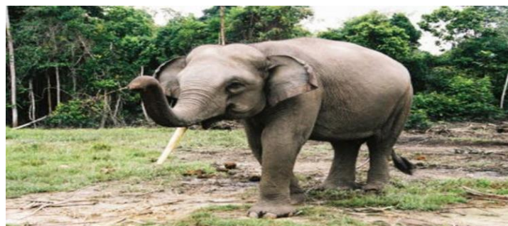
Slika 4. Sumatranski slon

Sumatranski slon podvrsta je azijskog slona. Broj preostalih jedinki procjenjuje se na oko 2500. Krivolovci ih i dalje ubijaju kako bi ih prodali na ilegalnom tržištu bjelokosti. Time se omjer muških i ženskih jedinki iskrivio. Nepotpun je za daljnje razmnožavanje i preživljavanje ove vrste (Kovač, 2015).