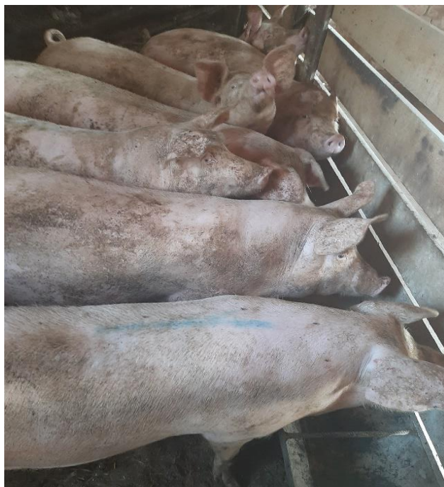
Slika 10. Tovljenici

Tov svinja provodi se u zatvorenim oborima s čvrstim podom, bez stelje. Čišćenje (izgnojavanje) obora je svakodnevno. Tovljenici su podijeljeni u skupine od 20 komada po oboru, oba spola. Hranidba tijekom cijelog razdoblja tova je obročna (dva puta na dan – ujutro i uveče) i provodi se ručno u valove (slika 8). Tovljenici se napajaju iz automatskih pojilica. (Margeta V. i sur. 2013.)