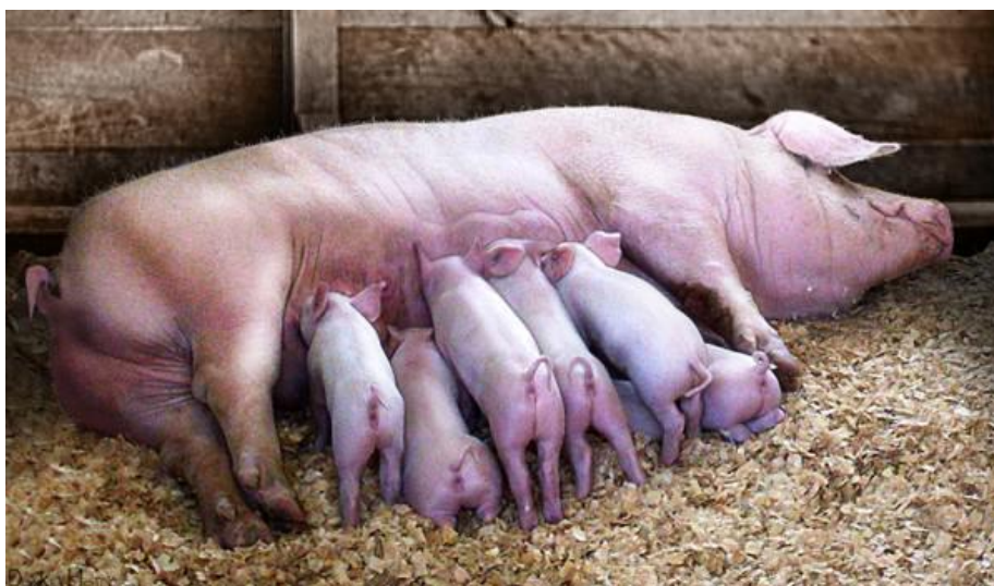
Slika 7. Dojna krmača s prascima

Dojno razdoblje nastupa nakon poroda i traje do odbića ili zalučenja, tj. do 35. dana starosti. Tijekom tog razdoblja prasadi sisa krmaču (slika 5) i u prvih dva tjedna to je jedina hrana koju prasadi dobija. Nakon prvog tjedna prasadi se dodaje kruta hrana (smjesa) kako ne bi previše iscrpili krmaču, te kako bi razvili i vlastiti imunitet. Također, prasadi je stalno dostupna svježa i pitka voda već od prvog dana nakon prasenja, jer krmačino mlijeko ne zadovoljava u potpunosti potrebe prasadi za tekućinom. Drugog dana nakon prasenja prasadi se daje preparat željeza, budući da je krmačino mlijeko siromašno ovim elementom. Nakon 14 dana većina muške prasadi se kastrira, a jedan dio (koji porijeklom i eksterijerom predstavlja potencijal za buduće rasplodnjake) ostavlja se nekastriran. (Kralik i sur. 2009.)