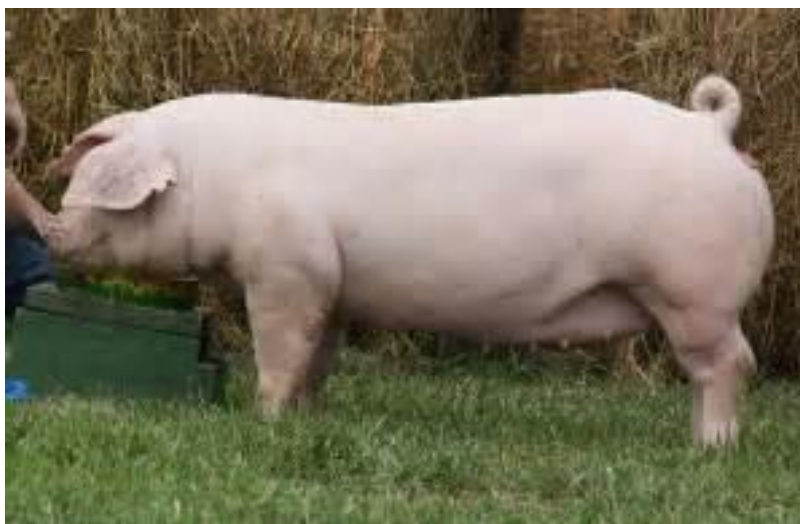
Slika 4. Nazimica landras pasmine

Landras je najbrojnija pasmina svinja ne samo u Hrvatskoj, nego i u svijetu, koja se zbog dobre plodnosti, visoke mesnatosti i dobre kakvoće mesa koristi u proizvodnji F1 križanki., a svinje ove pasmine često se koriste u kombinacijama križanja za proizvodnju suhomesnatih proizvoda. Svinje iz skupine landrasa razlikuju se od velikog jorkšira po spuštenim ili položenim ušima (slika 2), te uglavnom manjim tjelesnim masama u zreloj dobi.