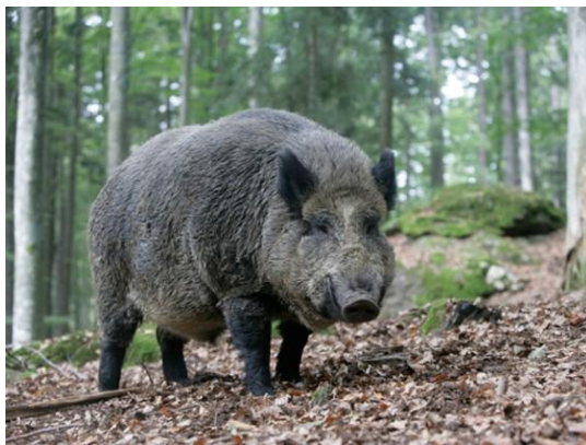
Slika 2. Sus scrofa

Domestifikacija svinja počela je u Euroaziji prije 8 do 10 tisuća godina. Kroz vremenski period sve do danas promjenile su se morfološke karakteristike svinja, njihov izgled, građa te otpornost na razne bolesti i nametnike ali i prilagodba na različite klimatske i pedeološke uvijete. Dva su izvorna oblika svinja iz kojih potječu današnje svinje a to su : „Sus vittatus“ azijska divlja svinja i „Sus scrofa ferus“ europska divlja svinja. Sve primitivne pasmine svinja u Europi potječu upravo od europske divlje svinje. Daljnjim oplemenjivanjem i genetskim unaprijeđivanjem tih svinja su nastale današnje komercijalne pasmine ili visoko uzgojne pasmine. Danas imamo dvije podijele svinja, prema stupnju oplemenjenosti i tipu proizvodnje za koju će se neka svinja koristiti. Tako prema stupnju oplemenjenosti imamo primitivne pasmine (mangulica, turopoljska svinja), prijelazne (berkšir, crna slavonska svinja) i plemenite (veliki jorkšir, landrasi, pietren, hemšir, durok).