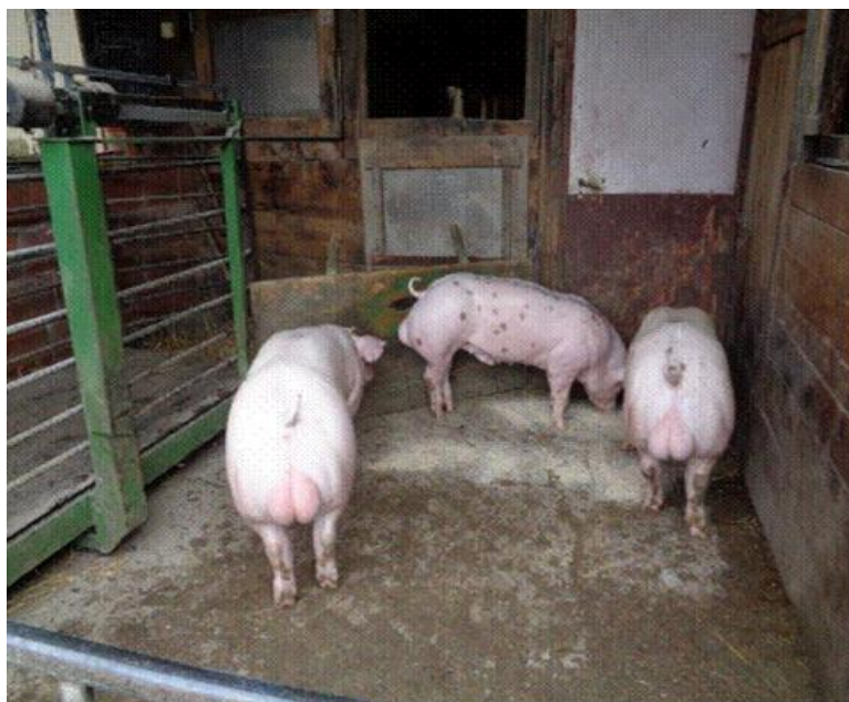
Slika 1. Obor za držanje rasplodnih nerasta

Proizvodnja svinja na gospodarstvu provodi se u objektima poluintenzivnog tipa, a unutar objekata se nalaze proizvodne cjeline tipične za zatvoreni ciklus svinjogojske proizvodnje (krmačarnik, nerastarnik – slika 1, prasilište, odgajalište, toviliste).