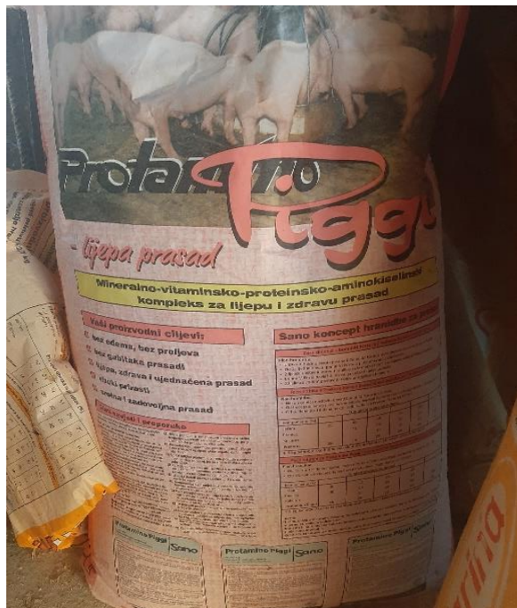
Slika 9. Dopunska krmna smjesa u hranidbi prasidi

Tijekom razdoblja uzgoja prasid dobija dopunsku krmnu smjesu starter Protamino Piggi, proizvođača Sano, koja sadrži 25% sirovih bjelančevina. Ova smjesa pokazala, prema rječima vlasnika OPG-a, kao najbolja što se tiče prirasta i zdravstvenog statusa prasidi.