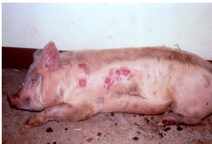
Slika 11. Svinja oboljela od vrbanca

Od vrbanca mogu oboljeti svinje svih pasmina, dobi i spola, iako su svinje mlađe od godinu dana prijemljivije za bolest.