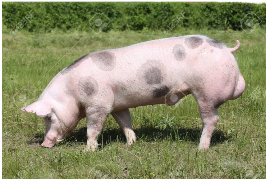
Slika 5. Nerast pasmine pietren

Pietren je belgijska pasmina nastala sredinom 20. stoljeća. Stvorena je sa ciljem dobre mesnatosti te su kod ove pasmine dobro razvijeni najkvalitetniji dijelovi trupa. Pietren je svinja srednje veličine, uglavnom pokrivena karakterističnim crnim pjegama nepravilnog oblika. Pored toga postoji svijetla varijacija bez pjega. Šunke i ramena su veoma dobro razvijeni, a u odnosu na ostale pasmine svinja ima kraće noge. Zahvaljujući tome djeluje zdepasto. Zanimljiva je karakteristika da pietren svinje nose uši uspravno i to je karakteristično za čistu pasminu.