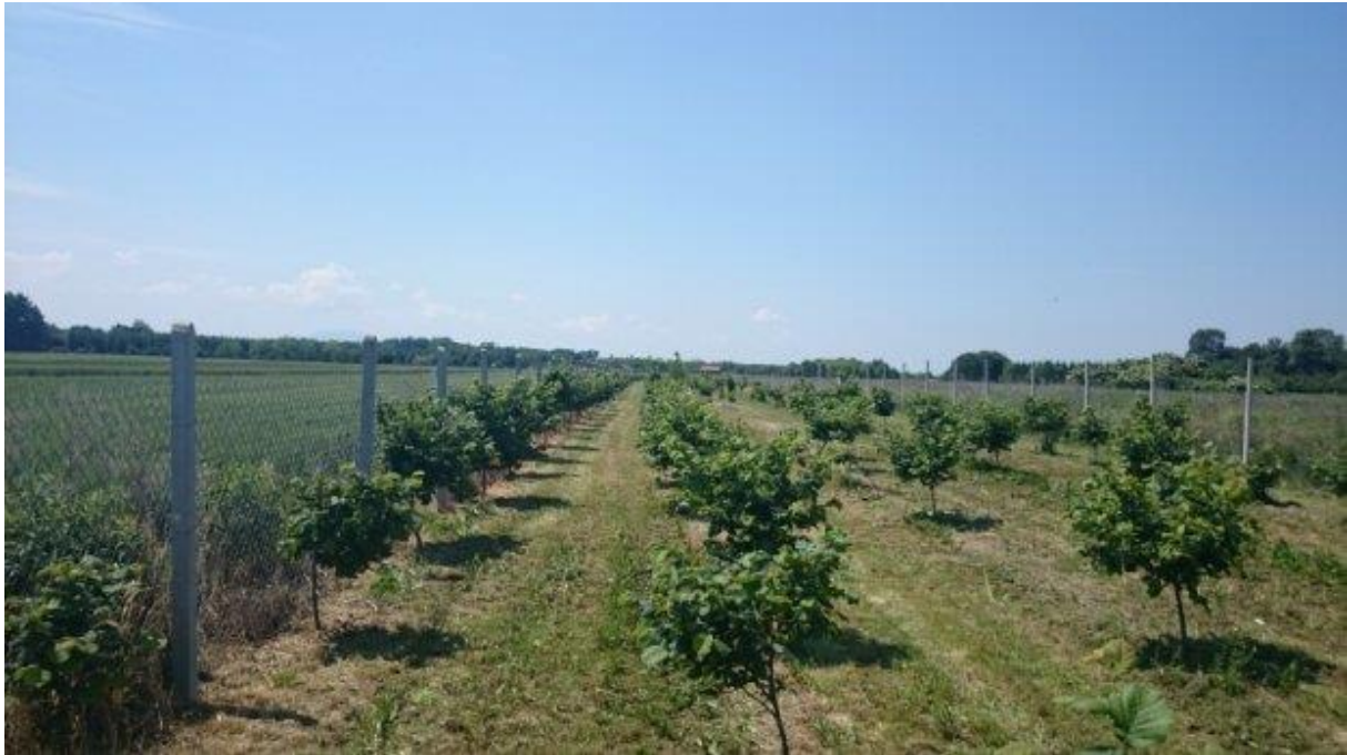
Slika 2. Nasad lješnjaka