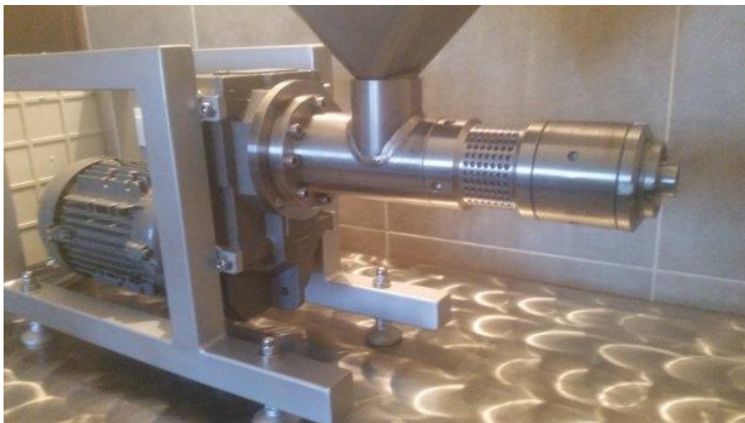
Slika 3. Preša za hladno prešanje

Ulje od lješnjaka se dobije prilikom hladnog prešanja lješnjaka, dok se ostatak koji ostane prilikom cijedenja melje i tako se dobije brašno koje je korisno u proizvodnji slastica. Poslije cijedenja, ulje mora proći kroz filtrat da bi dobili čisto i bez ostataka komadića ulje, koje se kasnije puni u bočice od 250 i 500 ml. Brašno poslije mljevenja pakiramo u za to predviđene vrećice, te nakon završetka proizvod je spreman za tržište.