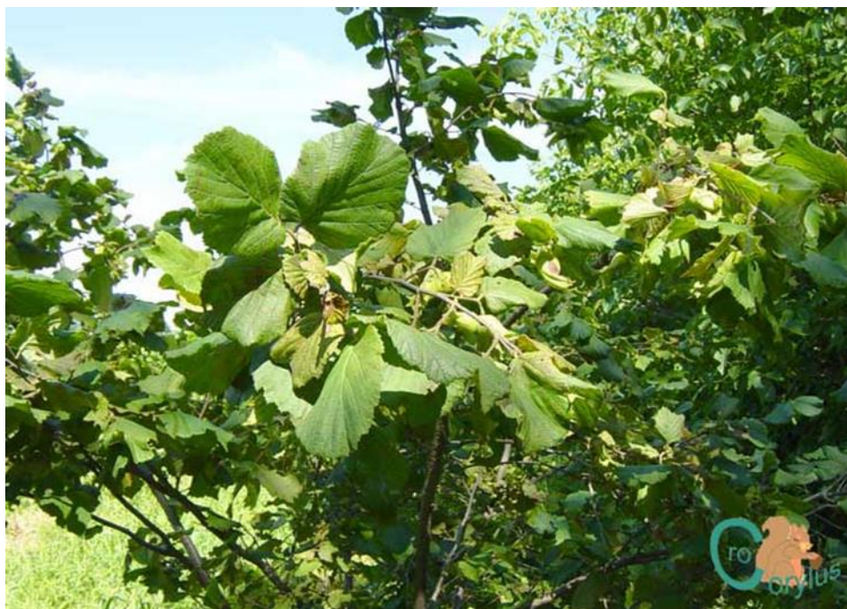
Slika 1. Stablo lješnjaka

Lijeska je sredozemna kultura i izrazito helifitna biljka. Za razliku od drugih vrsta koje cvatu u proljeće, ona cvate zimi i to od prosinca do ožujka. Korijen joj raste i razvija se vrlo plitko, u sloju od oko 30 cm. Rese su muški cvjetovi, a ženski su jedva vidljivi i imaju izrazito crvene tučkove. Divlje vrste lijeske sasvim dobro rastu u kontinentalnom dijelu zemlje, uglavnom na proplancima i rubovima šuma, na lošim i siromašnim tlima. Životni vijek lijeske je od 70 do 100 godina, a plod donosi od 50 do 70 godina. Počinje rađati u trećoj i četvrtoj godini, a puni rod dolazi sa 7 ili 8 godina. U punom rodu jedno stablo daje od 8 do 12 kg, a od ploda oko 50% otpada na ljusku. Ovisno o uzgojnom obliku, gustoći sadnje, vremenu starosti i drugih agrotehničkih čimbenika, prinosi se kreću od 2,2 do 3,6 t/ha (Manušev, 1988.).