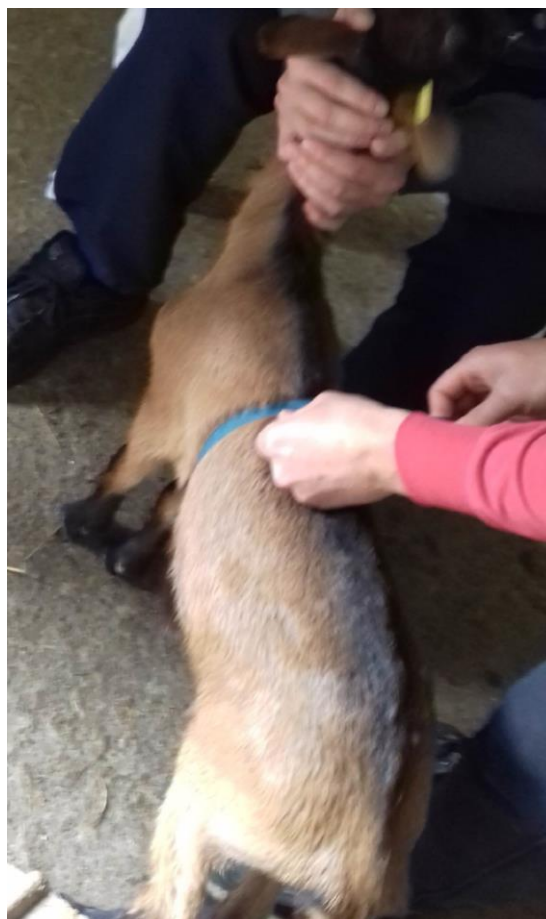
Slika 10. Mjerenje dužine trupa (gore), dubine prsa (dolje lijevo) i opseg prsa jaradi (dolje desno)