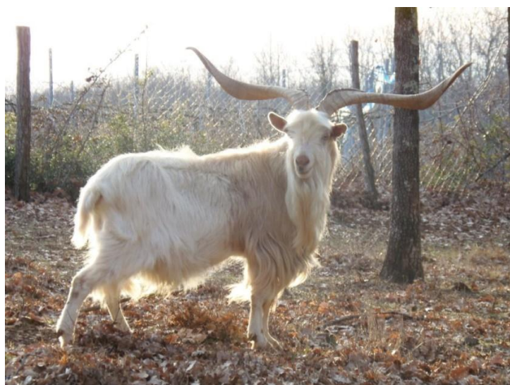
Slika 2. Hrvatske izvorne pasmine koza (od gore prema dolje: hrvatska bijela koza, hrvatska šarena koza, istarska koza)