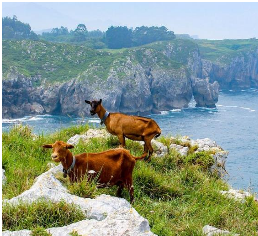
Slika 1. Koze na istočnoj obali Asturije, Španjolska

Europa se smatra kolijevkom suvremenog ovčarstva i kozarstva (Mioč, 2002.). Iako prve koze nisu podrijetlom iz Europe, ovdje su nastale najvažnije svjetske pasmine koza za proizvodnju mlijeka koje su se potom proširile po svijetu. U Europi se uzgaja više od 19 milijuna koza. Prema podacima iz FAOSTAT-a (2017.) najveću proizvodnju kozjeg mesa ostvaruju Grčka (39.466 t), Francuska (11.498 t) i Španjolska (10.713 t). Iste države ostvaruju i najveću proizvodnju kozjeg mlijeka – Francuska (590.000 t), Grčka (562.491 t), Španjolska (491.374 t) te Nizozemska (246.562 t).