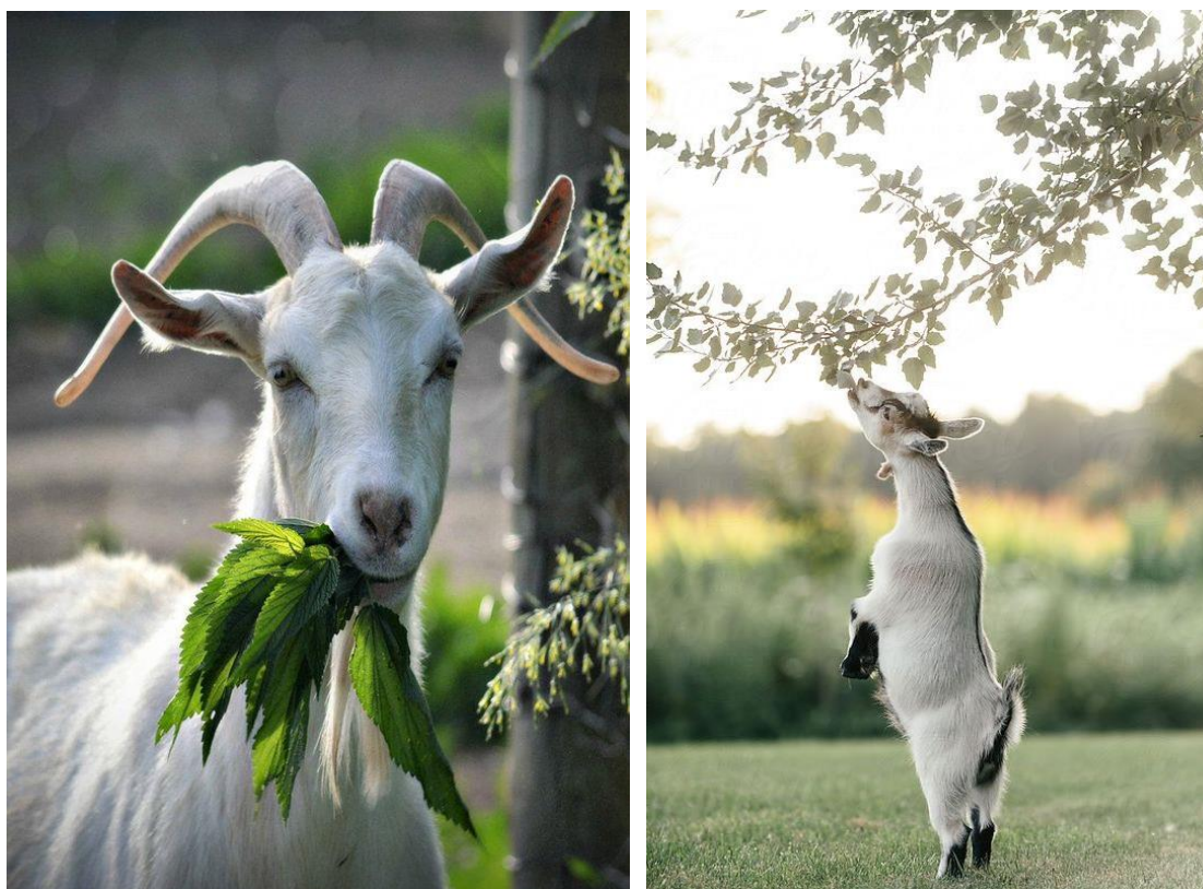
Slika 5. Jarac/jare brsti lišće

kolostrum. Jarad se prvih 45 dana hrani sisajući majčino mlijeko. Hranidba jaradi dijeli se na tri faze: prva faza – hranidba mlijekom, druga faza – hranidba mlijekom i krepkim krmivima (tzv. prijelazno razdoblje) i treća faza – hranidba krepkim krmivima (preživačka faza) (Mioč, 2002.). Hranidba jaradi mlijekom traje od jarenja do odbića koje obično traje pet do šest tjedana ( www.savjetodavna.hr ).