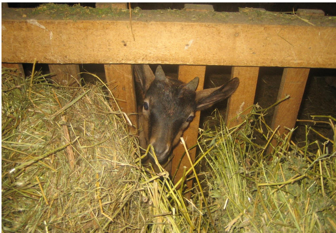
Slika 8. Jarad pasmine francuska alpina