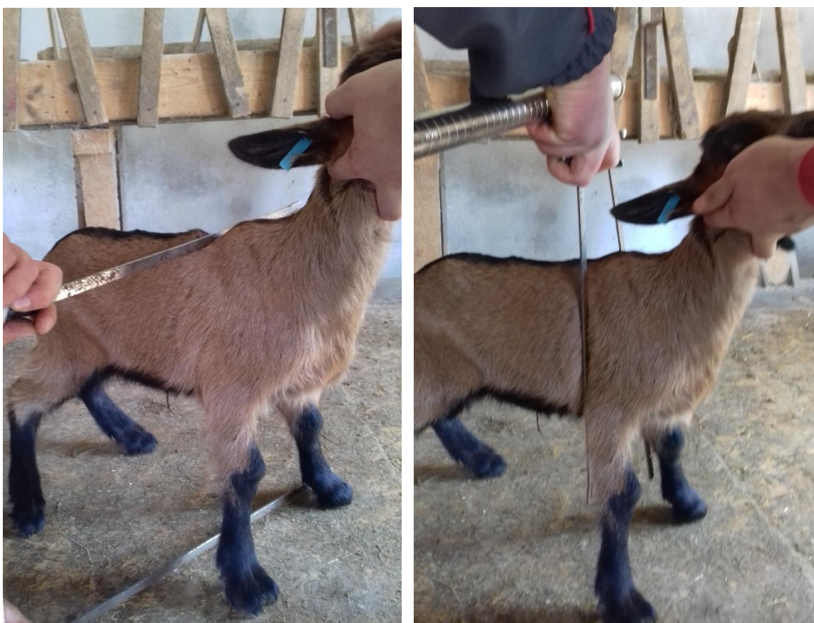
Slika 9. Mjerenje visine grebena (lijevo) i širine prsa jaradi (desno)