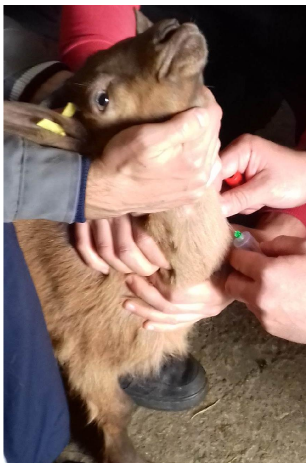
Slika 11. Uzorkovanje krvi jaradi

Uzimanje krvi jaradi provedeno je u dobi od 30, 50 i 80 dana, neposredno prije određivanja tjelesne mase i tjelesnih mjera. Krv je uzorkovana u vakutanere koji kao antikoagulans sadrže 3-kalij etilendiamintetraoctenu kiselinu ( K_3EDTA ). Analiza je provedena na 3 diff hematološkom analizatoru Sysmex Poch-100iV (Japan) u Laboratoriju za male preživaače i nepreživaače Fakulteta agrobiotehničkih znanosti u Osijeku. U punoj krvi utvrđeni su sljedeći hematološki pokazatelji: broj eritrocita (red blood cells – RBC) i leukocita (white blood cells – WBC), sadržaj hemoglobina (hemoglobin – HGB) i hematokrita (hematocrit – HCT), prosječan sadržaj hemoglobina u eritrocitima (the average amount of hemoglobin in red blood cells – MCH), prosječni volumen eritrocita (average volume of erythrocyte – MCV), prosječna koncentracija hemoglobina u eritrocitima (average concentration of hemoglobin in red blood cells – MCHC).