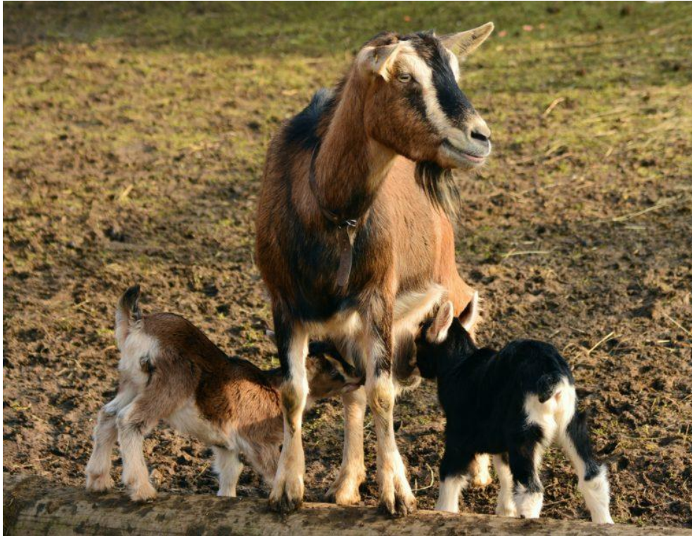
Slika 3. Odrastanje jaradi uz majku

proizvodnja se povećava na 13 t i do 2017. godine stagnira. Proizvodnja kozjeg mlijeka varira – 2016. je proizvedeno 102 t, odnosno 2017. godine 84 t mlijeka. Proizvodnja kozjeg mlijeka od 2013. do 2015. bila je oko 40 t (DZS).