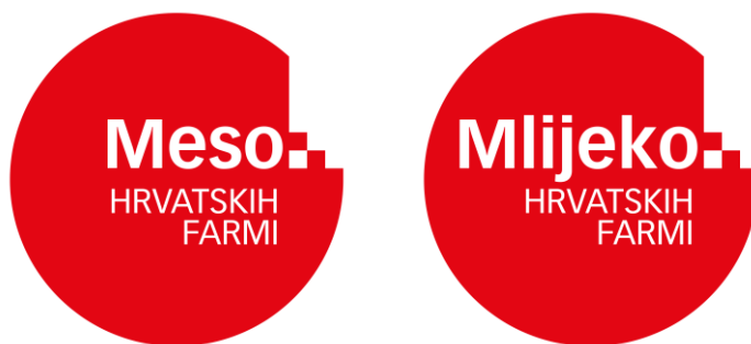
Slika 7. Oznake HPA za meso i mlijeko hrvatskih farmi

Pored znaka „Hrvatski eko proizvod“, Hrvatska poljoprivredna agencija omogućuje korištenje znakova „Meso hrvatskih farmi“ i „Mlijeko hrvatskih farmi“. Broj korisnika navedenih znakova u stalnom je porastu. Hrvatska poljoprivredna agencija nastoji učiniti znak prepoznatljivim među potrošačima kako bi proizvodi postigli dodatnu vrijednost. Uz to, cilj je informirati potrošače o podrijetlu i kvaliteti mlijeka i mesa proizvedenih na hrvatskim farmama, povećanje potrošnje označenih proizvoda te jačanje poljoprivredne proizvodnje ( www.hpa.hr ). Od sredine 2018. godine, znak „Meso hrvatskih farmi“ prošireno je na označavanje janjećeg i jarećeg mesa, a pravo na isti ostvaruju farme čije su životinje (evidentirane u Jedinstvenom registru domaćih životinja) rođene, tovljene i zakladne u Republici Hrvatskoj. Pravo na oznaku „Mlijeko hrvatskih farmi“ ostvaruju mlijeko i mliječni proizvodi proizvedeni na domaćim mliječnim farmama koji su prošli laboratorijsku kontrolu. Nakon ostvarivanja prava, provodi se mjesečno laboratorijsko ispitivanje na ukupan broj mikroorganizama. Na stranicama Agrokлуба navedeno je da znak „Mlijeko hrvatskih farmi“ donosi prednosti za proizvođače, prerađivače, ali i potrošače. Proizvođači dobivaju mogućnost povećanja proizvodnje, prerađivači paletu prepoznatljivih proizvoda, a potrošači kvalitetan, prepoznatljiv, domaći i cijenom prihvatljiv proizvod.