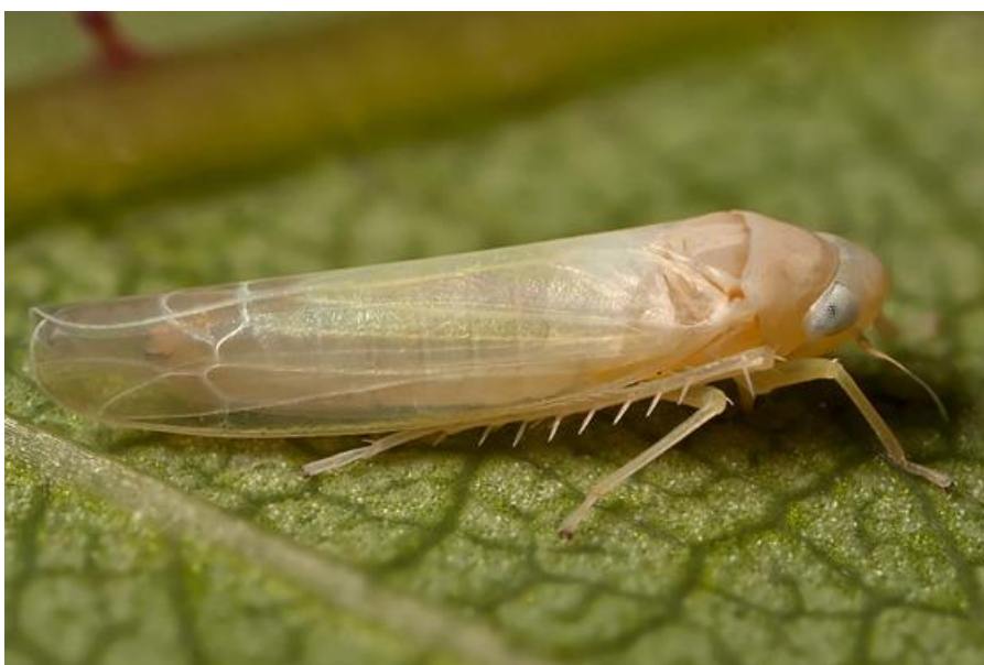
Slika 14. Edwardsiana rosae L. - ružin cvrčak

Pregledom žutih ploča prije tretmana nije utvrđena niti jedna jedinka američkog cvrčka. Prilikom pregleda žutih ploča najbrojnija vrsta cvrčka bila je Edwardsiana rosae (Slika 14.).