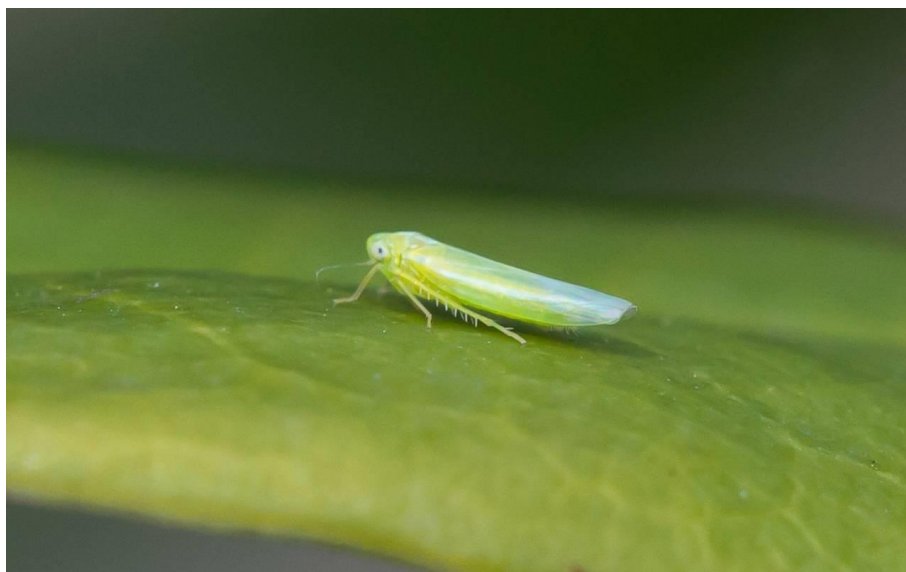
Slika 1. Lozin zeleni cvrčak