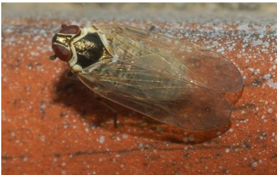
Slika 3. Cvrčak stolbura

Cvrčak stolbura prisutan je u cijeloj državi. Prenosi fitoplazmu Crnog drva vinove loze ( Bois noir – BN). Fitoplazma BN prisutna je na vinovoj lozi u Hrvatskoj. Cvrčak prenosi i fitoplazmu Stolbur koja napada rajčicu i zeljasto bilje. Cvrčak je smeđaste boje i živi na različitim korovima (Slika 3. ). Prezimljava kao ličinka u tlu, a početkom ljeta javljaju se odrasli oblici. Hrani se na lišću. Iz jaja koja odlažu na korijen korova, krajem ljeta, javljaju se ličinke koje onda pred zimu odlaze u tlo. Vinovu lozu napada još nekoliko vrsta cvrčaka kao npr.: Zygina rhamni Ferrari, Erythroneura vitis Harris i neke druge vrste (Maceljki i sur., 2006.).