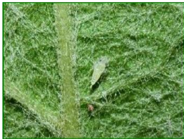
Slika 7. Ličinka drugog stadija