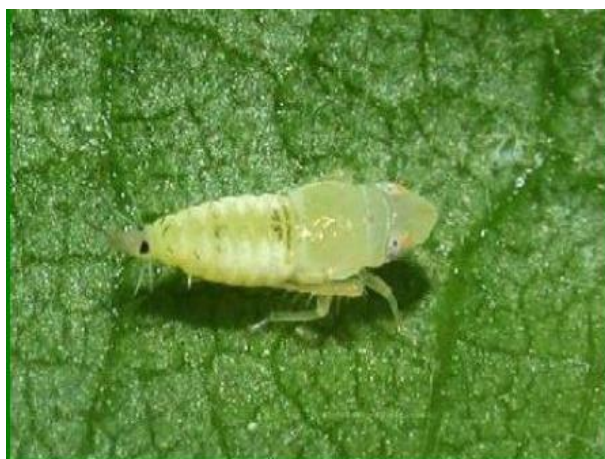
Slika 8. Ličinka trećeg stadija