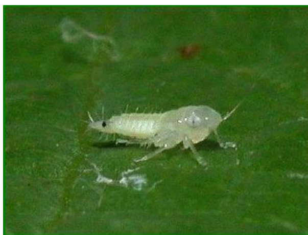
Slika 6. Ličinka prvog stadija

Prezimljuje kao jaje odloženo pod koru dvogodišnjeg drveta, a u iznimnim slučajevima i na jednogodišnjim izbojima (Bagnoli i Gargani, 2011). Američki cvrčak ima jednu generaciju godišnje. Jaja prezimljavaju u malim skupinama (2–4 jaja) ili u nizu od 10–12 jaja (Budinščak i sur., 2014.). Tijekom zime jaja su u dijapauzi. Ličinke izlaze iz jaja u razdoblju od jednog do tri mjeseca, a početak i trajanje izlaska ličinki varira ovisno o različitim agroekološkim uvjetima iako niske zimske temperature ne utječu na prekid dijapauze (Chuche i Thiery, 2014.). Trajanje razvoja ličinki također je ovisno o agroekološkim uvjetima. Prve ličinke iz jaja počinju izlaziti sredinom svibnja i naseljavaju mladice na donjem dijelu trsa. Ličinke se hrane sisajući hranjive tvari iz floema i zadržavaju se na donjoj strani lišća, a mogu se pronaći na lisnim peteljcima. Kukac se razvija kroz 5 stadija ličinki od kojih svaki traje 10 dana (Slika 6. do 11.)(oriovac.hr).