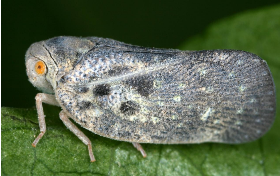
Slika 2. Medecí cvrčak