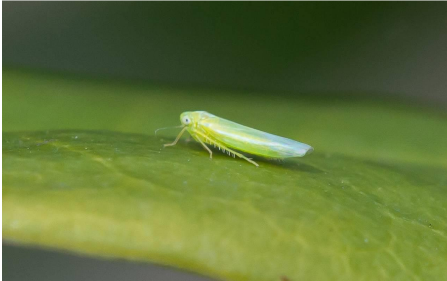
Slika 1. Lozin zeleni cvrčak