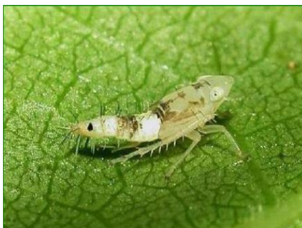
Slika 10. Ličinka petog stadija