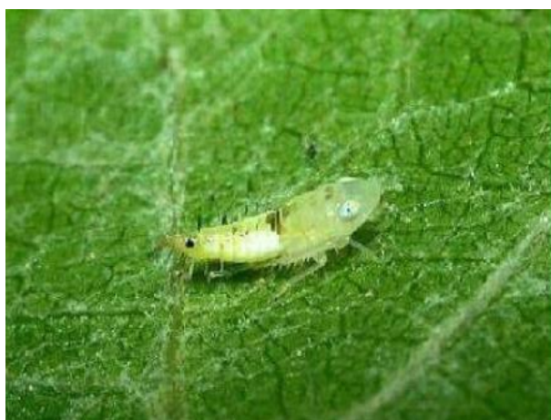
Slika 9. Ličinka četvrtog stadija