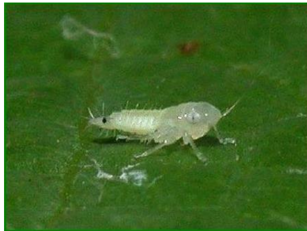
Slika 6. Ličinka prvog stadija

Prezimljuje kao jaje odloženo pod koru dvogodišnjeg drveta, a u iznimnim slučajevima i na jednogodišnjim izbojima (Bagnoli i Gargani, 2011). Američki cvrčak ima jednu generaciju godišnje. Jaja prezimljavaju u malim skupinama (2–4 jaja) ili u nizu od 10–12 jaja (Budinščak i sur., 2014.). Tijekom zime jaja su u dijapauzi. Ličinke izlaze iz jaja u razdoblju od jednog do tri mjeseca, a početak i trajanje izlaska ličinki varira ovisno o različitim agroekološkim uvjetima iako niske zimske temperature ne utječu na prekid dijapauze (Chuche i Thiery, 2014.). Trajanje razvoja ličinki također je ovisno o agroekološkim uvjetima. Prve ličinke iz jaja počinju izlaziti sredinom svibnja i naseljavaju mladice na donjem dijelu trsa. Ličinke se hrane sisajući hranjive tvari iz floema i zadržavaju se na donjoj strani lišća, a mogu se pronaći na lisnim peteljčkama. Kukac se razvija kroz 5 stadija ličinki od kojih svaki traje 10 dana (Slika 6. do 11.)(oriovac.hr).