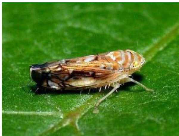
Slika 11. Odrasli oblik

Prva tri stadija ličinke su sivkasto bijele, a četvrti i peti stadij imaju šare na leđnoj strani i vidljive začetke krila (oriovac.hr).