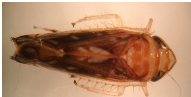
Slika 4. Mužjak S. titanus (Budinišćak i sur., 2008.)

Odrasli oblik je dužine 4,8–6,0 mm. Blijedožute je boje, na leđima je smeđe-šaren (Slika 4.). Glava je trokutastog oblika. Na tjemenu, mužjak ima 2 - 3 izražene tanke crne pruge, a ženka 3–4 pruge. Također se na tjemenu nalazi i jedna poprečna prugasta pjega crvenosmeđe boje. Na prsištu ima dvije poprečne crvenosmeđe pruge. Krila, kad su sklopljena, blago prelaze zadnji segment zatka. Krila su blijedožute do oker boje, a nervatura im je smeđa s bijelim i crnim pjegama (Budinišćak i sur., 2014.). Ličinke su žute boje, razvojem postaju sve više smeđe i mogu skakati (Maceljčki, 2002.). Ženka ima razvijenu leglicu (Slika 5.).