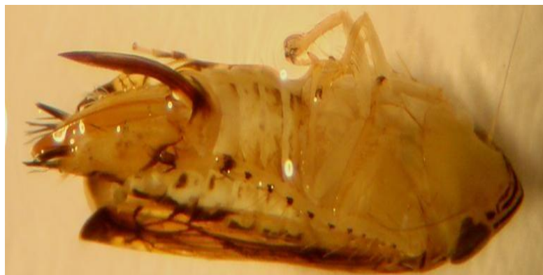
Slika 5. Ženka S. titanus (Budinišćak i sur., 2008.)