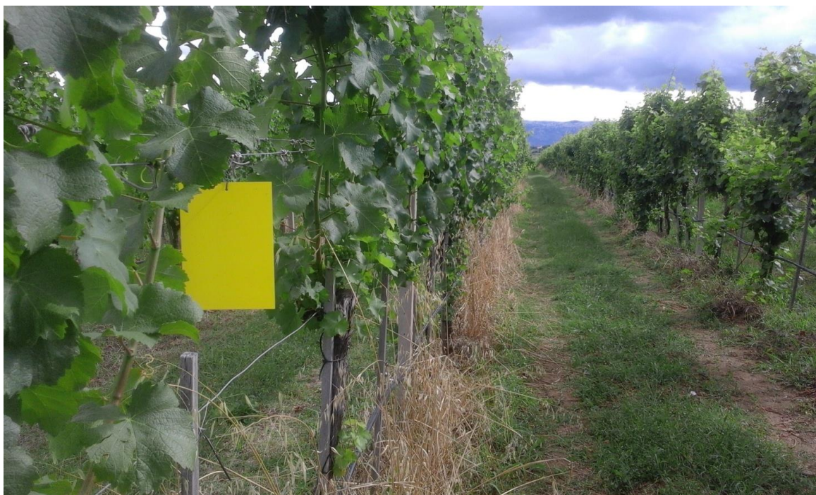
Slika 13. Žute ploče na poljoprivrednom dobru Sveučilišta u Zadru "Baštica"

Pokus je obavljen tako da su postavljene po tri žute ploče po svakoj varijanti unutar reda u vinogradu (Slika 13.). Žute ploče se postavljaju kao sredstvo praćenja štetnika u poljoprivredi kao što su različite muhe (trešnjina, maslinina,...), lisne uši i drugi štetnici. Žuta boja također privlači američkog cvrčka.