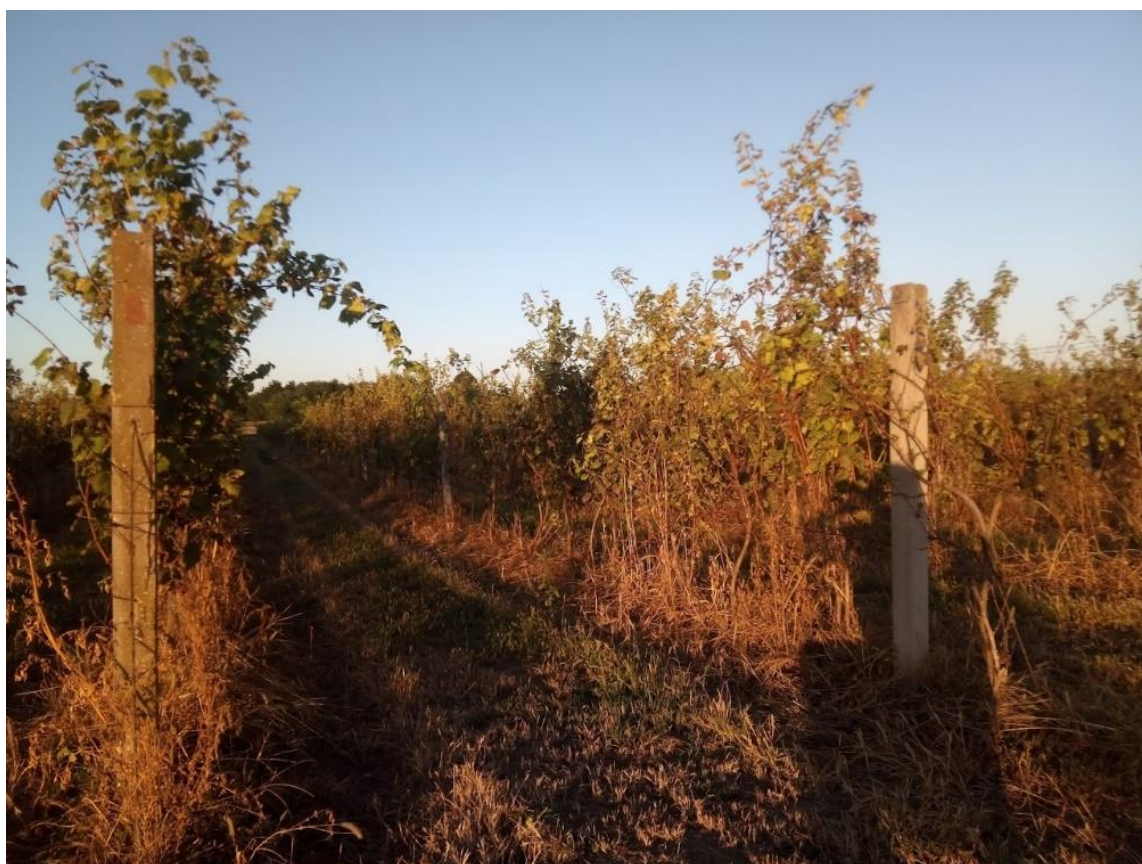
Slika 4. Vinograd u okolici Vukovara potpuno zaražen plamenjačom

Kada se ne bi provodila zaštita fungicidima, loza bi nakon nekoliko godina propala (Slika 4.) prvenstveno zbog plamenjače, ali i zbog drugih uzročnika bolesti. Danas se može postići zadovoljavajuća zaštita s 4 do 6 prskanja u prosječnim godinama. Preporučuje se da se u primjeni fungicida na osnovi bakra ne troši više od 3 kg djelatne tvari (bakra) na hektar tijekom jedne godine. To znači da se ne bi smjeli primjenjivati fungicidi na osnovi bakra više od 2- 3 puta tijekom jedne sezone. Sistemskim fungicidima treba dati prednost nad fungicidima s površinskim djelovanjem (Cvjetković, 2010.).