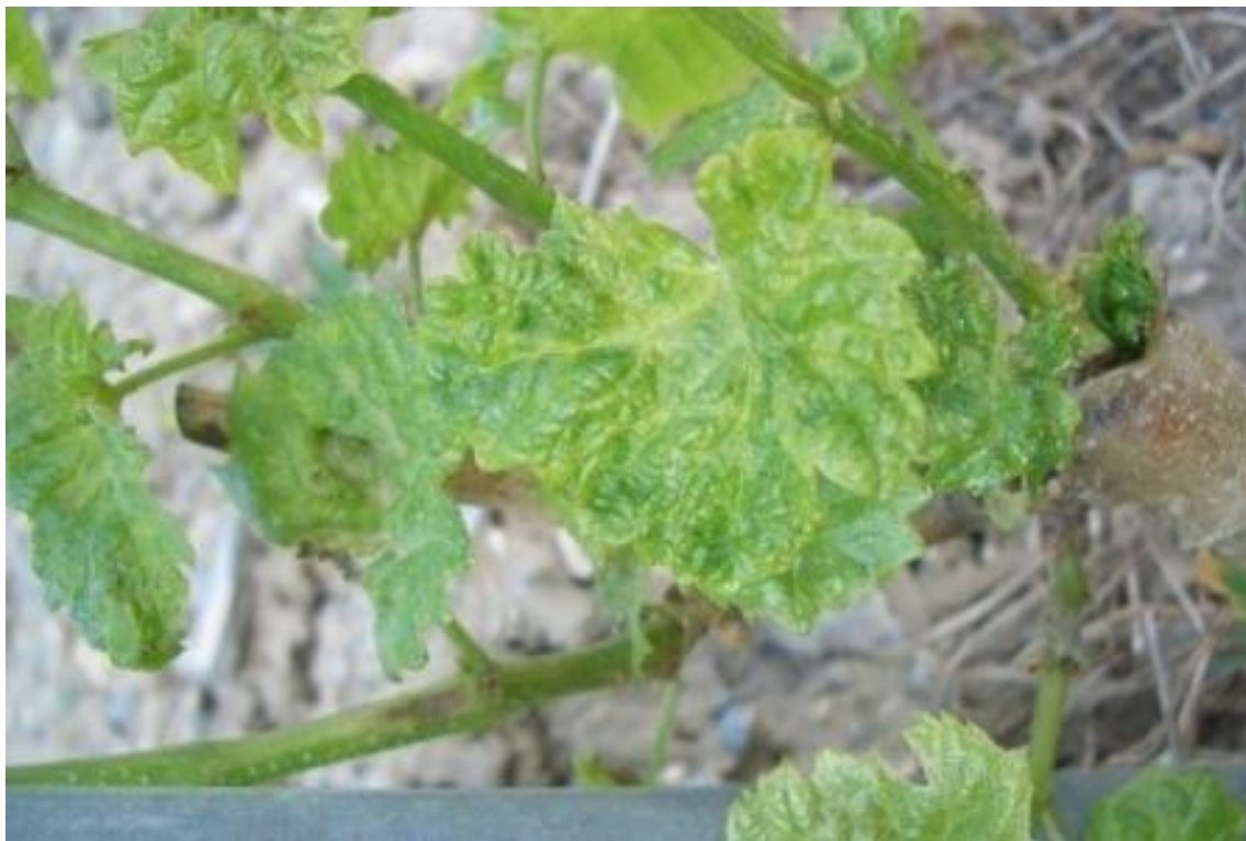
Slika 7. Akarinoza lista vinove loze

Zbog visokih šteta koje nanose štetnici, važno je njihovo poznavanje kako bismo mogli predvidjeti njihov napad, obavili potrebnu zaštitu i smanjili štetu. Najvažniji štetnici vinove loze su: štitaste uši, lozine grinje koje uzrokuju akarinozu (Slika 7.) i erinozu, crveni voćni pauk, grba korak, lozin trips, grozdovi moljci, američki cvrčak, vinove pipe, cigaraš, hrušt, filoksera ili trsov ušenac, cikade i dr.