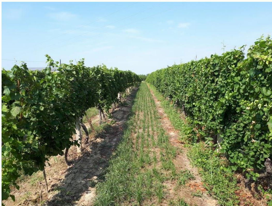
Slika 10. Zatravnjeni redovi vinograda na padini

Za obradu i zaštitu vinograda koristi se traktor Torpedo 7060 sa priključnim strojevima, a za prskanje nošena prskalica Agromehanika kapaciteta 450 litara. U vinogradu se redovito svake godine provode kemijske mjere suzbijanja uzročnika bolesti, štetnika i korova. Primjenjuje se kombinirani sustav održavanja tla, koji podrazumijeva suzbijanje korova oko trsova kemijskim mjerama, a između redova, na terenu s nagibom je zatravnjeno (Slika 10.) zbog sprječavanja erozije tla, dok se na ravnim površinama vrši međuredna obrada. Provodi se jesenska gnojidba gnojivom NPK 7-20-30, te proljetna gnojidba sa dušičnim gnojivima.