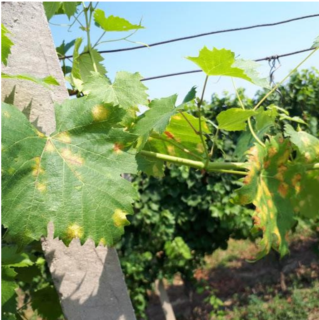
Slika 13. Simptomi plamenjače na lišću u vinogradima Srednje škole Ilok

Nakon velikih količina kiša koje su pale tijekom svibnja i lipnja stvoreni su povoljni uvjeti za razvoj plamenjače i pepelnice. Pojava pepelnice nije zabilježena, dok se plamenjača pojavila (Slika 13.) početkom kolovoza. Njena pojava je zabilježena u jednakoj mjeri na svim sortama, isključivo na vršnom lišću.