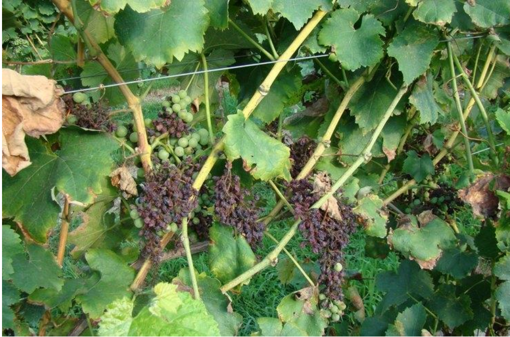
Slika 3. Plamenjača na grožđu

Na mladim listovima nastaju svijetlozelene do žute zone tzv. "uljane mrlje" koje se postupno povećavaju dosežući promjer 1 do 3 cm. Uskoro, nakon inkubacije, s donje strane lista na mjestu "uljanih mrlja" izbijaju bijele prevlake. To su brojni sporangiofori sa sporangijima. Zaražene zone postaju crvenkasto-smeđe. Na starim listovima nastaju žuta do crvenkasta polja omeđena žilama formirajući mozaik sa zelenim zdravim dijelovima lista. Bez obzira radi li se o primarnoj ili sekundarnoj zarazi, zaražene zone lista počinju smeđiti, a tkivo odumire i suši se. Na posmeđenom dijelu nema fruktifikacije jer je gljiva obligatni parazit i može egzistirati samo u živim stanicama. Micelij ulazi u zdravi dio lista, a pjega se postupno širi. Pjege se javljaju na nekoliko mjesta na listu, ali kada je zahvaćen veći dio plojke dolazi do sušenja i otpadanja lista. Do defolijacije može doći već krajem srpnja. Zaraženi listovi izvor su zaraze za ostale zelene organe ( www.pinova.hr ).