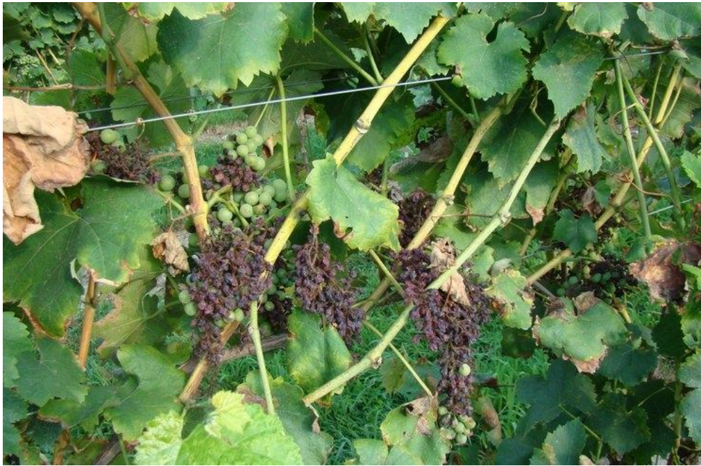
Slika 3. Plamenjača na grožđu

Na mladim listovima nastaju svijetlozelene do žute zone tzv. "uljane mrlje" koje se postupno povećavaju dosežući promjer 1 do 3 cm. Uskoro, nakon inkubacije, s donje strane lista na mjestu "uljanih mrlja" izbijaju bijele prevlake. To su brojni sporangiofori sa sporangijima. Zaražene zone postaju crvenkasto-smeđe. Na starim listovima nastaju žuta do crvenkasta polja omeđena žilama formirajući mozaik sa zelenim zdravim dijelovima lista. Bez obzira radi li se o primarnoj ili sekundarnoj zarazi, zaražene zone lista počinju smeđiti, a tkivo odumire i suši se. Na posmeđenom dijelu nema fruktifikacije jer je gljiva obligatni parazit i može egzistirati samo u živim stanicama. Micelij ulazi u zdravi dio lista, a pjega se postupno širi. Pjege se javljaju na nekoliko mjesta na listu, ali kada je zahvaćen veći dio plojke dolazi do sušenja i otpadanja lista. Do defolijacije može doći već krajem srpnja. Zaraženi listovi izvor su zaraze za ostale zelene organe ( www.pinova.hr ).