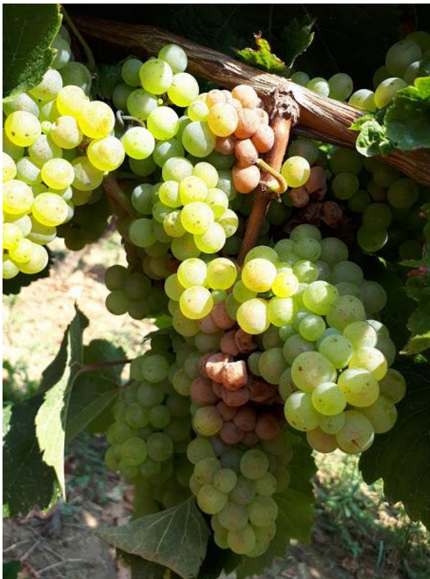
Slika 14. Siva plijesan na grozdu zabilježena u vinogradu Srednje škole Ilok

Krajem kolovoza na graševini i rajnskom rizlingu primijećena je pojava sive plijesni. Siva plijesan pojavila se samo na nekoliko trsova, i to na onima kod kojih je ostao relativno gust sklop lišća i grožđa te su se pojavili povoljni uvjeti za razvoj sive plijesni (Slika 14.).