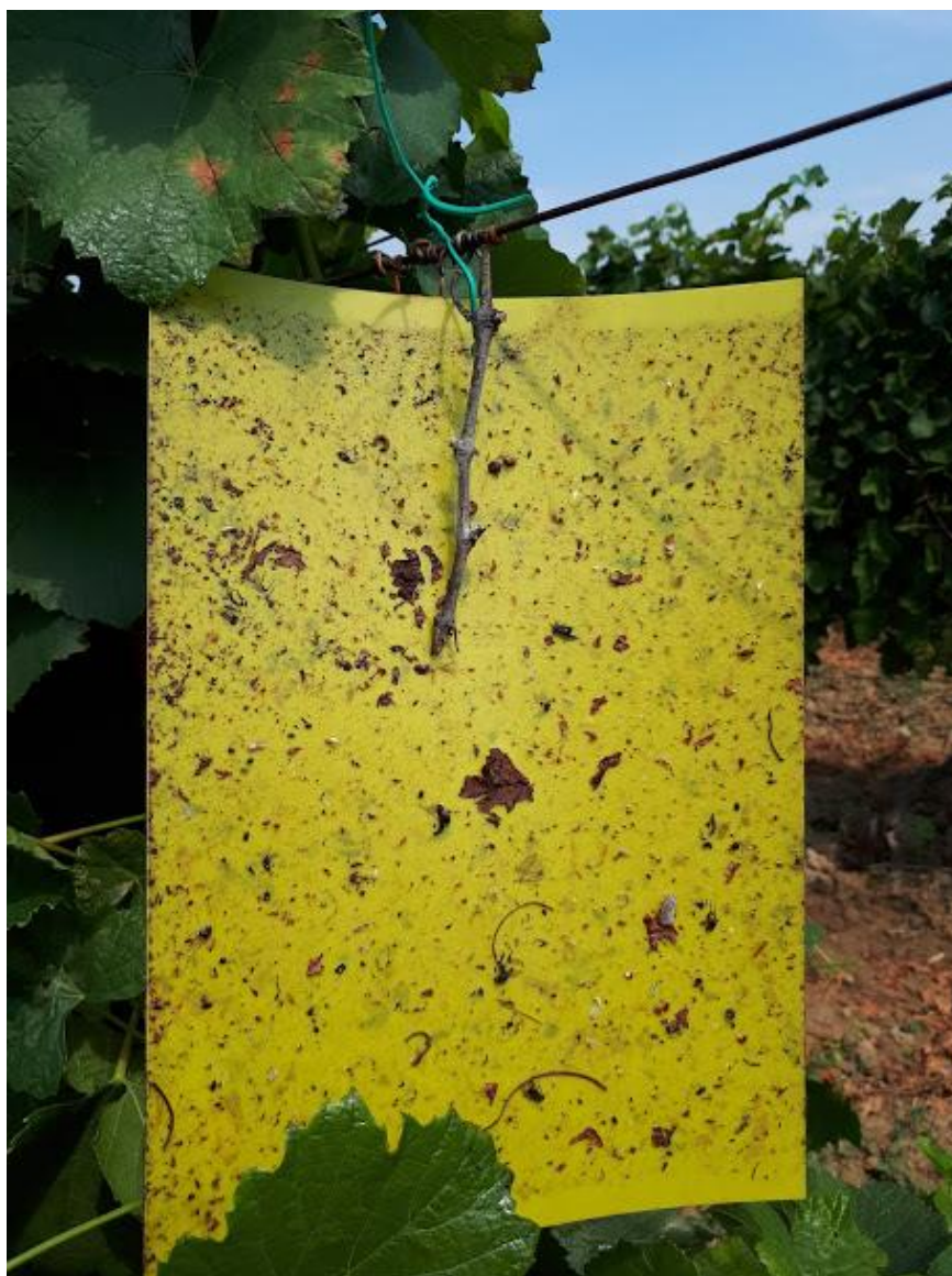
Slika 6. Praćenje pojave američkog cvrčka u vinogradima Srednje škole Ilok

Program suzbijanja američkog cvrčka u vinogradima se provodi na ličinkama i odraslim oblicima u najmanje dva, a preporučljiva su tri tretiranja: – prvo tretiranje provodi se nakon cvatnje u prvoj polovici lipnja do trećeg razvojnog stadija ličinke, – drugo tretiranje provodi se početkom srpnja, tj. dva do tri tjedna nakon prvog tretiranja, – treće tretiranje provodi se krajem srpnja ili početkom kolovoza, ako se tijekom srpnja ulovi tjedno četiri i više odraslih oblika američkog cvrčka po jednoj žutoj ljepljivoj ploči ( https://www.hcphs.hr/files/zlatna-zutica-vinove-loze_2014.pdf ).