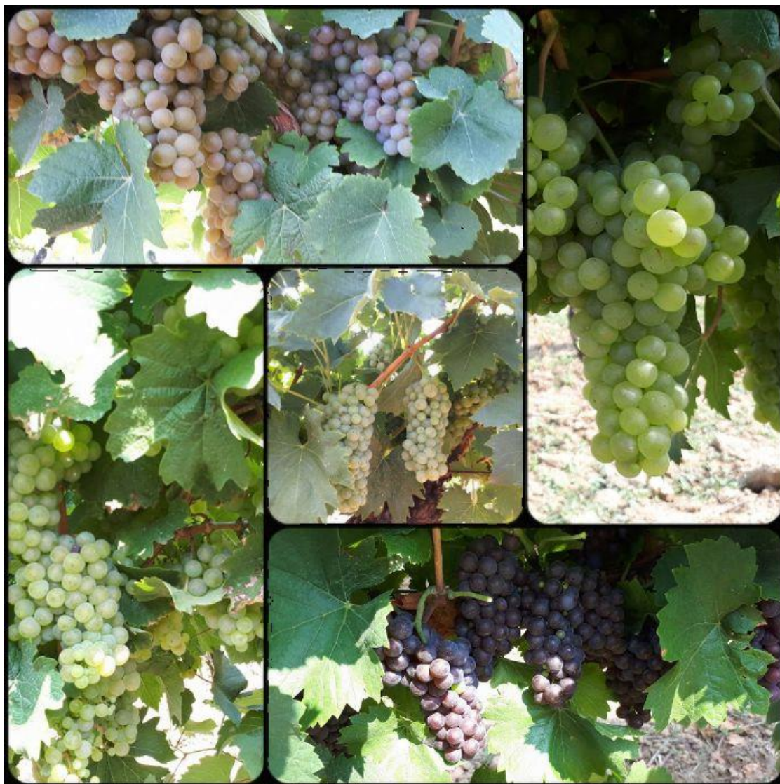
Slika 15. Zdravstveno stanje grožđa u vinogradima Srednje škole Ilok

Pojačana zaštita vinograda u 2019. godini, pokazala se izuzetno uspješna jer je stanje grožđa više nego zadovoljavajuće (Slika 15.), kao i ukupan prinos.