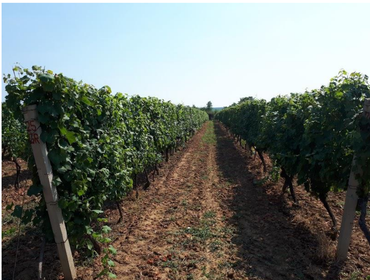
Slika 12. Vinograd Srednje škole Ilok nakon zalamanja zaperaka i vršikanja

Krajem lipnja obavljeno je prvo zalamanje zaperaka i vršikanje (Slika 12.), drugo je obavljeno sredinom srpnja, a posljednje početkom kolovoza. Tim ampelotehničkim zahvatima omogućeno je bolje provjetravanje, koje za cilj ima smanjenje vlage na trsu, a samim tim i smanjenje pojave bolesti.