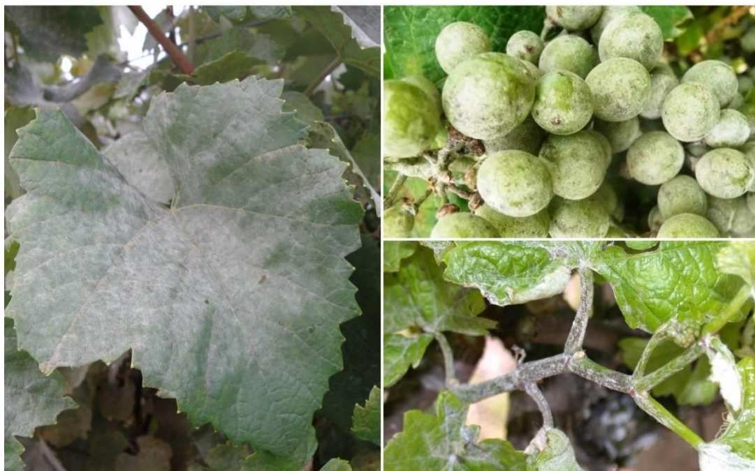
Slika 2. Simptomi pepelnice

Mladice mogu biti napadnute od momenta izlaženja iz pupa pa sve dok ne odrvene. Prije zriobe drva mogu se primijetiti na mladicama slabo izražene zrakaste mrlje. U početku su te mrlje pepeljaste, a s vremenom postaju plavkaste te su lakše uočljive na zelenim mladicama. Micelij koji je pepeljast ubrzo postaje taman, tkivo odumire, a na rozgvi ostaju mjesta čokoladne boje.