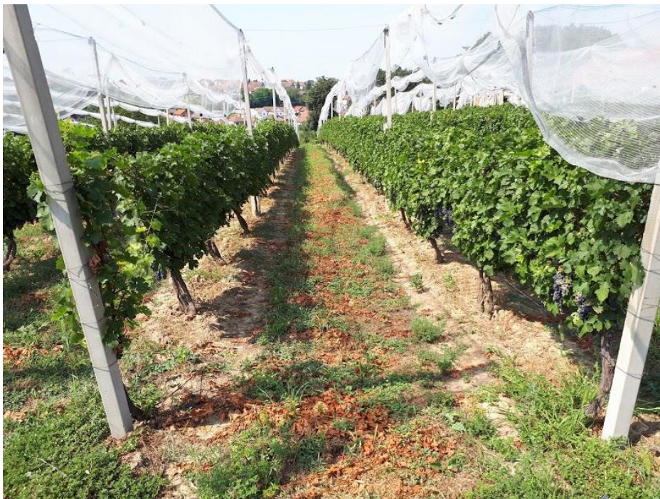
Slika 9. Klonski vinograd Srednje škole Ilok

Vinogradi Srednje škole Ilok zauzimaju površinu od 4,26 ha na kojoj je posađeno 12750 trsova. najzastupljenija je sorta graševina sa 4100 trsova, a slijede traminac sa 3500, rajnski rizling sa 2130, cabernet sauvignon sa 670, pinot bijeli 460, chardonnay 330 i pinot sivi 170 trsova. U klonskom vinogradu (Slika 9.) zasađeno je mnogo različitih sorata, od svake po 50-ak trsova. Vinogradi se, kao i sama škola nalaze na izdvojenom lokalitetu, brdašcu Tehnikum, čija nadmorska visina iznosi 135 m.