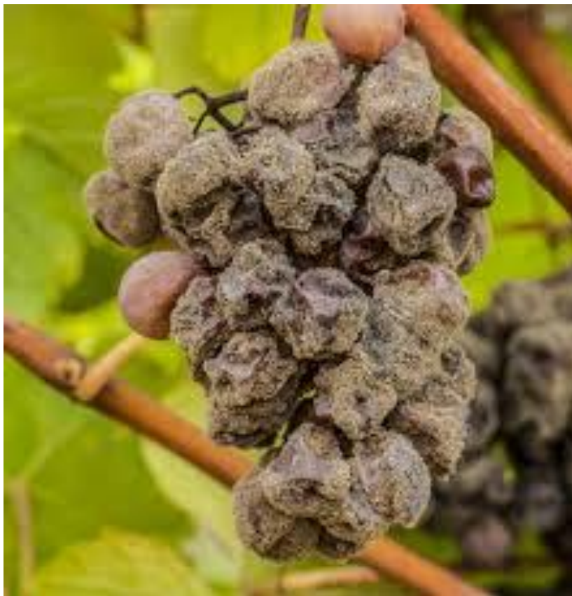
Slika 5. Grozd potpuno zahvaćen sivom plijesni

B. cinerea na bobama može izazvati dva tipa simptoma. U pojedinim slučajevima napada grozdove rano, dok su još bobe zelene kada dolazi do propadanja boba, peteljkovine ili čak pojedinog dijela grozda. Propadanje zelenih boba javlja se povremeno i samo u nekim vinogorjima. Drugi tip je češći. U tom slučaju dolazi do zaraze boba pred zriobu. Na grozdovima, krajem lipnja ili početkom srpnja, pojedine bobe i peteljkovina poprimaju smeđu boju, a na njima se javlja paučinasta, siva prevlaka (Slika 5.). Obično su napadnute bobe iz unutrašnjosti grozda pa zaraza prelazi na susjedne bobe i peteljčice. Najznačajniji i najuočljiviji simptomi pojavljuju se na grozdovima pred zriobu ( www.pinova.hr ).