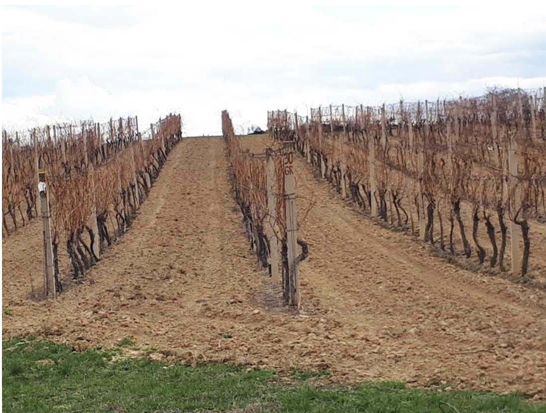
Slika 11. Vinograd Srednje škole Ilok prije rezidbe

Tijekom mjeseca siječnja i veljače u vinogradima Srednje škole Ilok obavljena je rezidba vinove loze (Slika 11.). Rezidbom su jednogodišnje rozgve prikraćene na 10 – 12 pupova, a formiran je uzgojni oblik dvostruki ili jednostruki Guyot. Nakon rezidbe izvršen je popravak armature te je zategnuta žica.