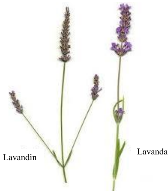
Slika 3. Razlika između lavandina i lavande

Eterično ulje lavandina ima drugačije djelovanje od onoga prave lavande i bogatije je kamforom ( https://www.svijet-biljaka.hr/index.php/hr/sadnice/lavandin ). Lavandin je križanac prave i širokoliste lavande (slika 3.). Razlog zašto se sadi lavandin je zbog veće iskoristivosti biljke. Naime prava lavanda daje male količine eteričnog ulja, za razliku od lavandina koji daje tri puta više. Osim prinosa, lavanda i lavandin razlikuju se u izgledu, ali i u djelovanju, jer imaju različit kemijski sastav ( https://myoffdays.com/razlika-između-lavande-i-lavandina/ ).