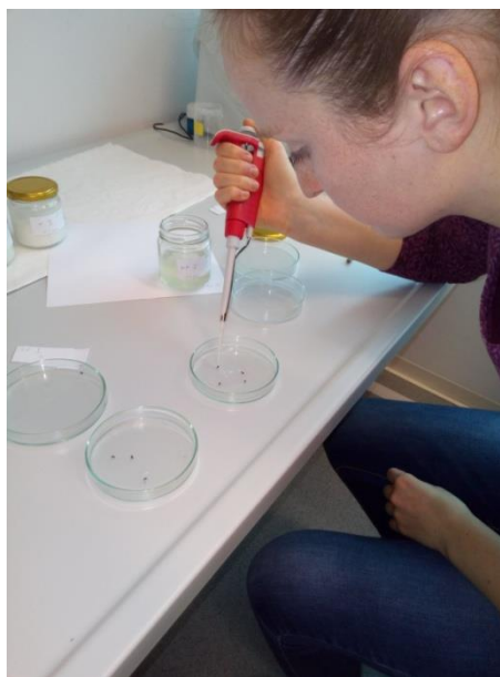
Slika 12. Apliciranje formulacije Kartell mikropipetom direktno na prsište T.castaneum