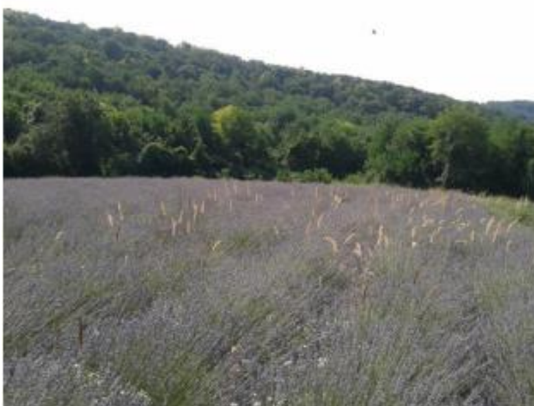
Slika 4. Polje lavandina

mjeseca srpnja, a drugi put tijekom mjeseca rujna ( http://www.lavanda-lavandin.com/Karakteristike_lavande_i_lavandina.htm ).