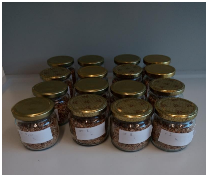
Slika 13. Postavljen test sa zrnom pšenice