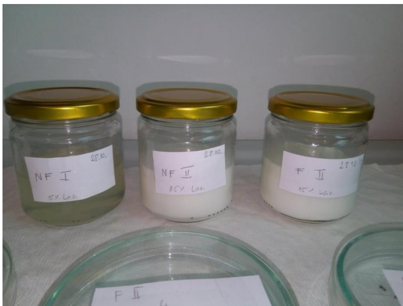
Slika 10. Pripremljene formulacije

Pripremljene formulacije NF i F (slika 10.) čuvane su u staklenkama obojanog stakla i držane u tami na sobnoj temperaturi do trenutka primjene.