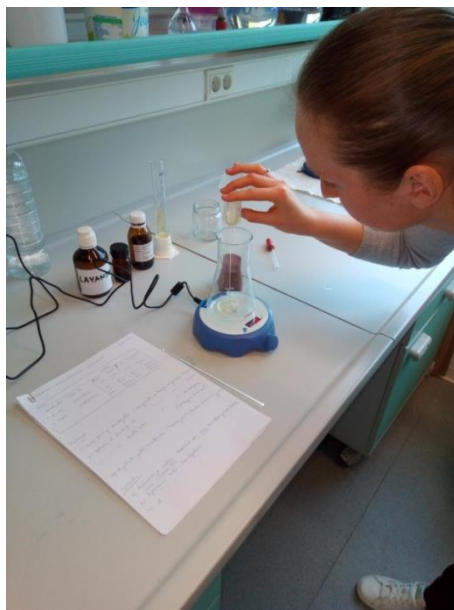
Slika 6. Dodavanje emulgatora Tween ® 80

Nanoemulzija (oznake NF) je pripremljena u Laboratoriju za zaštitu uskladištenih proizvoda, Fakulteta agrobiotehničkih znanosti Osijek. Korišten je emulgator polisorbit Tween ® 80 dodan kap po kap u staklenu posudu i miješan magnetskom miješalicom u trajanju od 10 min (slika 6.). Nakon toga polako je dodana aktivna komponenta, eterično ulje lavandina (slika 7.) te je mješavina (emulgatora i eteričnog ulja) dalje homogenizirana magnetskim miješanjem (slika 8.). Nakon 20 min dodana je destilirana voda te je sve zajedno izmiješano do potpune homogenizacije. Tako pripremljena emulzija je dalje homogenizirana uz pomoć ultrazvučnog homogenizatora (T18 basicUltraTurrax, IKA ® ) (jačina 3/5, u trajanju od 5 min) (slika 9.) kako bi se dobila nanoemulzija.