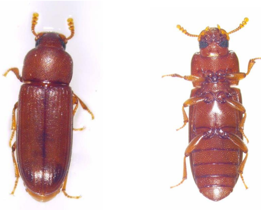
Slika 1. Imago Tribolium castaneum