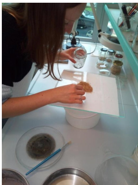
Slika 14. Pregled tretmana