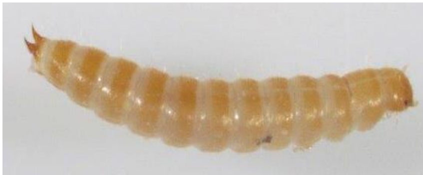
Slika 2. Ličinka Tribolium castaneum