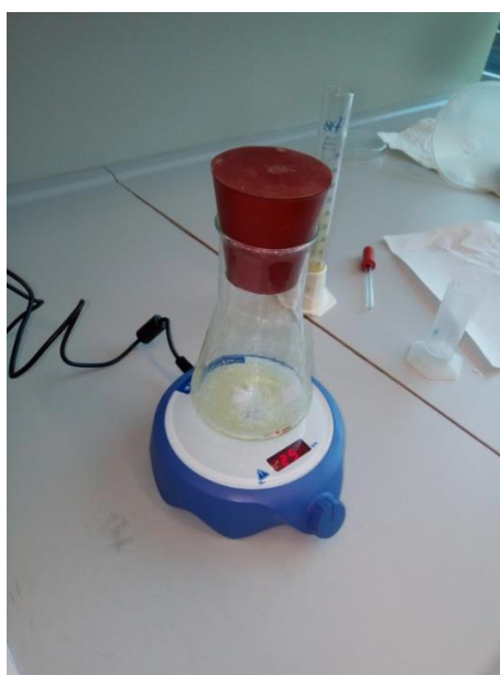
Slika 8. Miješanje svih komponenti magnetskom mješalicom