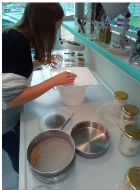
Slika 11. Prosijavanje brašna s T. castaneum