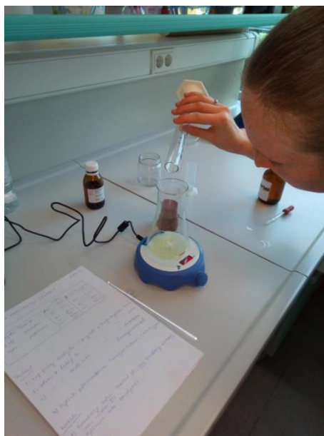
Slika 7. Dodavanje lavandina