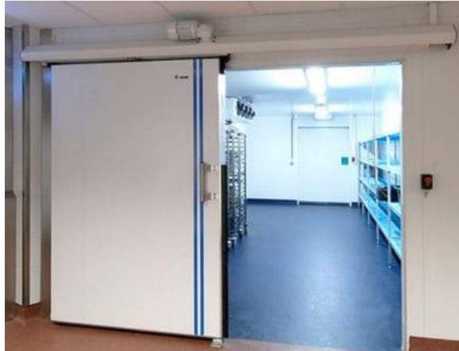
Slika 11. Hladnjača za čuvanje peršina