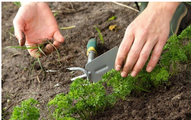
Slika 3. Sadnja peršina u otvorenom tlu

Za proizvodnju sirovine za dobivanje eteričnog ulja sjetvu je najbolje izvršiti krajem ljeta i početkom jeseni. U tom slučaju peršin već iduće godine razvija cvjetnu stabljiku, a proces proizvodnje se skraćuje za nekoliko mjeseci. Da bi sjetva bila uspješna neophodno je osigurati navodnjavanje. Površinski sloj mora biti neprestano vlažan, jer se sjeme nalazi na vrlo maloj dubini (Stepanović i sur. 2001.).