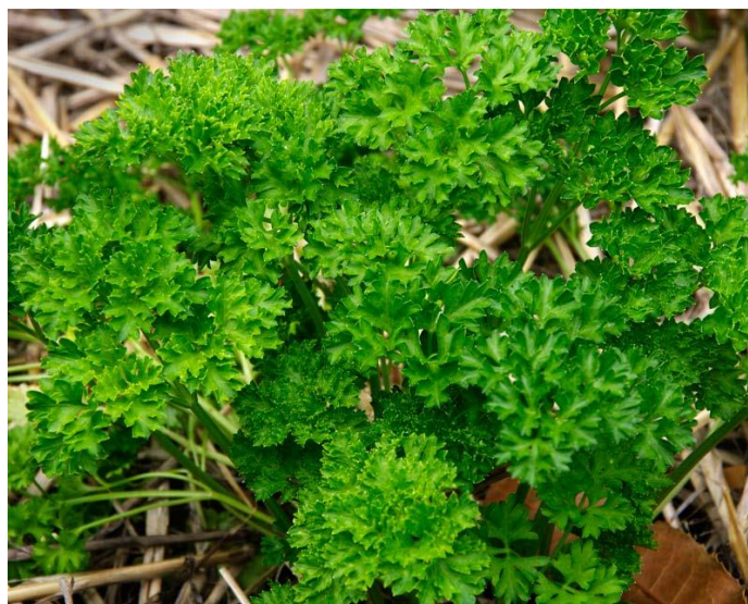
Slika 5. Petroselinum crispum var. crispum

Liske moraju biti uspravnog rasta na čvrstim peteljkama da se lakše slažu u vezice, a važna je i što veća sposobnost regeneracije zbog višekratnih berbi tijekom vegetacije. Peršin glatkih liski je traženiji za upotrebu u svježem stanju, dok je peršin kovrčavih liski traženiji za preradu jer ima povoljniji omjer liski prema peteljkama (više od 50 %) što je bolje kod sušenja, a i zamrznuti listaš kovrčavih liski se lakše pakira. Korijen peršina listaša je račvast, tanak i nema tržišnu vrijednost (Matotan, 1994; Matotan, 2004).