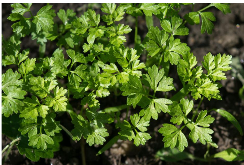
Slika 4. Petroselinum crispum var. neapolitanum

Dva najčešća tipa peršina su: korjenaš ( Petroselinum crispum var. tuberosum ) koji se koristi zbog zadebljalog korijena (mogu se koristiti i lisne plojke) i listaš ( Petroselinum crispum var. crispum , Petroselinum crispum var. neapolitanum ) za uzgoj listova. Prema dužini korijena peršina korjenaša razlikuju se duge (20 do 25 cm) i poluduge (15 do 20 cm) sorte, površina im treba biti glatka, nježne pokožice i bez postranih korjenčića, lisne plojke tih sorti su glatkih liski na čvrstim peteljčkama, tamno zelene boje, a nakon vađenja korijena mogu se koristiti za sušenje. Više se traže poluduge sorte zbog lakšeg vađenja, a vegetacija do tehnološke zrelosti im traje 150 do 200 dana. Podvrste peršina listaša su Petroselinum crispum var. neapolitanum – peršin glatkih liski (Slika 4.) i Petroselinum crispum var. crispum – peršin kovrčavih liski (slika 5.) (Lešić i sur., 2004.).