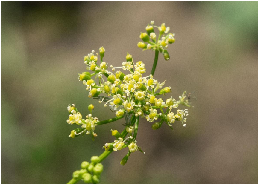
Slika 2. Cvijet peršina

Za prijelaz u generativnu fazu peršin mora proći 5-8 tjedana niskih temperatura (2-6 °C) i to već dosta razvijena biljka s nekoliko listova i malo zadebljanim korijenom. Zbog toga se rijetko događa prijevremeno prorastanje (Matotan, 1994.).