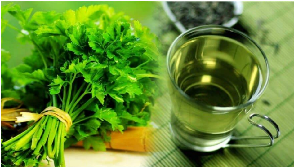
Slika 13. Čaj od peršina

primjer, ne preporučuje konzumacija čaja od peršina jer može izazvati kontrakcije maternice. Također, ima visok udio vitamina K, koji može pridonijeti zgrušavanju krvi. Osim toga, ne preporučuje se onima koji koriste diuretike jer može uzrokovati manjak vode u organizmu. Čaj od peršina nudi mnoga ljekovita svojstva koja općenito pripomažu poboljšanju imuniteta. Treba ga se koristiti oprezno i u umjerenim količinama (Link, 2019.).