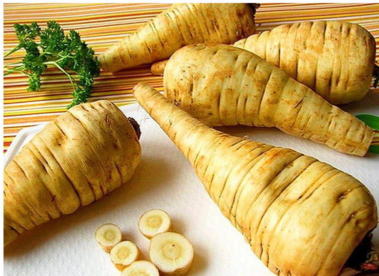
Slika 1. Peršin ( Petroselinum crispum L.)

Također, peršin se koristi za poboljšanje cirkulacije, za probleme kod upale mokraćnih kanala (čaj), za smirenje, za otklanjanje nadutosti, za ublažavanje bolova, za čišćenje krvi a pomaže i pri stvaranju crvenih krvnih zrnaca. Blagotvoran je kod otklanjanja groznice, upale očiju, bolesti bubrega, sunčanih mrlja, mrlja na koži, za ubode i ugrize insekata i srčane tegobe. Sjeme peršina također ima ljekovita svojstva zbog sadržaja eteričnih ulja od kojih ljekovito djelovanje ima apiol, miristicin i terpeni. Esencijalna ulja peršina stimuliraju uterus, povećavaju količinu mokraće, smanjuju infekciju mokraćnog sustava i uništavaju bakterije (Robbers i Tyler, 1999.).