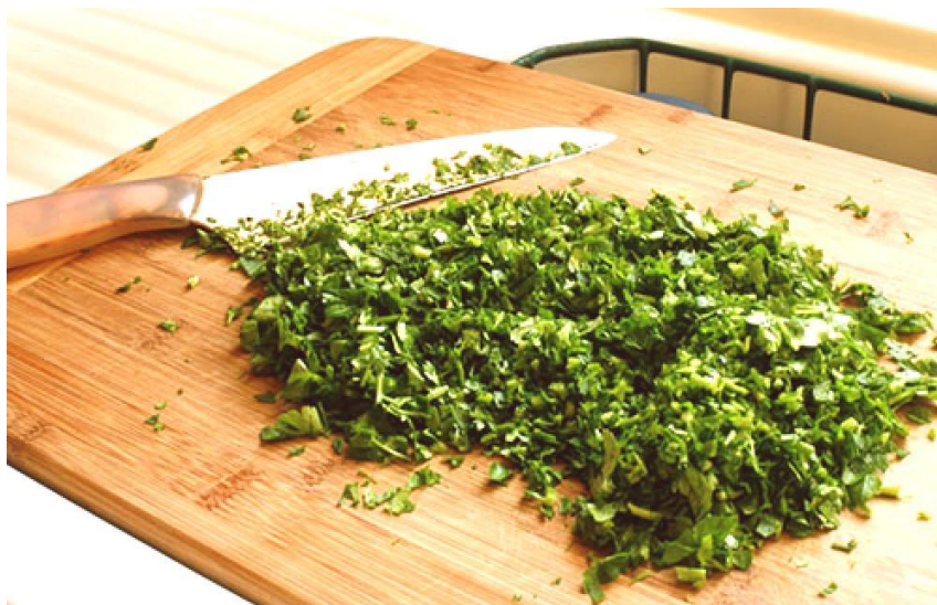
Slika 14. Nasjeckani peršin

Peršin je u našim krajevima univerzalni začina. Sjeckanim lišćem posipaju se salate, juhe, meso i povrće (Slika 14.). Stavlja se u mnoga jela pri koncu kuhanja. Korijen, zajedno sa stabljikom i listom, ide u sve juhe, i to već na početku kuhanja. Tada se mirisima oplemeni sve što je u loncu. Prženim nasjeckanim peršinom posipa se prženo meso i povrće. Sitno nasjeckanim peršinom začinjavaju se maslac i razni umaci te se stavlja i u marinade (Borovac, 2006.).