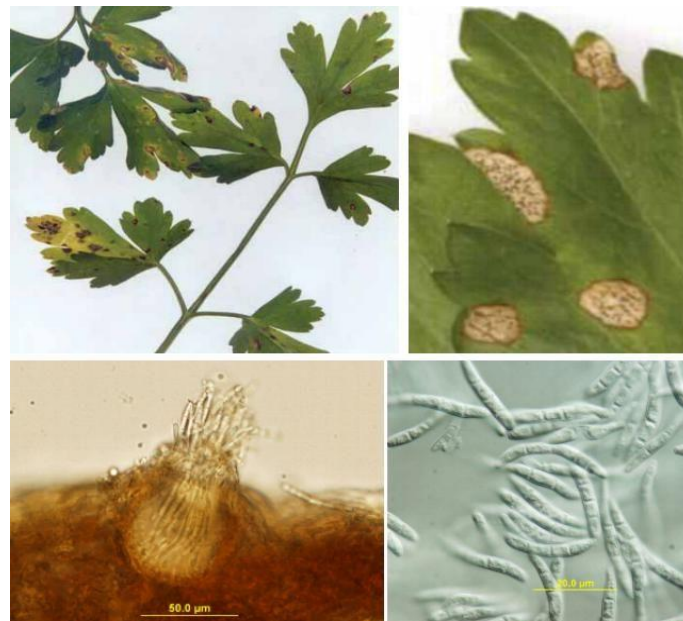
Slika 9. Gljivična bolest na listu peršina Septoria petroselini

Kada je riječ o simptomima napada ličinke mrkvine muhe, prvi simptomi se zamjećuju na listu koji počinje dobivati ljubičastu boju, potom žuti i suši se. Korijen napadnut ličinkama gubi tržišnu vrijednost te se često deformira. Na listovima peršina štete mogu prouzročiti lisni mineri čije ličinke prave hodnike u gornjem dijelu lišća (Matotan, 2004.).