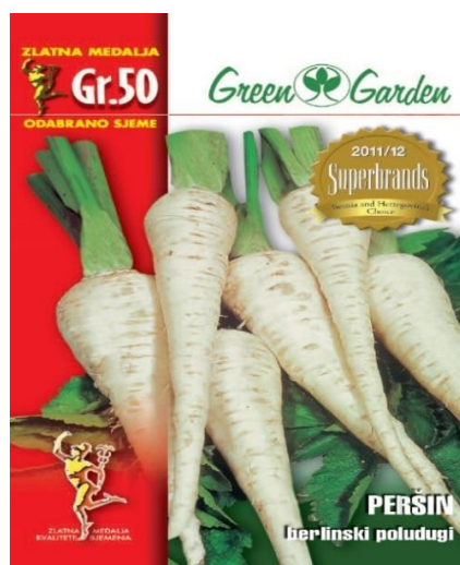
Slika 8. Sorta peršina „Berlinski poludugi“

Srednje rana sorta debelog korijena srednje duljine (Slika 8.). Osim korijena stožastog oblika formira i uspravnu lisnu rozetu s dvadesetak listova. Vrlo aromatična sorta. Korijen je najbolje pohraniti u trap ili podrum, ali može ostati i na otvorenom jer uglavnom ne smrzava (Parađiković, 2009.).