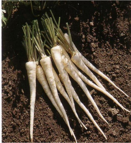
Slika 7. Hibrid peršina „Eagle F1“