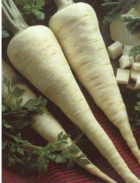
Slika 6. Sorta peršina „Fakir F1“