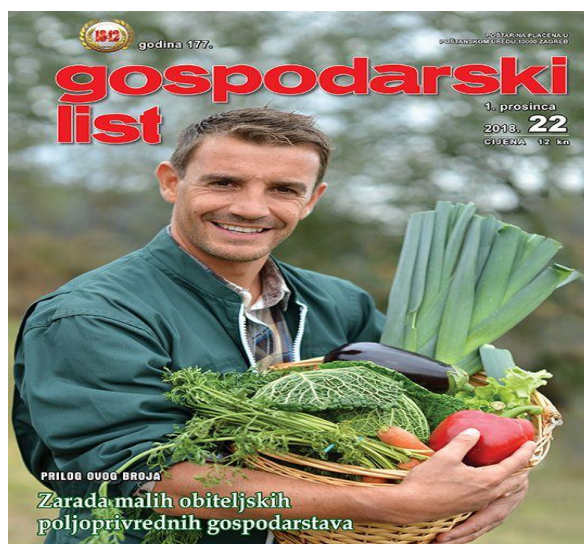
Slika 4. Gospodarski list

Primjerice, poljoprivrednici se mogu reklamirati putem poljoprivrednih časopisa. Jedan od njih je Gospodarski list koji je svojim sadržajem okrenut obiteljskim poljoprivrednim gospodarstvima, velikim i malim poljoprivrednicima donoseći napise iz svih grana poljoprivredne struke.