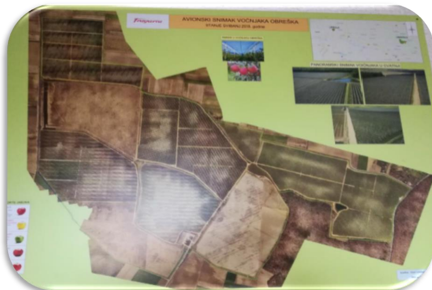
Slika 10. Planski prikaz voćnjaka Obreška