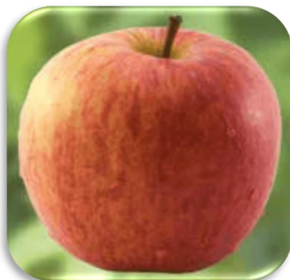
Slika 4. Sorta Fuji

Među navedenim sortama, ističe se jedna vrlo popularna na području Republike Hrvatske, a to je Fuji sorta. Listopadna, visokoproduktivna, plantažna i japanska sorta nastala je križanjem Red Deliciousa i Ralls Janet sorte. Utvrđeno je da (Krpina i sur., 2004.) ova sorta nije dugo prisutna u našoj zemlji i da se nekoliko godina prije 2014. tek pojavila na hrvatskom tržištu.