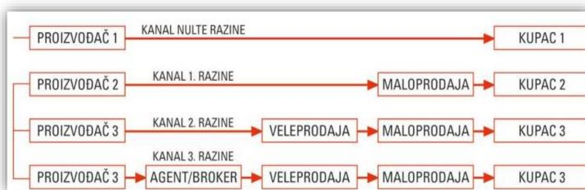
Slika 7. Kanali distribucije za krajnju proizvodnju

Mnogi proizvođači nisu u financijskoj mogućnosti obavljati izravnu prodaju stoga biraju posrednike preko kojih će poslovati. Posrednici u prodaji proizvoda su specijalizirani ljudi koji su upućeni u tržište, prodaju, ekonomsko stanje te koji znaju balansirati između nabave, prodaje i dostave proizvoda.