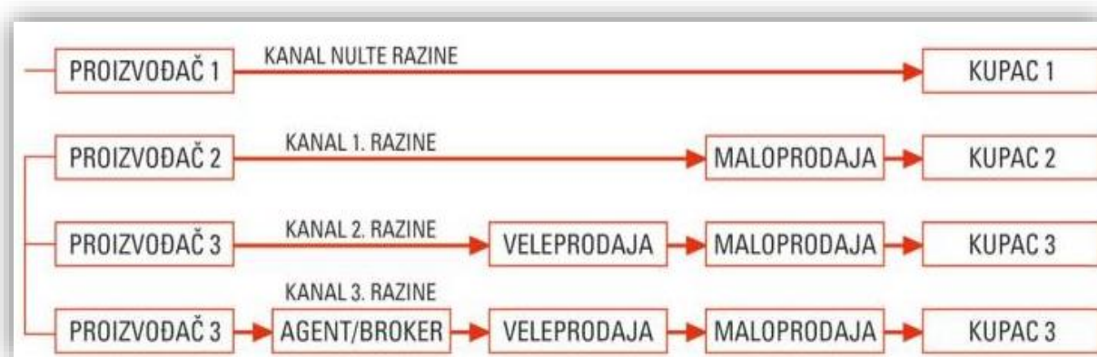
Slika 7. Kanali distribucije za krajnju proizvodnju

Mnogi proizvođači nisu u financijskoj mogućnosti obavljati izravnu prodaju stoga biraju posrednike preko kojih će poslovati. Posrednici u prodaji proizvoda su specijalizirani ljudi koji su upućeni u tržište, prodaju, ekonomsko stanje te koji znaju balansirati između nabave, prodaje i dostave proizvoda.