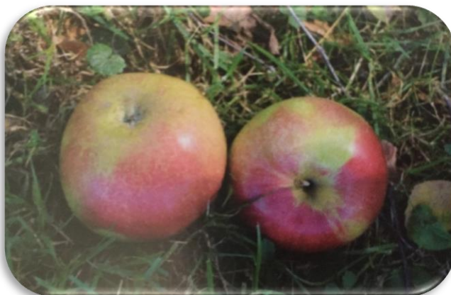
Slika 5. Sorta Idared