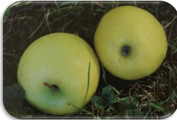
Slika 2. Sorta Golden Delicious

Ovu sortu jabuke otkrio je Paul Stark 1914. godine na brežuljima Zapadne Virginije. Od te godine pa do danas ova sorta jabuke ostvarila je ogromnu popularnost među kupcima ove namirnice. Uzgaja se u svim toplim područjima svijeta namijenjenima za uzgoj ove sorte. Plodovi ove sorte jabuke dozrijevaju od sredine do kraja rujna ( http://www.volim-jabuke.com/sorte/golden-delicious/ ).