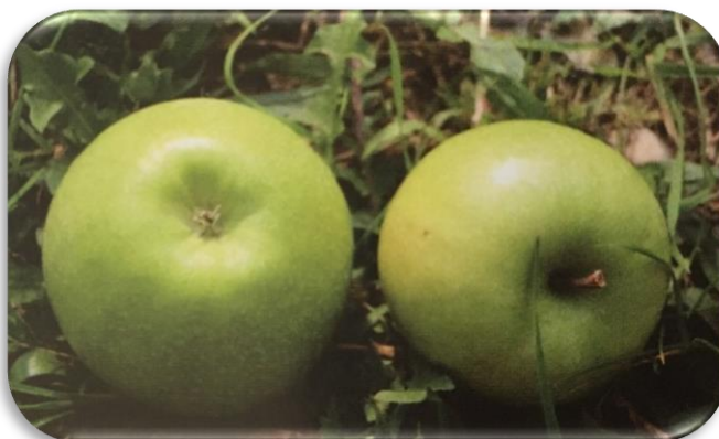
Slika 6. Sorta Granny Smith

Granny smith australska je sorta koja je rezultat kombinacije dvaju sjemena francuskih jabuka (Krpina i sur., 2004.). Ova sorta na europskom području poznata je od davne 1952. godine, dok je na područjima Republike Hrvatske zaživjela tek 1970. godine. Zainteresirala je manji broj potrošača svojim izgledom i posebnim, kiselim i osvježavajućim okusom. Zori sredinom listopada, ali u određenim skladišnim uvjetima može se plasirati na tržište i do lipnja. Uzgoj ove sorte namijenjen je netipičnim jabučarskim područjima koja na području Hrvatske obuhvaćaju područje Dalmacije, Istre i Baranje.