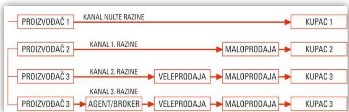
Slika 7. Kanali distribucije za krajnju proizvodnju

Mnogi proizvođači nisu u financijskoj mogućnosti obavljati izravnu prodaju stoga biraju posrednike preko kojih će poslovati. Posrednici u prodaji proizvoda su specijalizirani ljudi koji su upućeni u tržište, prodaju, ekonomsko stanje te koji znaju balansirati između nabave, prodaje i dostave proizvoda.