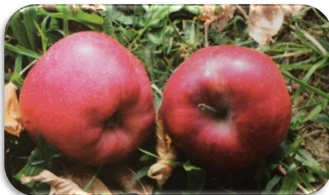
Slika 3. Sorta Red Delicious

Red Delicious ističe se kao visokoproduktivna plantažna sorta. Krpina i sur. (2004.) navode da predstavlja grupu Deliciousa koja je kombinacija svih dobrih i loših osobina ove sorte. Na hrvatskom se tržištu i ne ističe previše i prema podacima među potrošačima je zastupljena tek oko 15%.