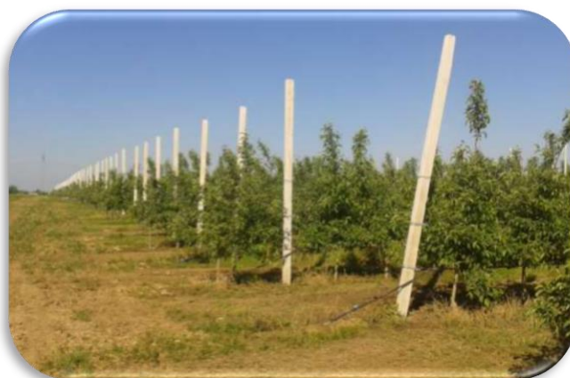
Slika 9. Nasad jabuke u Borincima

Davnih 60' godina 20. stoljeća plantaža Borinci bila je ponos i dika grada Vinkovaca, a njezin najvrjedniji plod jabuka bio je simbol ovoga grada i manifestacije Vinkovačkih jeseni. Manifestacija je nastala kao priredba kojom se slavio početak berbe plodova s njiva, voćnjaka i vinograda, a na plantaži Borinci to se obilježilo na sljedeći način. Djevojke bi u narodnim nošnjama brale prve jabuke na plantaži. Ovaj simboličan čin održavao se svake godine do kraja osamdesetih godina 20. stoljeća. Početkom devedesetih godina i početkom rata ovaj običaj se više nije prakticirao, a s ratom je započela i popast ove poznate i dotada uspješne plantaže. Obzirom na ratno stanje, nekoliko stotina hektara poljoprivredne površine Borinaca bilo je nedostupno za obradu i ispunjeno minama.