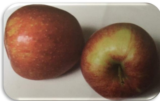
Slika 1. Sorta Jonagold

Krpina i sur. (2004.) ističu ovu plantažnu sortu jabuke kao visokoproduktivnu. To je američka sorta nastala kombinacijom sjemena Golden Deliciousa i Jonathana. S obzirom na nedovoljno njegovano tržište, ova sorta jabuke ne zauzima mjesto koje joj pripada kako u proizvodnji tako i u potrošnji. Tijekom 2004. godine procijenilo se da našoj zemlji ima 15 – 20% potrošača navedene sorte, dok su Krpina i sur. (2004.) procijenili da će postotak narasti i do 30 – 40%.