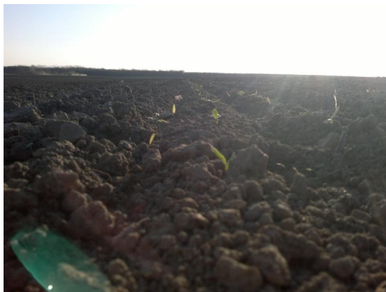
Slika 10. Nicanje šećerne repe

Vegetacijsko razdoblje šećerne repe, prema dinamici porasta i vremenskim prilikama može se podijeliti na tri podrazdoblja od otprilike 60 dana. Od nicanja pa do zatvaranja redova potrebna srednja dnevna temperatura iznosi 10,7^{\circ}\text{C} (Pospišil, 2013.). U 2013. godini to razdoblje traje od druge dekade travnja do početka druge dekade lipnja. Suma srednjih dnevnih temperatura u tom razdoblju iznosi 16,6^{\circ}\text{C} , odnosno 5,9^{\circ}\text{C} više od optimalnog. Od zatvaranja redova do kraja prve dekade kolovoza potrebna srednja dnevna temperatura iznosi 18,8^{\circ}\text{C} , a u 2013. godini suma srednjih dnevnih temperatura iznosi 23,1^{\circ}\text{C} , odnosno 4,3^{\circ}\text{C} više od optimalnog. Zadnje razdoblje koje traje od početka druge dekade kolovoza pa sve do vađenja repe, potrebna suma srednjih dnevnih temperatura iznosi 16,5^{\circ}\text{C} , a u 2013. godini iznosila je neznatno manje, odnosno 16,1^{\circ}\text{C} . U 2013. godini ekstremne temperaturne vrijednosti nisu trajale duže vremensko razdoblje, a vrijednosti srednjih dnevnih temperatura bile su povišene pa možemo zaključiti da su i temperature utjecale na rezultate pokusa.