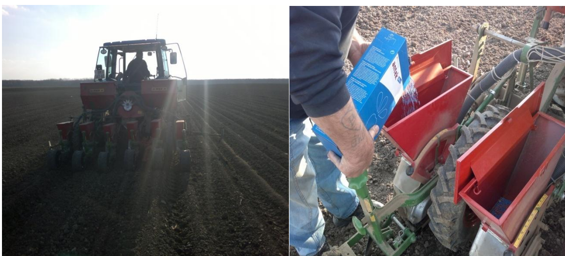
Slika 6. Sjetva šesterorednom sijačicom (lijevo) i sjetva sjemena Antek (desno), Strube