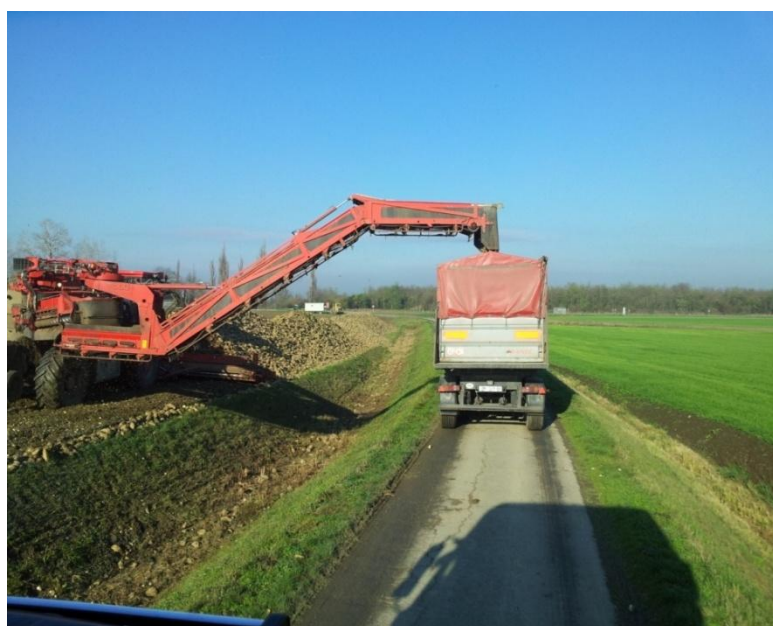
Slika 3. Stroj za čišćenje i utovar šećerne repe