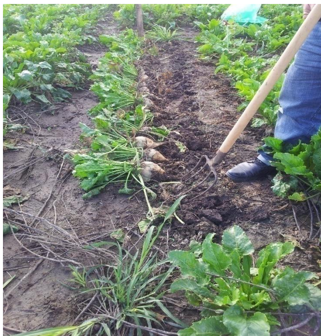
Slika 7. Vađenje šećerne repe vilama

Čišćenje, odsijecanje glava i vaganje šećerne repe obavljeno je na poljoprivrednom imanju Petra Pranjica (Slika 8. i 9.). Uzorci su potom proslijeđeni na kemijske analize tvrtki Inspecto d.o.o.. Tvrtka INSPECTO d.o.o. kontrolna je kuća koja se bavi kontrolom kakvoće robe i sirovina u silosima, skladištima i teretnim lukama. Opseg kontrole obuhvaća laboratorijska ispitivanja poljoprivrednih proizvoda, žitarica, uljarica, kao i hranu za životinje, šećernu repu, tlo i mineralna gnojiva. Laboratorij je akreditiran od strane Hrvatske akreditacijske agencije prema zahtjevima norme HRN EN ISO/IEC 17025 za ispitivanje izabranih svojstava stočne hrane, žitarica, proizvoda od žitarica, uljarica i kukuruza ( www.inspecto.hr ). Prema Buchholzu i sur. (1995.) na sljedeći način izračunavamo parametre za procjenu kvalitete šećerne repe: