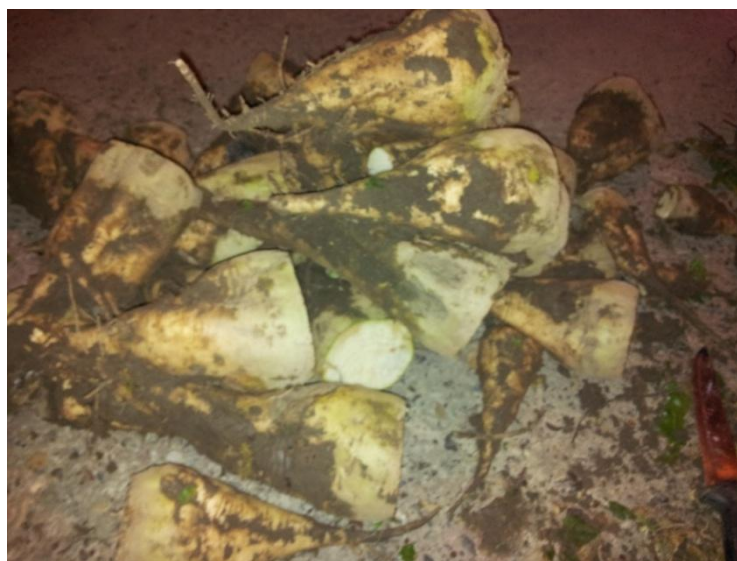
Slika 9. Čišćenje korijena šećerne repe