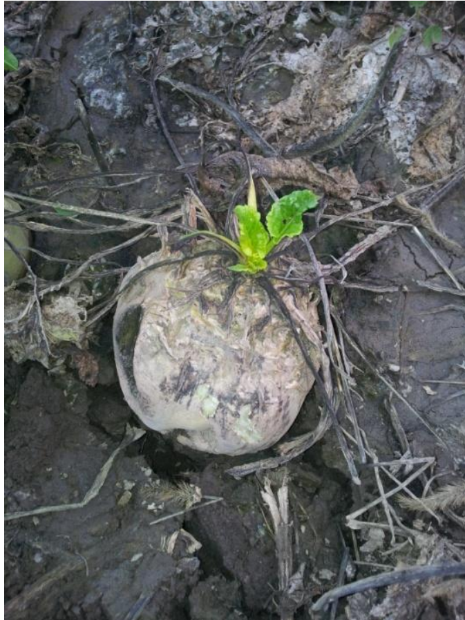
Slika 1. Pojava retrovegetacije uslijed oštećenja lista