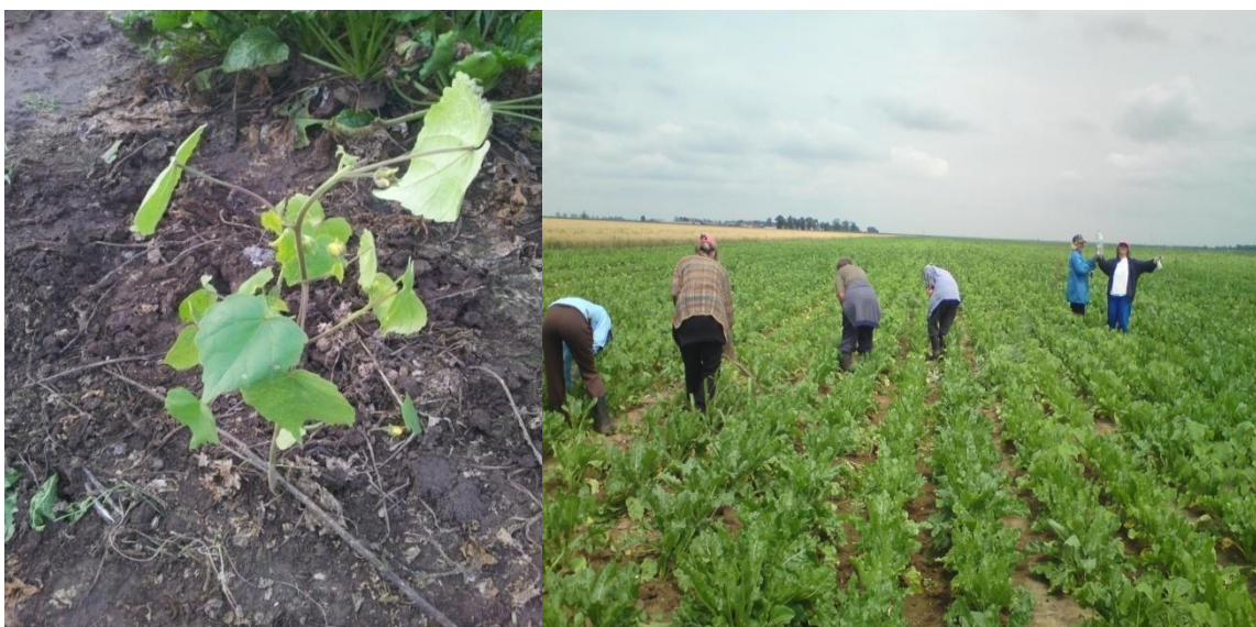
Slika 2. Europski mračnjak (lijevo) i kopanje korova u usjevu (desno)

Od štetnika najzastupljenija je i najštetnija repina pipa ( Bothynoderes punctiventris Germ), koja uništava šećernu repu pri nicanju izgrizanjem supki. Suzbijanje se vrši sjetvom tretiranog sistemskim insekticidima, ali u godinama jakog napada, kada ni to nije dovoljno, potrebno je preorati i cijeli usjev. Od ostalih štetnika zastupljeni su žičnjaci, gusjenice sovice pozemljaša, repin buhač, lisne uši, lisne sovice, repin moljac i repina muha. Suzbijanje štetnika vrši se pravodobnom primjenom insekticida, plodoredom, sjetvom otpornih genotipova, zelenom gnojidbom te uklanjanjem korova domaćina (Ivezić, 2008.).