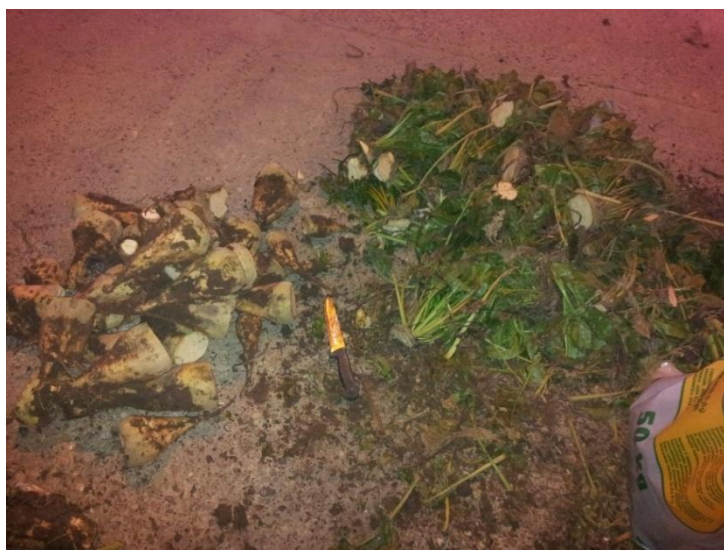
Slika 8. Odsijecanje glava s lišćem