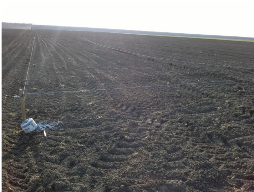
Slika 5. Priprema pokusnog djela za sjetvu

U redovnom roku sjetve šećerne repe obrta Pranjić Promet 15. travnja 2013. godine, izdvojen je dio za izvršenje pokusa te je toga dana zasijan i pokus (Slika 5.). Drugi rok sjetve bio je 15 dana nakon prvog roka, odnosno 30. travnja 2013. godine. Sjetva je izvršena pomoću šesteroredne sijačice (Slika 6.) na dužinu od 30 metara sa međurednim razmakom od 50 cm, razmakom u redu 15,5 cm i dubinom sjetve 3 cm. Razlog gušće sjetve su vremenski uvjeti i kasna sjetva šećerne repe. Za pokus je korišteno sjeme proizvođača Strube, Antek (Slika 6.).