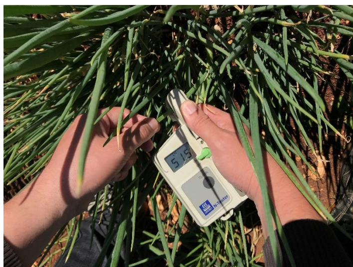
Slika 6. Određivanje indeksa klorofila u listu