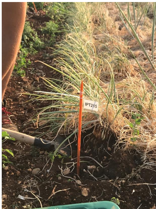
Slika 11. Vađenje ljutike i luka kozjaka