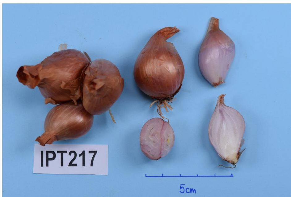
Slika 19. IPT217

Najveći vegetacijski indeks izmjeren je kod primke IPT217 ( 68,0 \pm 0 ). U usporedbi s primkom IPT217 statističku opravdanu razliku nismo našli kod sljedećih primki A. cepa Agregatum grupe: IPT208, IPT216, IPT218, IPT225, IPT229; dok su se sve ostale primke, uključujući i cijelu skupinu A. x cornutum , statistički značajno razlikovale, odnosno imale su manji NDVI. Najmanji vegetacijski indeks izmjeren je na primci IPT022 ( 37,5 \pm 0,7 ), a ona pripada vrsti A. x cornutum (Slika 19).