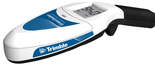
Slika 2. Trimble GreenSeeker