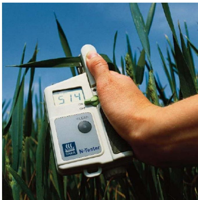
Slika 5. Yara N- Tester