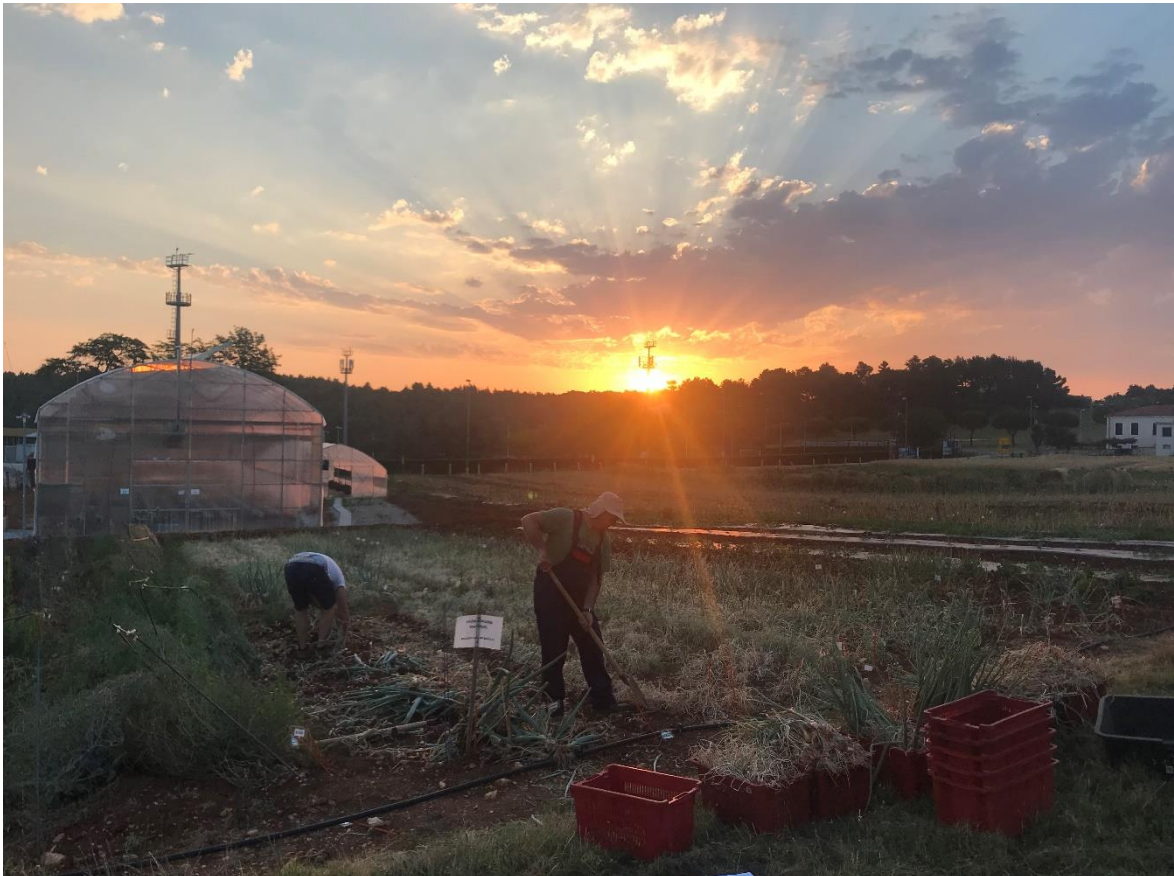
Slika 1. Nasad Luka kozjaka i ljutike na Institutu za poljoprivredu i turizam u vrijeme vađenja lukovica

Cilj diplomskog rada je utvrditi morfološke razlike i razlike u prinosu između primki dviju vrsta - luka kozjaka ( A. cepa Agregatum) i ljutike ( A. × cornutum ).