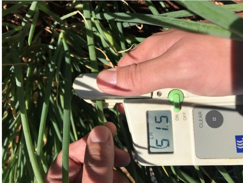
Slika 7. Određivanje indeksa klorofila u listu