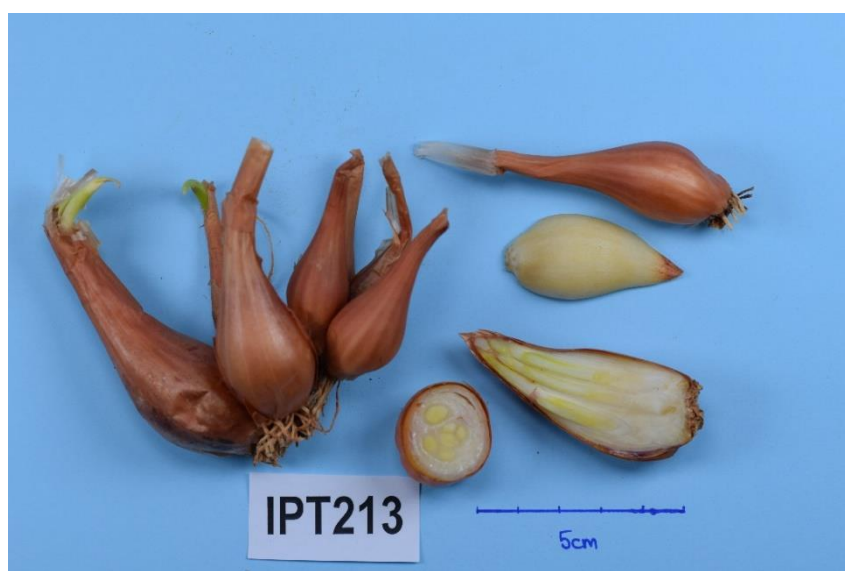
Slika 18. Primka IPT213

Primke IPT213 i IPT214 imaju najveći broj biljaka u busenu ( 28,8 \pm 11,4 i 26,6 \pm 10,4 ), a spadaju u vrstu A. x cornutum (Slika 18). Utvrđeno je da se sve primke osim primki IPT212 i IPT215 opravdano razlikuju od primki IPT213 i IPT214 obzirom na broj biljaka u busenu. Najmanji broj biljaka u busenu utvrdili smo kod primke IPT230 ( 4,6 \pm 1,2 ) koja pripada u vrstu A. cepa Agregatum grupi.