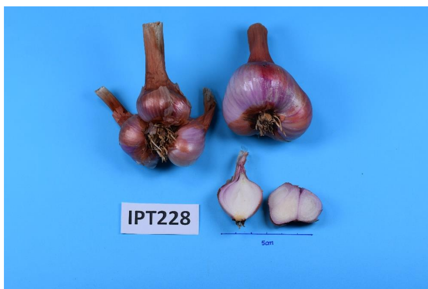
Slika 16. Primka IPT228

Testom višestrukih usporedbi utvrđeno je da najveći promjer busena imaju primke IPT228 ( 50,4 \pm 5,8 cm) i IPT230 ( 50,2 \pm 9,9 cm), a obje primke pripadaju vrsti A. cepa Aggregatum grupa (Slika 16). Promjer busena primke IPT228 statistički se ne razlikuje od promjera busena većine primki koje pripadaju vrsti A. cepa Aggregatum grupa, ali postoji statistički opravdana razlika između navedene primke i svih primki koje pripadaju vrsti A. x cornutum . Primka IPT213, koja pripada pod vrstu A. x cornutum , imala je najmanji promjer busena te je on iznosio 25,5 \pm 3,3 cm.