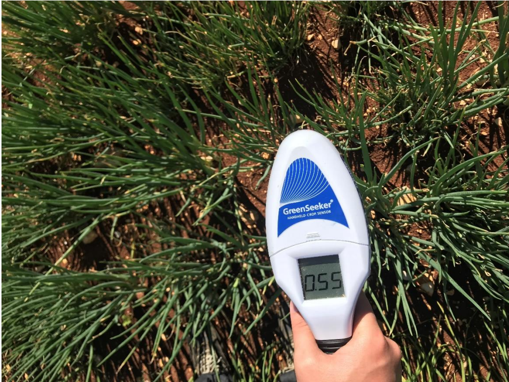
Slika 4. Mjerenje vegetacijskog indeksa