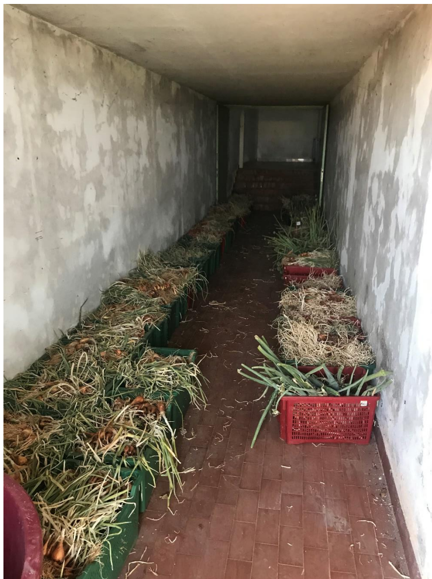
Slika 14. Privremeno skladištenje ljutike i luka kozjaka