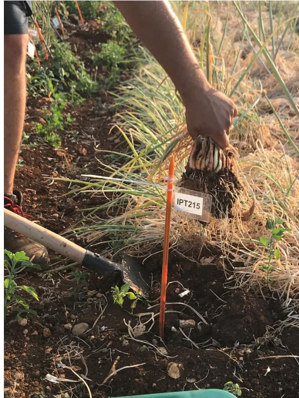
Slika 12. Vađenje Ljutike i Luka kozjaka