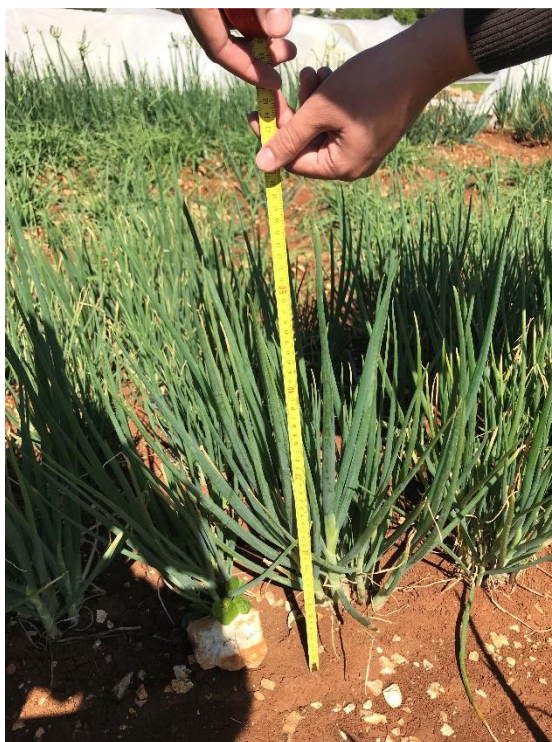
Slika 9. Visina busena