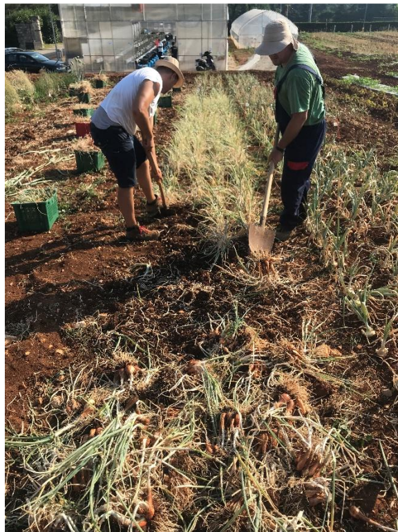
Slika 13. Vađenje Ljutike i Luka kozjaka