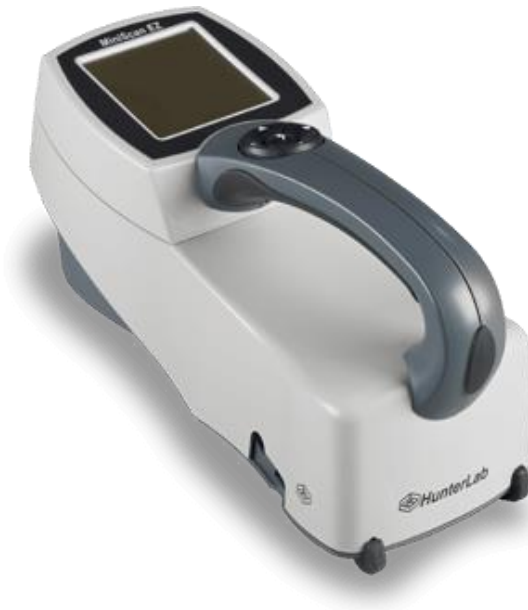
Slika 15. MiniScan EZ

a u negativnim vrijednost zelenu boju i b* u pozitivnim vrijednostima predstavlja žutu boju, a plava boja negativne vrijednosti parametra.