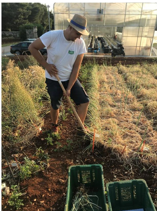
Slika 10. Vađenje ljutike i luka kozjaka