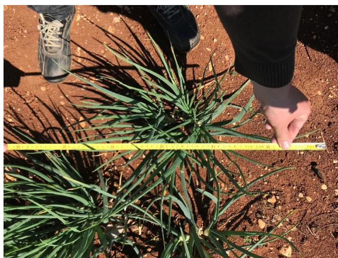
Slika 8. Promjer busena

U punoj vegetaciji (12. travanj 2019.) u kolekcijskom nasadu ljutike i luka kozjaka izmjerene su fenotipske karakteristike svake pojedinačne primke. Od svake primke, slučajnim odabirom izabrano je po 10 busena na kojima su se uz pomoć ručnog metra mjerili sljedeći parametri: promjer busena (najveći i najmanji promjer), visina busena i broj lukovica po busenu (Slika 8 i 9).