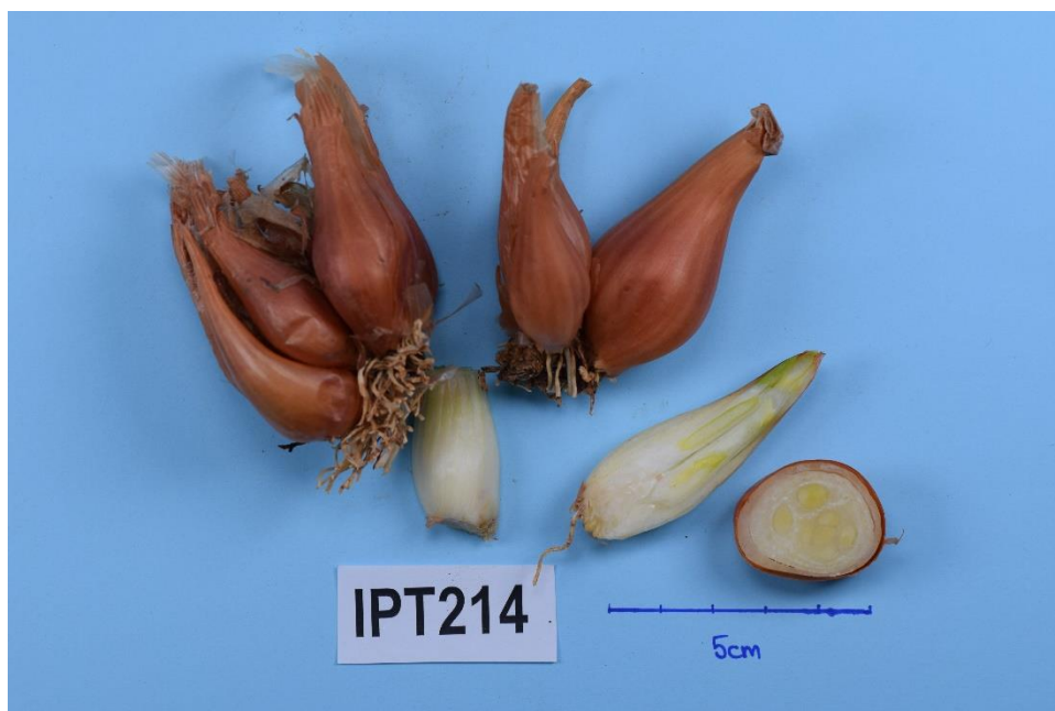
Slika 20. Primka IPT214