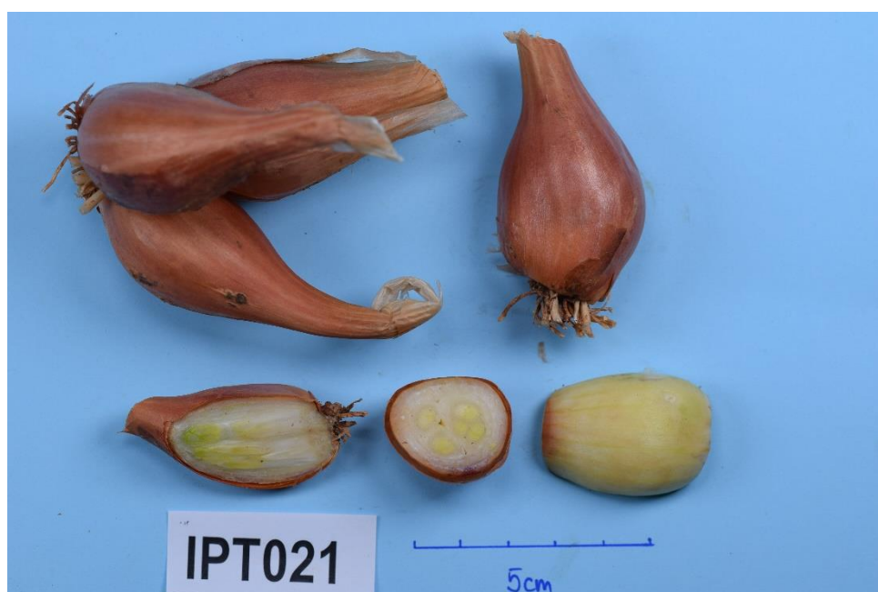
Slika 22. Primka IPT021