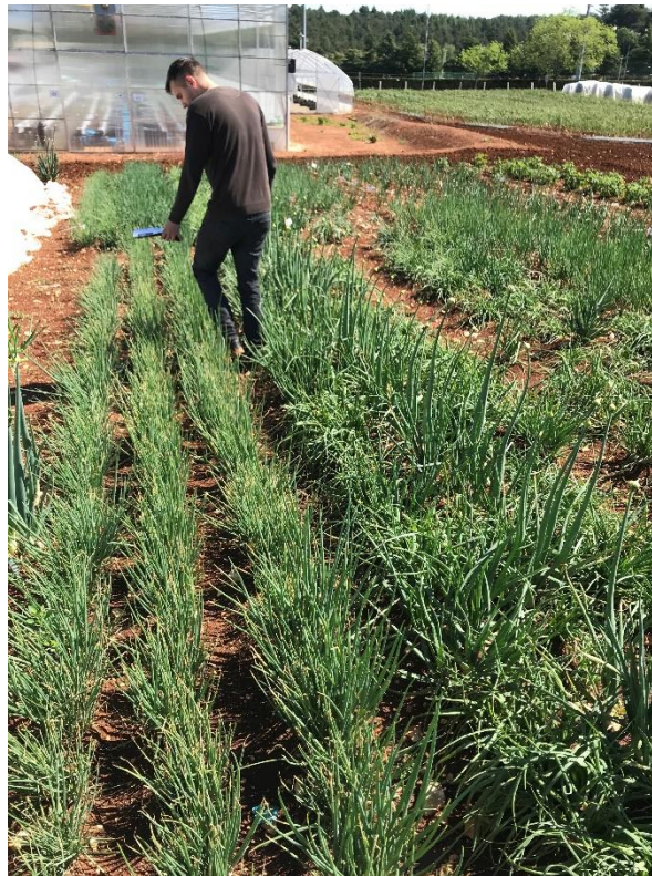
Slika 3. Mjerenje vegetacijskog indeksa