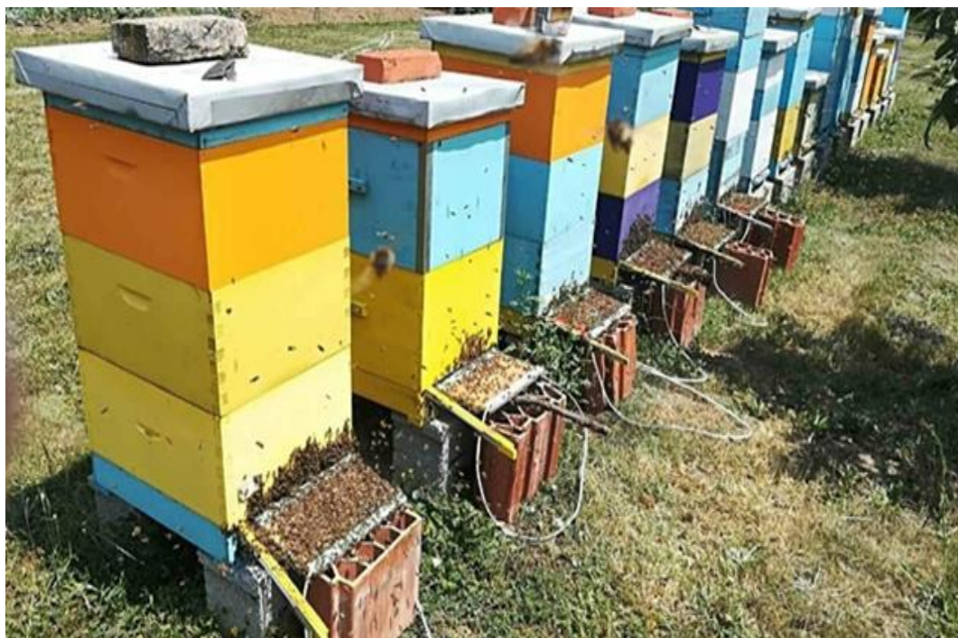
Slika 5. Sakupljači na ulazu u košnicu

Provodeći navedene metode zaključeno je da se postavljanjem električnih ploča unutar košnice (Slika 6.) dobija otrov sa manje nečistoća nego kada se postavljaju na leto košnice, a način prikupljanja je gotovo isti. Kolektorski okviri mogu biti veličine saća. Pčele dolaze u kontakt s električnom rešetkom i izmjeničnom strujom te kada osjete blagi strujni udar ubrizgavaju otrov na staklenu ploču koja se nalazi iza membrane. Staklene se ploče suše u tamnom, dobro prozračenom prostoru kroz jedan dan. Kada se osuši otrov na staklenim pločama struže se žiletima i dobija se prah koji se sprema u bočice.