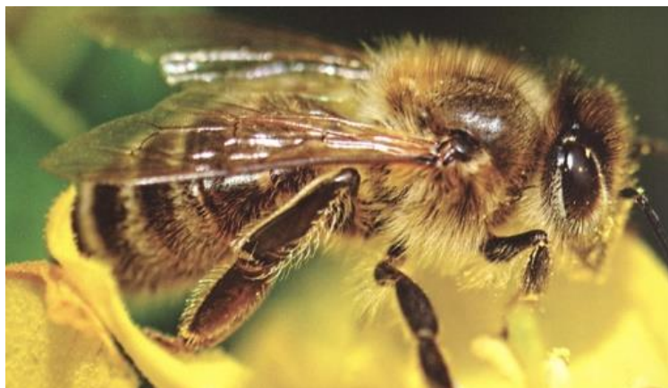
Slika 1. Pčela radilica (Izvor: https://www.cosmosolgroup.com/index.php/enciklopedija-znanja-cosmosolgroup/45-pcele )

Medonosna pčela, Apis mellifera L. (Slika 1) je pripadnik razreda kukaca od velike važnosti za ljude i prirodu. One su društveni kukci koji u prirodi žive u šupljinama drveća ili stijena, a čovjek ih je pripitomio kako bi lakše dolazio do njihovih proizvoda i sagradio im je košnice u kojima žive. Pčele su vrlo organizirane, svaka pčela zna svoju ulogu u košnici. Tako se razlikuju hraniteljice, graditeljice, čistačice, stražarice i sakupljačice. Matica je jedina ženka u košnici koja je spolno zrela i koja se cijeli život hrani matičom mliječi, dok pčele radilice nisu plodne i one dobivaju matičnu mliječ samo prvih nekoliko dana kao i trutovi. Trutovi se razvijaju iz neoplođenih jaja, a ženke se razvijaju iz oplodjenih jaja. Uloga trutova je sparivanje s maticom.