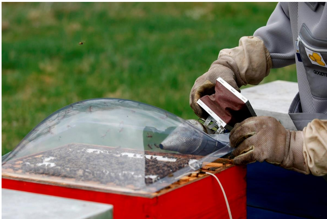
Slika 6. Sakupljači otrova u košnici

Elektrostimulacija kao način prikupljanja pčelinjeg otrova je tijekom godina, ali i kroz mnoga istraživanja vrlo napredovala (Soldić, 2019). Došlo je do toga da je omogućeno prikupljanje i do 1 grama otrova u periodu od 1-2 sata rada, na 20 pčelinjih društava. Najučinkovitiji intervali prikupljanja pčelinjeg otrova su se pokazali svaka 2-3 tjedna jer pčele mogu biti uznemirene i do tjedan dana nakon uzimanja otrova. (Parcela, 2018.).