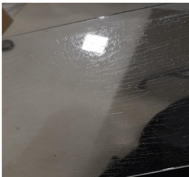
Slika 2. Osušeni pčelinji otrov na staklu