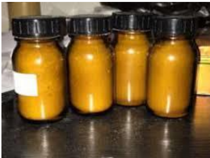
Slika 7. Pčelinji otrov zapakiran u staklene bočice i spreman za prodaju (izvor: https://repozitorij.agr.unizg.hr/islandora/object/agr%3A1090/datastream/PDF/view )

Pčelinji otrov se na tržištu može naći u različitim oblicima iako je nevažno u kojem će se obliku naći jer je njegova količina iznimno ograničena. Može biti prodan kao potpuni pčelinji ekstrakt (slika 7), kao čisti tekući otrov ili kao ubrizgavajuće sredstvo odnosno injekcija. Većina otrova se prodaje u suhom kristalnom obliku, te svoju primjenu može pronaći bilo gdje zbog svojih ljekovitih svojstava. Pčelinji otrov u kristalnom obliku je stabilniji i lakše je pronaći nečistoće koje mogu biti prisutne u njemu te ga je takvog teško krivotvoriti. Tekući otrov za prodaju bi trebao biti jasan i bezbojan, ako promjeni boju utamniju znači da je blago oksidirao te se tako može izgubiti njegova učinkovitost. Proizvođač pčelinjeg otrova kao i sam kupac bi trebali imati odgovarajuće mogućnosti za pohranu kako nebi došlo do gubljenja učinkovitosti i karakteristika pčelinjeg otrova. Pčelinji otrov je vrlo specifičan proizvod s vrlo malo mogućih kupaca. Tržišni je volumen relativno malen. Proizvodnja postoji u mnogim zemljama, ali ne postoji točni podatak o obujmu proizvodnje.