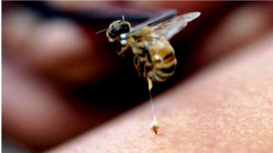
Slika 4. Ubod pčele

Jedan od načina da bi se dobio otrov žive pčele je uzimanje pincetom ili rukom. Žalac strši prema van koji dodiruje površinu čaše, otrov se izlije i brzo osuši. Osušeni otrov na čašama se može čuvati neograničeno vrijeme, a pri tome ne gubi na svojoj kvaliteti. Ovakvim načinom se dobije visokokvalitetan otrov, ali su visoki troškovi rada i nije praktično.