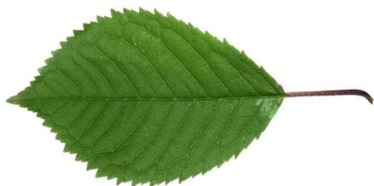
Slika 1. List višnje

Višnja je plemenito voće nastalo križanjem domaće, slatke trešnje s divljim, kiselijim vrstama. Jedna je od najstarijih voćki koje je čovjek koristio te se smatra da se počela uzgajati čak prije 2500 godina. Porijeklom je iz Male Azije. Višnja ( Prunus cerasus L.) je listopadno stablo iz porodice ruža ( Rosaceae ), koja može dosegnuti visinu i do 6 m tvoreći mnogo grana i okruglastu, razgranatu krošnju. Najbolje raste na vlažnim i bogatim tlima jer zahtjeva puno dušika i vode. Grane višnje su obično vitke i opuštene, u početku gole, dok je kora crvenkastosmeđa i sjajna s hrapavim vodoravnim prugama (plantea.com.hr/visnja/, 2020.).