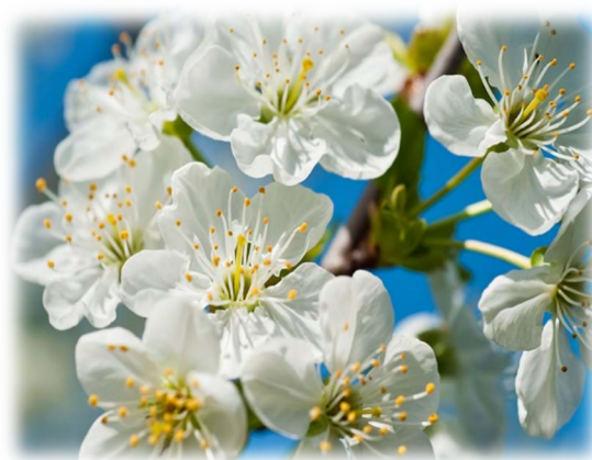
Slika 2. Cvijet višnje