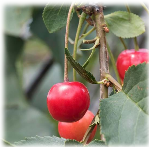
Slika 3. Plod višnje