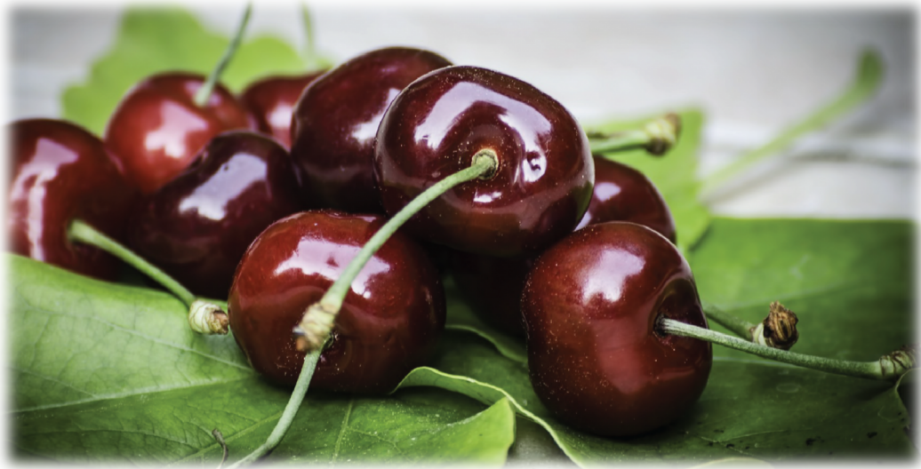
Slika 4. Maraska

kvalitetu i one koji su prikladni za mehaniziranu berbu. Plodovi dozrijevaju oko 1. srpnja. Plod je sitan (Slika 4), okruglog oblika, tamnocrven do crn. Plod sadrži 25 % suhe materije i oko 1,3 % kiseline. Meso ploda je mekano, sočno i tamnocrveno, slatkokiselkastog okusa i odlične kakvoće. Koštica čini oko 14 % težine ploda. Maraska je poznata i kao sirovina za čuveni liker maraskino (Stanković, 1980.; Krpina i sur., 2004.).