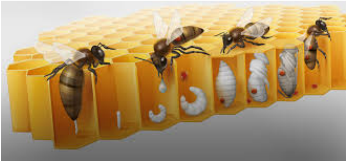
Slika 8. Razmnožavanje grinje Varroa destructor

Kemp, 1997.). Smrtnost potomka grinje glavni je čimbenik uspjeha razmnožavanja i varira ovisno o klimi, sezoni i podvrstama pčela (Eguaras i sur., 1995.; Ifantidis i sur., 1999.; Mondragón i sur., 2005., 2006.).