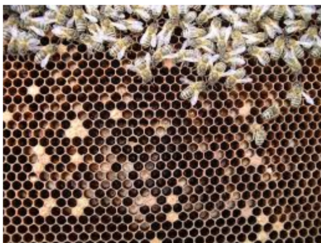
Slika 3.- Europska gnjiloća pčela

Europska gnjiloća medonosne pčele (Slika 3.) je zarazna bolest uglavnom nepoklopljenog pčelinjeg legla uzrokovana primarno bakterijom Melissococcus plutonius .