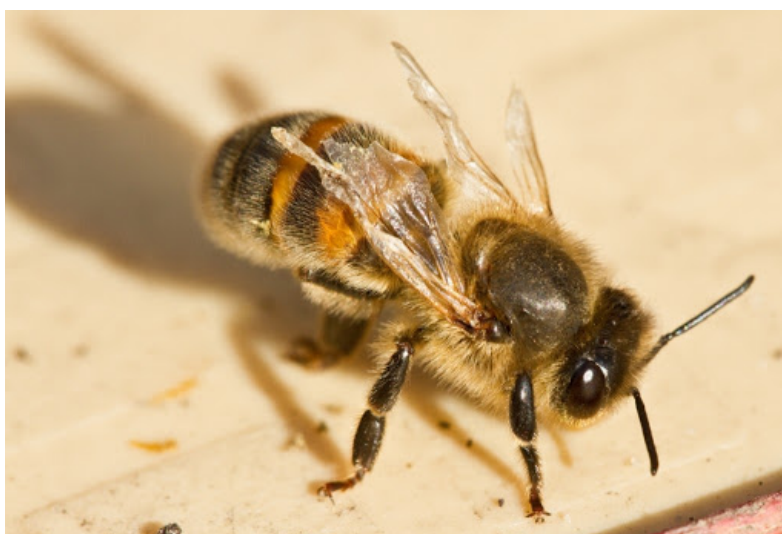
Slika 5.- Virus deformiranih krila

Virus deformiranih krila (Slika 5.) je povezan s grinjom varoe. On se prenosi preko hrane, izmeta, s matice na jaje i sa truta na maticu. Zaraza ovim virusom uzrokuje prijevremeno uginuće kukuljice, deformirana krila, skraćeni abdomen. Uginuće se događa unutar tri dana što uzrokuje veliki pad pčelinje zajednice.