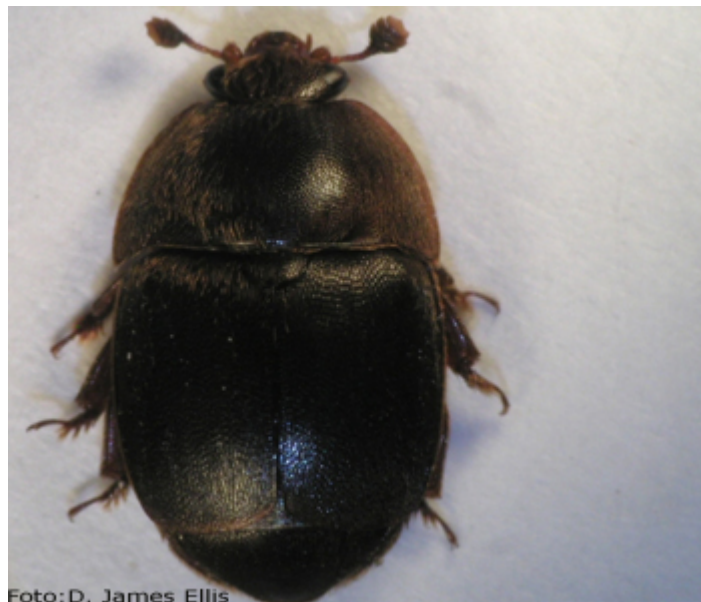
Slika 4.- Mali kornjaš košnice ( Aethina tumida )

Etinoza (kornjaš Aethina tumida ) (Slika 4.) je bolest koja svojom pojavom uzrokuje velike gubitke i stalan nadzor nad njenom kontrolom. Mali kornjaš košnice je u Europi (Italiji) prisutan već godinama.