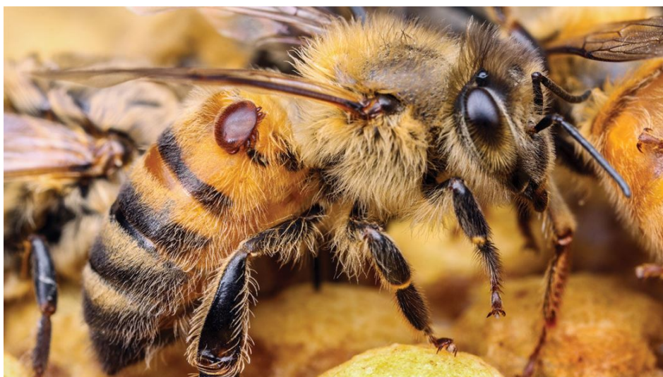
Slika 7.- Grinja Varroa destructor na domaćinu

Varroa destructor konstantno je povezana s domaćinom i može živjeti jedino u košnici. Postoje dvije faze u životnom ciklusu varoe a to su: foretska faza, kada se nalazi na odraslim pčelama (slika 7) i reproduktivna faza kada se nalazi u leglu (Slika 8). Grinje se hrane bjelančevinasto-masnim tkivom odraslih pčela i legla. Putem odraslih pčela varoe ulaze u leglo pred poklapanje kako bi započele process razmnožavanja. Optimalna temperatura za život je između 26 i 33 °C (Le Conte i Arnold, 1987.; Pätzold i Ritter, 1989.; Rosenkranz, 1988.), a temperatura u košnici je između 34,5-35°C. Unutar pčelinje zajednice varoa ulazi u stanicu legla 15-20 sati prije poklapanja, a kod trutova 40-50 sati prije zatvaranja. Činjenica je da češće napadaju ličinke trutova jer izlučuju veće količine estera. Stanice koje imaju kraći razmak između ličinke i stijenke stanice. Taj učinak je potvrđen uporabom različitih metoda s manipuliranim stanicama legla unutar pčelinje zajednice (Boot i sur., 1995.; De Ruijter i Calis, 1988.; Goetz i Koeniger., 1993; Kuenen i Calderone, 2000.).