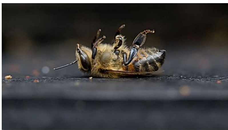
Slika 10.- uginula pčela radi parazita Varroa destructor

Varoa radi oštećenja na pčelama na razne načine, a jedan od najznačajnijih je putem ishrane bjelančevinasto-masnim tkivom na leglu ili odraslim pčelama. Pčele koje su se razvile iz zaražene stanice legla tijekom ranog razvoja uzimaju više hrane i žive kraćim životom. (Slika 10.) Međutim, najveći problem varoe je što djeluje kao vektor u prijenosu virusa i danas je poznato 18 virusa koji napadaju pčele i uništavaju normalno funkcioniranje cijele zajednice.