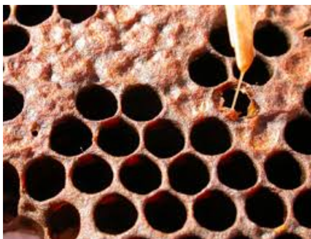
Slika 2.- Američka gnjiloća pčela

Američka gnjiloća medonosne pčele (Slika 2.) je zarazna kontagiozna bolest poklopljenog i nepoklopljenog pčelinjeg legla uzrokovana sporogenom bakterijom Paenibacillus larvae .