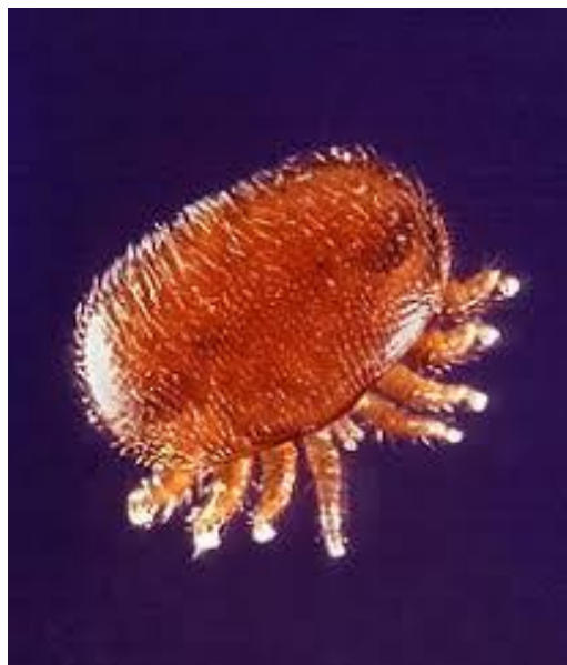
Slika 6.- Grinja Varroa destructor

( https://en.wikipedia.org/wiki/Varroa#/media/File:Varroa_Mite.jpg )