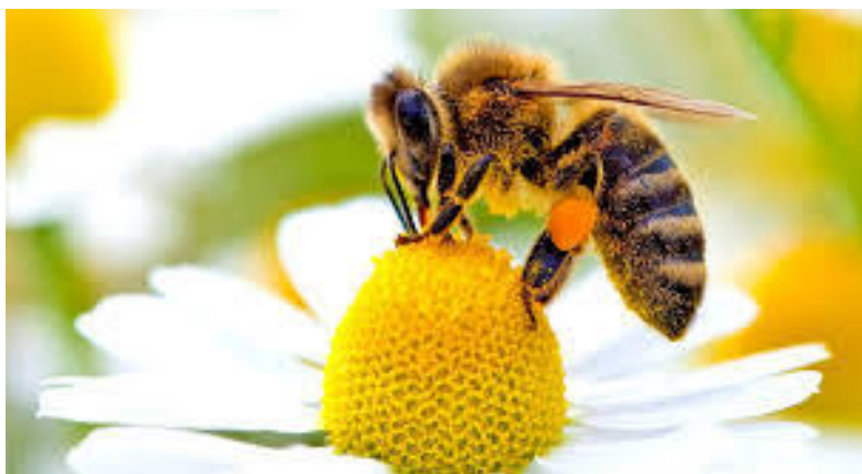
Slika 1.- Medonosna pčela na cvijetu

Pčele su životinje koje žive u prirodi u šupljinama koje su pogodne za stvaranje pčelinje zajednice, a pripitomljene pčele žive u košnicama koje su sagrađene od čovjeka te u nju, na vrhuncu sezone, stane i do 50 000 pčela. Imaju važnu ulogu u poljoprivredi zbog načina oprašivanja biljaka te proizvodnje hrane za ljudsku upotrebu. Pčele u košnici imaju razne uloge: graditeljice, hraniteljice, stražarice i sakupljačice. U košnici razlikujemo maticu i radilice (pčele koje su nastale iz oplođenih stanica i sve su ženke) i truta (pčele koje se razvijaju iz neoplođenih jajašaca i oni su mužjaci). Sezona započinje u veljači i traje sve do mjeseca studenoga i za to vrijeme matica svakodnevno polaže nova jajašca i nalazi se u dubini košnice. Matica je jedina ženka u košnici koja ima sposobnost reprodukcije i hrani se matičnom mliječju. Pčele radilice se hrane matičnom mliječju samo prva tri dana, ali matica se njome hrani čitav život. Hrane se peludi i nektarom koji sakupljaju od biljaka (Slika 1.). Nektar usišu, a pelud sakupljaju na nogama i nose ga u košnicu i ondje ga odlažu. Nektar spremaju u saće koje kada ispari vlaga postaje med uz pomoć enzima. Nakon tog procesa, pčele saće zatvore sa voskom. Pčele med koriste kao zalihu hrane za zimske mjesece, a pelud se koristi kao prehrana i razvoj mladih pčela. Jedina obrana pčela je žalac koji koriste kada se osjećaju ugroženo.