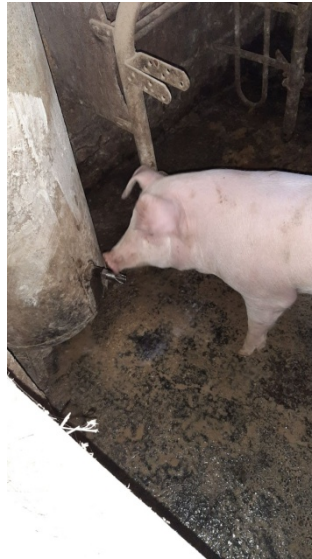
Slika 4. Pojilica za pitku vodu

sisaljke. Takve pojilice izrađuju se za prasce tjelesne mase do 30 kg i za napajanje starijih kategorija svinja. Za prasad postavljaju se 10 cm iznad njihovih leđa, a jedna pojilica može opsluživati 10-15 prasadi. Protok vode je obično 5 litara u minuti.