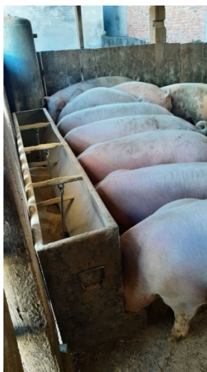
Slika 5. Hranilica za tovljenike