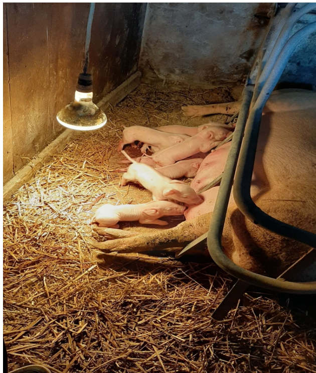
Slika 3. Prasci nakon poroda

Indeks prašenja na gospodarstvu iznosi oko 1,9 do 2. Proizvodni vijek krmača traje 3-4 godine. Gravidnost krmača traje 112-115 dana. Prosječan broj prasadi u leglu po krmači iznosi 10. Krmači su osigurani pogodni uvjeti za prasenje, najmanje 5 dana prije bude premještena u boks. Prostor je zagrijan, slama služi kao stelja, te je sve spremno za prasenje. Za vrijeme prasenja uvijek je netko prisutan, svako prase obriše suhom krpom, odreže pupak te ga stavi da sisa. Krmače se obično prase kasno navečer, pa se odmah idući dan odrežu zubi prascima kako nebi oštetili sisu. Otac je usavršio davanje injekcije što smanjuje veterinarske troškove, pa sam daje prascima potrebno željezo.