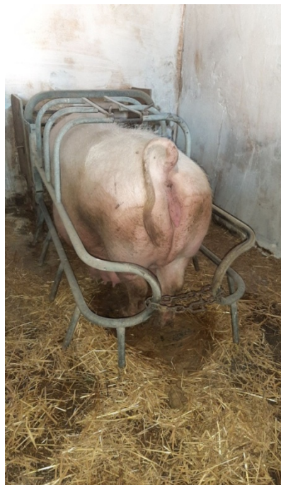
Slika 2. Krmača u boksu netom prije prasenja

Priprema krmače za prasenje obavlja se u čistom, dezinficiranom pripremljenom boksu za prašenje ili u određenom prostoru, uz osam dana odmora po principu „sve unutra-sve van“. Boksovi ograničavaju njihovo kretanje i smanjuje njihovu uznemirenost. U taj prostor krmače treba smjestiti 5 do 6 dana prije prašenja, odnosno kada se primijete prvi pred rodni znaci. Pred rodni znaci su: krmača postaje nemirna, smanjen joj je apetit te ako bacimo slamu pravi gnijezdo za buduće leglo. Jako je bitno osigurati mir krmačama u tom razdoblju jer znaju postati agresivne. Krmače se najčešće prase kasno navečer ili tokom noći. Optimalna temperatura za krmače u prasilištu iznosi 16-20 °C. Tek rođena prasada nema razvijen termoregulacijski sustav, pa dolazi do značajnog gubljenja tjelesne topline nakon prasenja te iz tog razloga prostor mora biti zagrijan do temperature 30-34 °C.