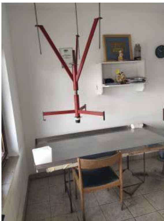
Slika 1. Stroj za pakiranje mlijeka

Proizvodni proces sastoji se od toga da se na vlastitim ratarskim površinama proizvodi krma potrebna za hranidbu goveda, posebice muznih krava od kojih se dobiva mlijeko, koje zatim kreće putem prodaje. Proizvedeno sirovo mlijeko pakira se u pakiranja od 2 do 5 litara i razvozi po okolnim selima (Slika 1.), a ostatak mlijeka dalje se plasira mliječnoj industriji Dukat.