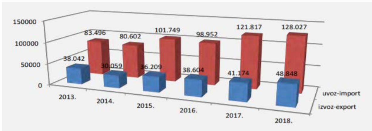
Grafikon 2. Uvoz i izvoz goveda od 2013. do 2018. godine. (Izvor: Godišnje izvješće o stanju uzgoja goveda, 2019.).