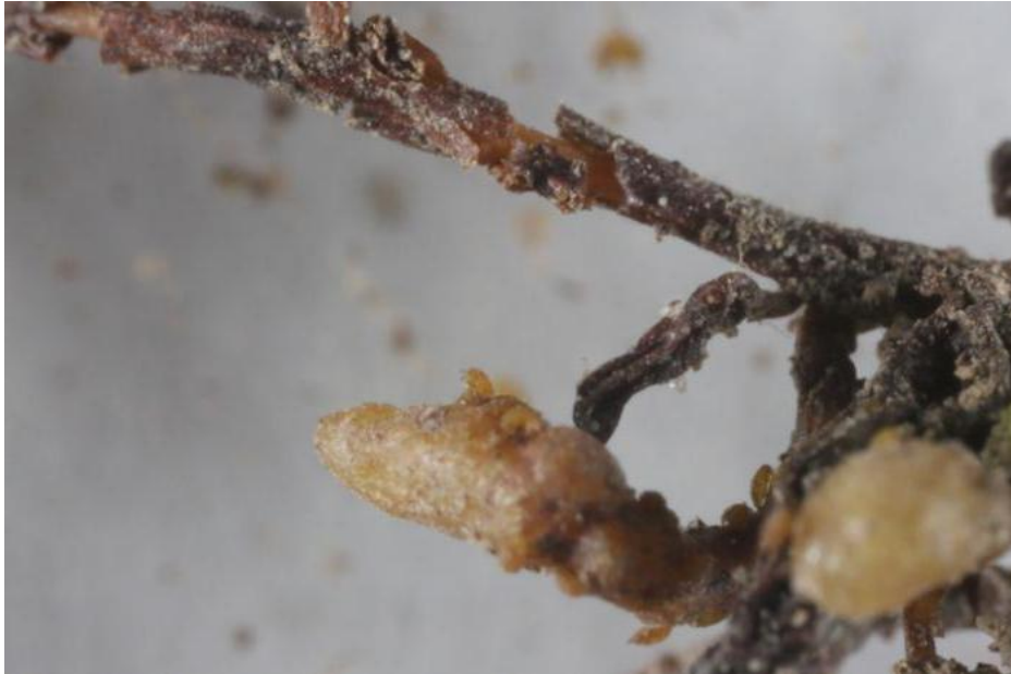
Slika 5. Napadnuti korijen