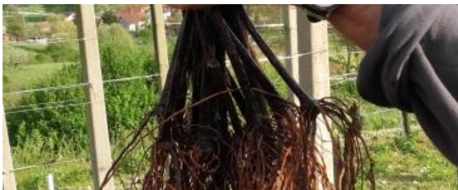
Slika 8. Lozni cijep

Cijepljene europske plemenite loze na podlogu je ustvari jedini racionalni način borbe protiv trsnog ušenca jer na korijenu američke loze ne čini štetu. Osim cijepljenja loze, vinogradari u želji da spase svoj vinograd pribjegli su očajnim mjerama poput plavljenja vinograda vodom. Korištenje insekticida na bazi cijanida koja su bila neizmjereno skupa također su bila jedna od mjera borbe protiv filoksere