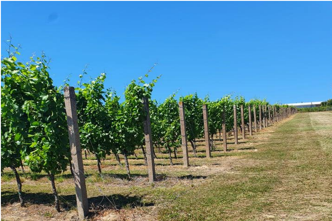
Slika 2. Fakultetsko pokušalište