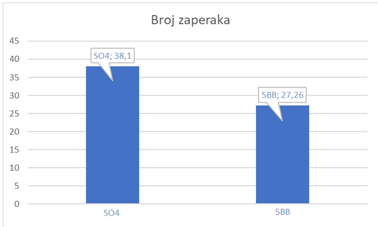
Grafikon 2. Broj zaperaka SO4 i 5BB

Kako bismo utvrdili utjecaj podloga na broj i masu zaperaka plemke napravljen je t test. Osnovna pretpostavka je da se dvije podloge (Kober 5BB i SO4) ne razlikuju između sebe u produkciji broja i mase zaperaka.