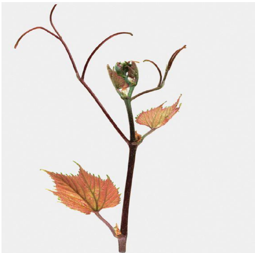
Slika 7. Podloga Kober 125 AA