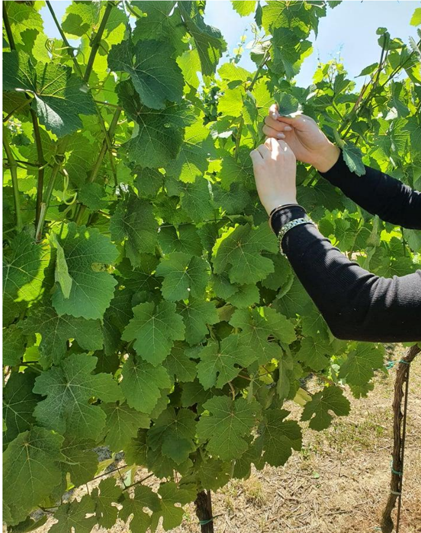
Slika 9. Brojanje zaperaka

Za vrijeme izvođenja pokusa izbrojani su zaperci (Slika 9.) i odvagana je njihova masa uz pomoć digitalne vage (Slika 10.); na 30 trsova koji su cijepljeni na podlogu SO4 i 30 trsova na podlozi Kober 5BB. Nakon prikupljenih podataka napravljena je statistička obrada.