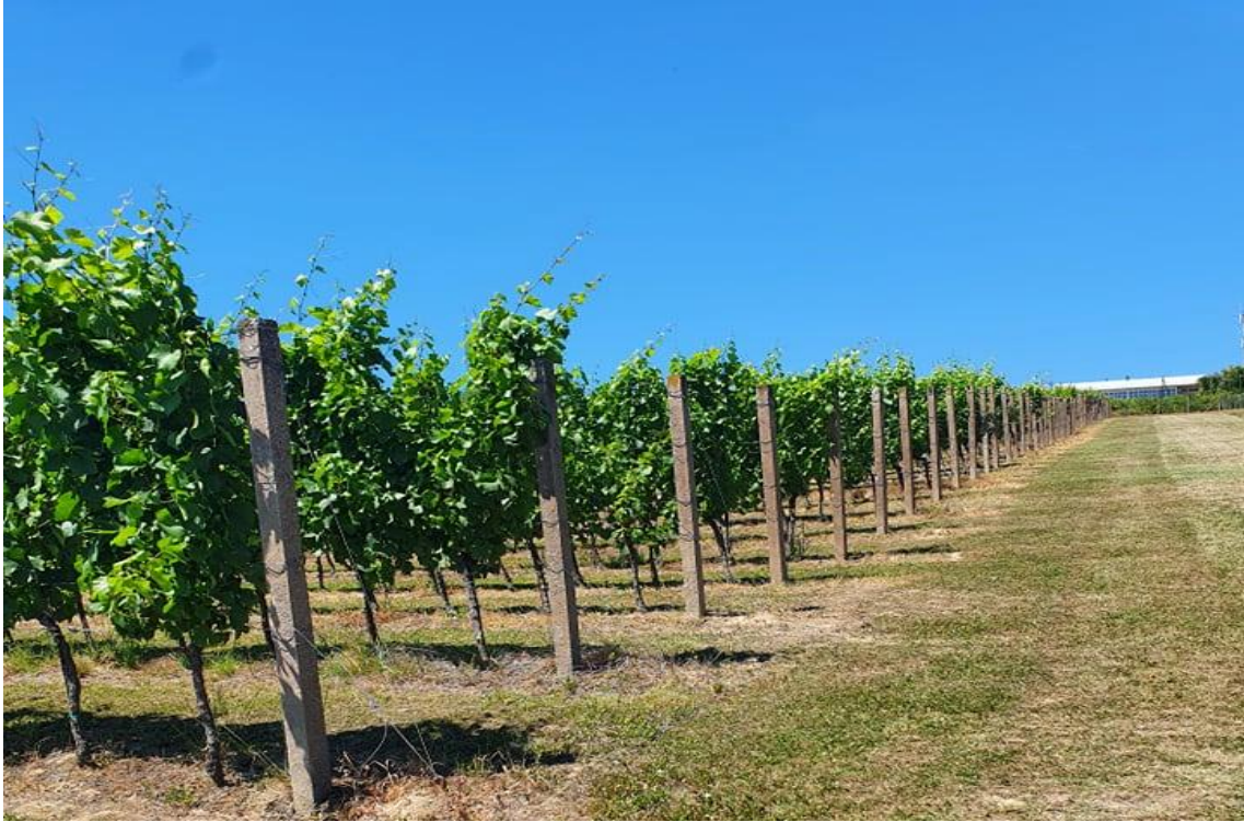
Slika 2. Fakultetsko pokušalište