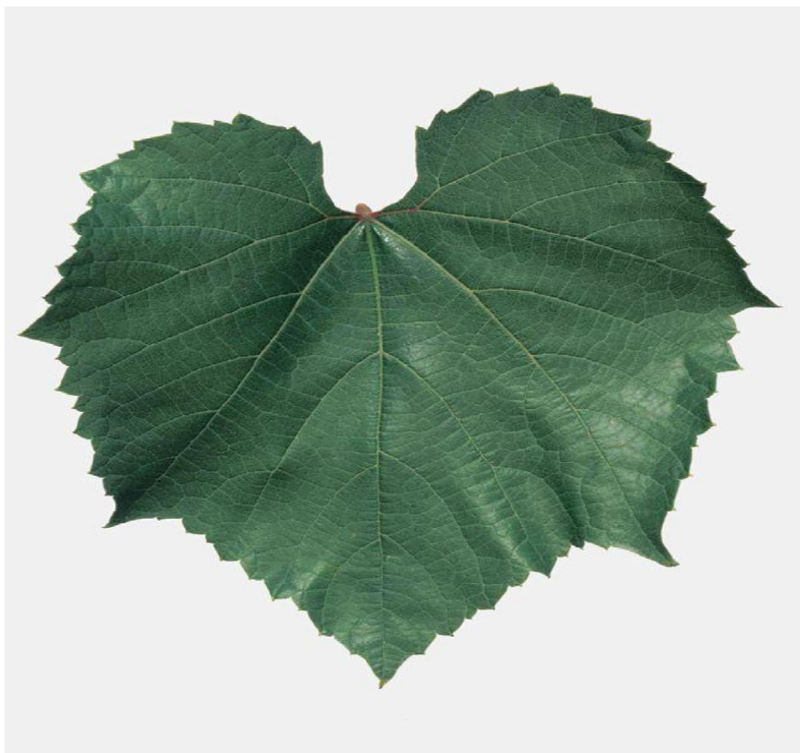
Slika 5. Podloga Kober 5 BB

Izuzetno je pogodna za sjeverne krajeve zbog kratkog vegetacijskog ciklusa. Za ovu podlogu karakteristična je otpornost na nematode, osjetljivost na sušu te razvoj popriličnog broja zaperaka i mladica (Gašpar i Raič, 2017.).