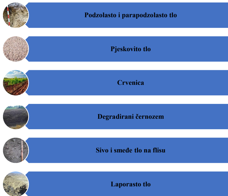
Slika 3. Tipovi tala pogodni za uzgoj vinove loze