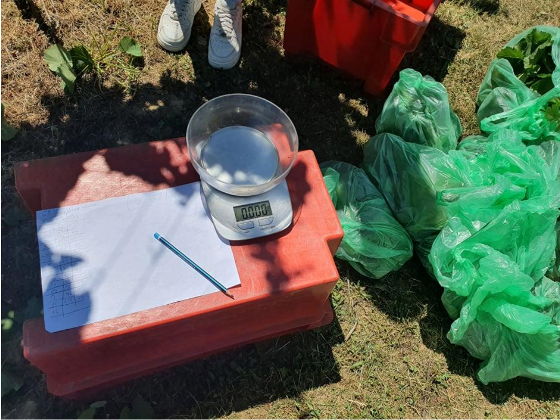
Slika 10. Vaganje zaperaka