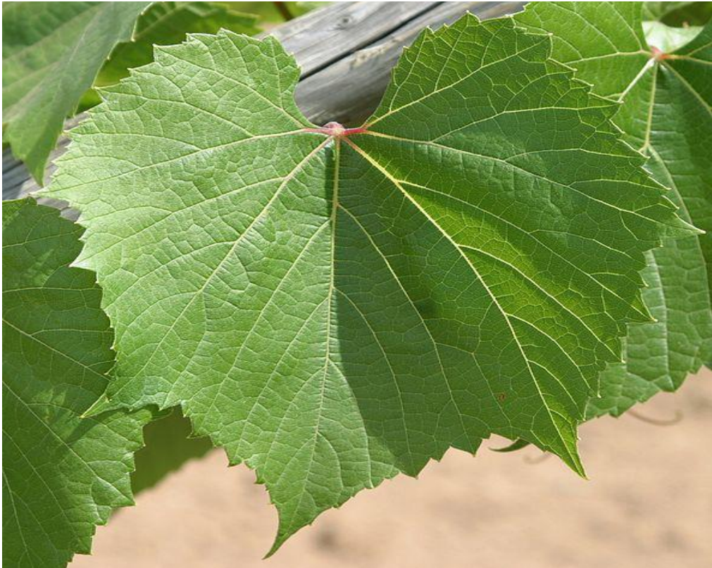
Slika 6. Podloga SO4

Podloga SO 4 (Slika 6.) je druga najrasprostranjenija podloga širom vinskih zemalja. Za razliku od Kobera 5BB njezina osnovna karakteristika je ranije dozrijevanje drva i to čak za 2 tjedna. Bujnost joj je slaba do srednja, otporna je na niske temperature, no ne podnosi sušu. Ima veliku otpornost na nematode (Gašpar i Raič, 2017.). kompatibilna je sa većinom kultivara i dobro se ukorjenjuje (Ivančan, 2020.).