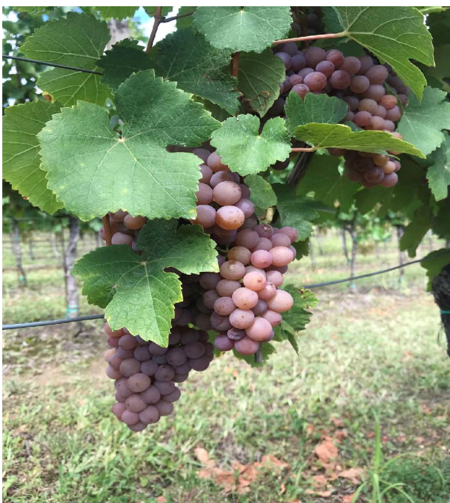
Slika 8. Traminac mirisavi

Sorta Traminac (Slika 8.) porijeklo vuče iz sela Tramin na sjeveru Italije. Njegova važna genetska karakteristika je sklonost mutacijama. U proljeće vegetacija rano kreće što ga čini podložnim vremenskim neprilikama odnosno može doći često do izmrzavanja krenulih mladica. Sorta Traminac slovi kao sorta sa slabim prinosom. Kod ove sorte važno je dobro poznavanje vremena dozrijevanja te precizan period branja. Ukoliko se kasni s berbom dolazi do pretjerane akumulacije šećera, smanjenja ukupne kiselosti i povećanja pH vrijednosti mošta pa dobivamo izrazito alkoholizirano vino s malom ukupnom kiselošću (Mirošević, 2009.).