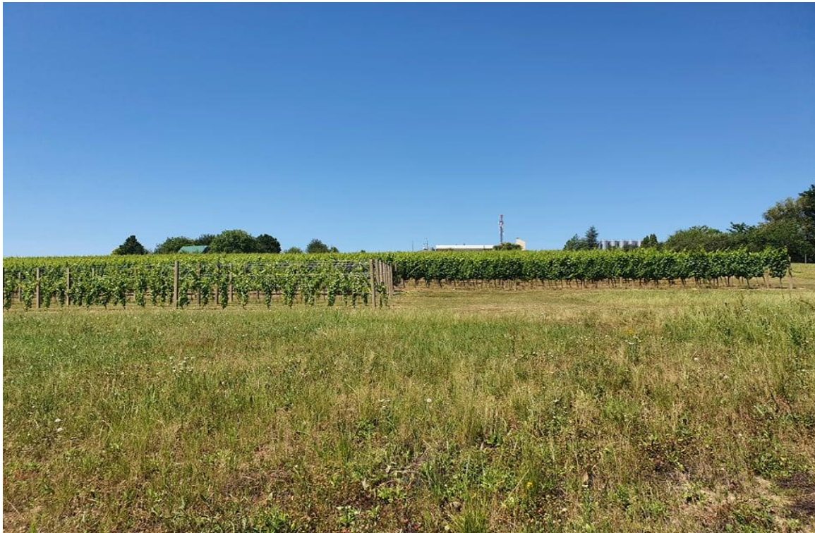
Slika 1. Mandićevac

Fakultetsko pokušalište Mandićevac (Slika 1.) na kojem je postavljen pokus za izradu ovog završnog rada nalazi se u vinogorju Đakovo na 208 m nadmorske visine i prostire se na 3,3 ha. Od 2012. godine je u vlasništvu Fakulteta agrobiotehničkih znanosti u Osijeku. U 2013. godini zasađeno je osam sorata preporučenih za istočnu Hrvatsku, a to su: Graševina, Traminac mirisavi, Rizling rajnski, Chardonnay, Sauvignon bijeli, Merlot, Cabernet sauvignon i Frankovka.