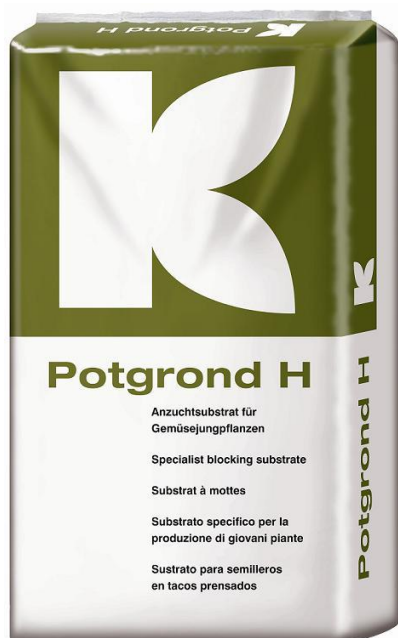
Slika 1. Potgrond H zemljana smjesa

plitica u bazene je što se izbjegne svakodnevno polijevanje, jer biljka u bazenu uzima onoliko vode koliko joj je potrebno.