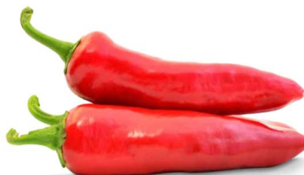
Slika 1. Palotas F1 ( http://zki.hu/peppers-for-spice/?lang=en )h

HIGH YIELD AND POWDER OF EXTRAORDINARY QUALITY!