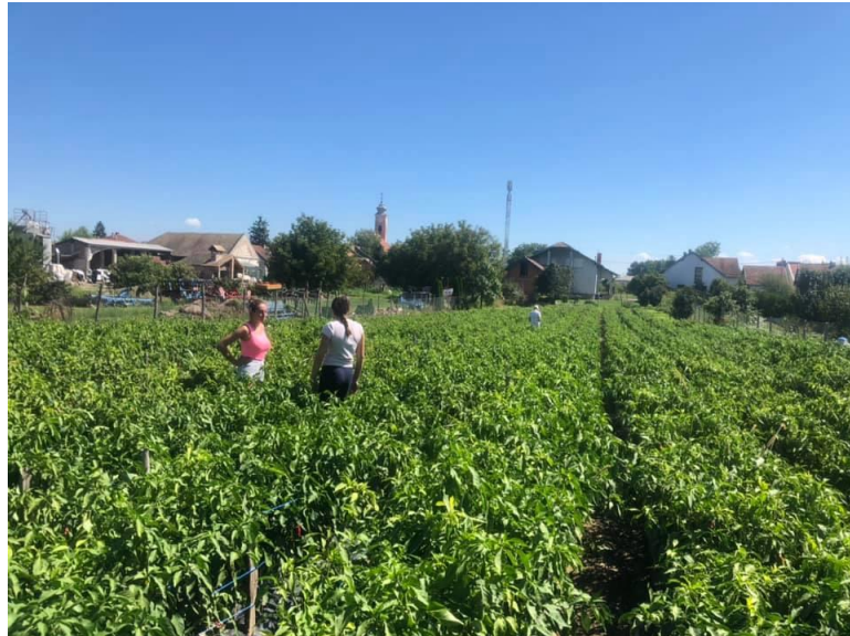
Slika 9. Berba paprike (autor)