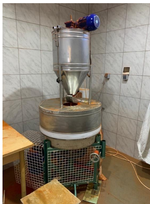
Slika 15. Kameni mlin (autor)