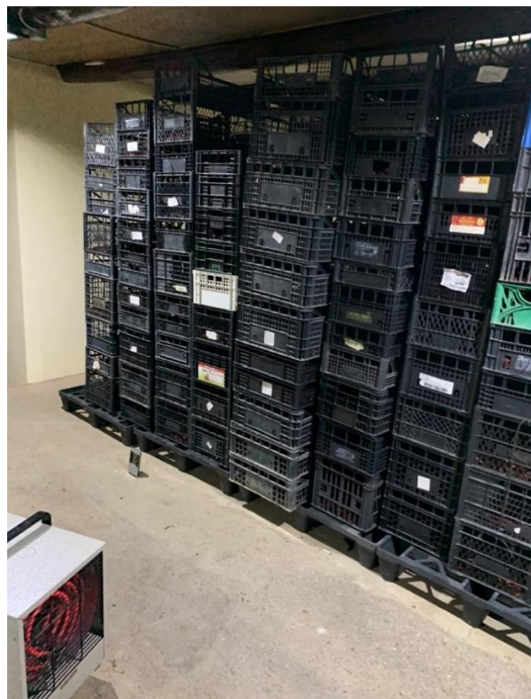
Slika 13. Sušara (autor)