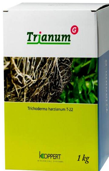
Slika 2. Trianum g smjesa gljiva ( https://www.zeleni-hit.hr/proizvod/trianum/ )