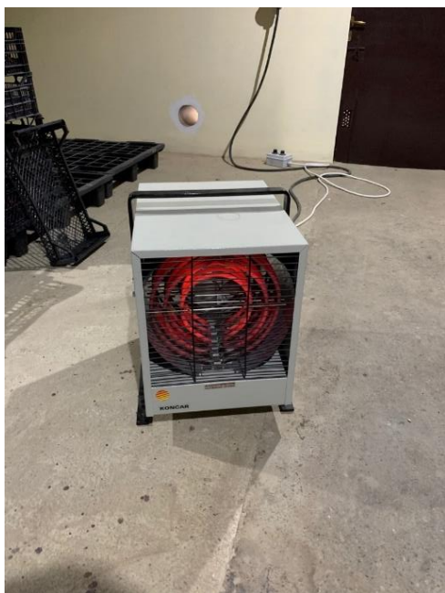
Slika 14. Grijač sušare