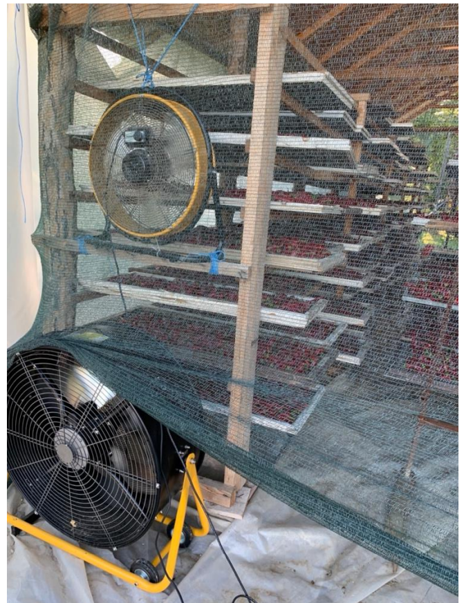
Slika 11. Predsušenje paprike (autor)