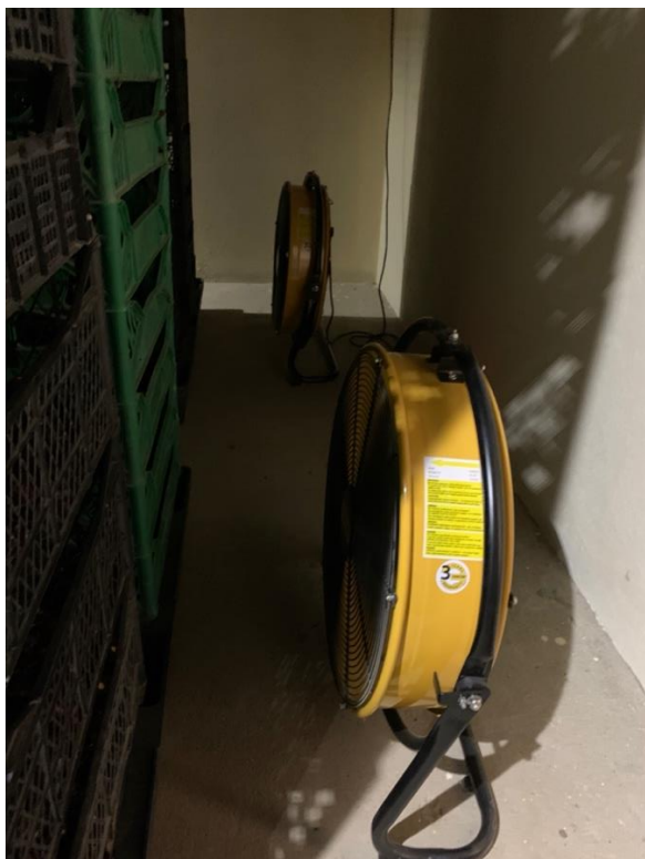
Slika 12. Ventilatori u sušari

Proces sušenja paprike izgleda tako da nakon branja paprike ona se odlaže na okvire koji su napravljeni od starih okvira prozora i postavljene su dvije vrste žica, jedna je deblja i šira kako bi mogla podnijeti teret paprike, a druga komarnik, odnosno manja kako bi spriječila propadanje paprika kroz te okvire. Paprika tako stoji deset dana na okvirima u otvorenom ali natkrivenom prostoru. Nakon tih deset dana, paprici se skidaju peteljke i stavlja se u kašete koje se odnose i slažu u sušaru. Sušara je napravljena tako da ima izvor topline te ventilatore kako bi osigurali cirkulaciju zraka u prostoru. Paprika se u takvoj sušari suši 3-4 dana na temperaturi od 50-60 °C. Na slici 13 se može vidjeti sušara koja je napravljena na takav način da grijač sa slike 14 grije prostoriju, a ventilatori na slici 12 služe kako bi zrak cirkulirao unutar prostorije, također u prostoriji postoji 2 otvora koja služe, jedan kao ulaz zraka, a drugi kao izlaz zraka. Na slici 15 se može vidjeti kameni mlin koji se koristi za finu meljavu paprike.