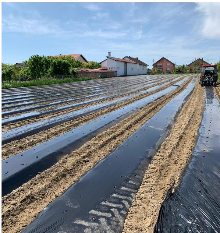
Slika 7. Postavljanje folije

Tri tjedna nakon presađivanja, nakon što su se biljke ukorijenile, obavila se međuredna kultivacija. Nakon 14 dana obavljena je prva prihrana sa 150 kg/ha KAN-a. Nakon mjesec, mjesec i pol dana obavljena je druga prihrana sa 150 kg/ha KAN-a, a treća prihrana obavljena je kada su biljke u cvatu sa KAN-om i to u količini 150 kg/ha. U prihrani paprike mogu se koristiti i folijarna gnojiva koja se mogu primjenjivati zajedno sa sredstvima za zaštitu. Folijarna aplikacija osigurava brzo na licu mjesta dopunsku prihranu kako bi se osigurali visoki prinosi. Folijarna gnojiva idealan su način prihrane u svim fazama rasta biljaka, kada je usvajanje hranjiva iz tla onemogućeno. U folijarnoj prihrani koristio se Poly-Amin koji ima funkciju biostimulatora. Na slici 7 se može vidjeti postavljanje crne folije koja sprječava prodiranje korova i omogućuje brži rast paprici.