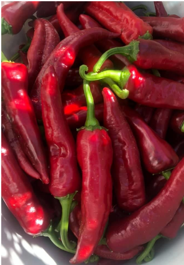
Slika 10. Obrana paprika