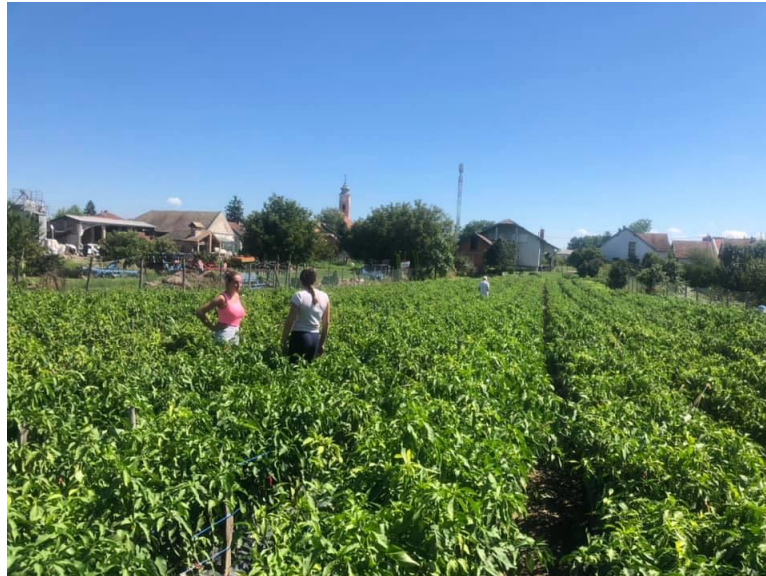
Slika 9. Berba paprike