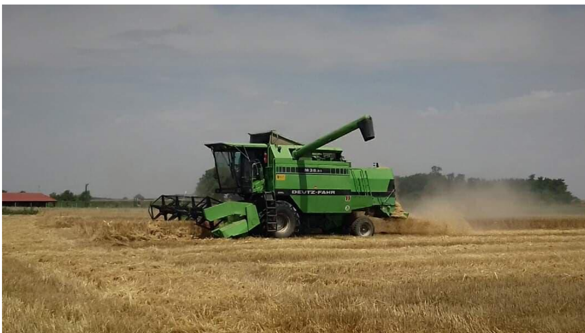
Slika 13. Žetva pšenice