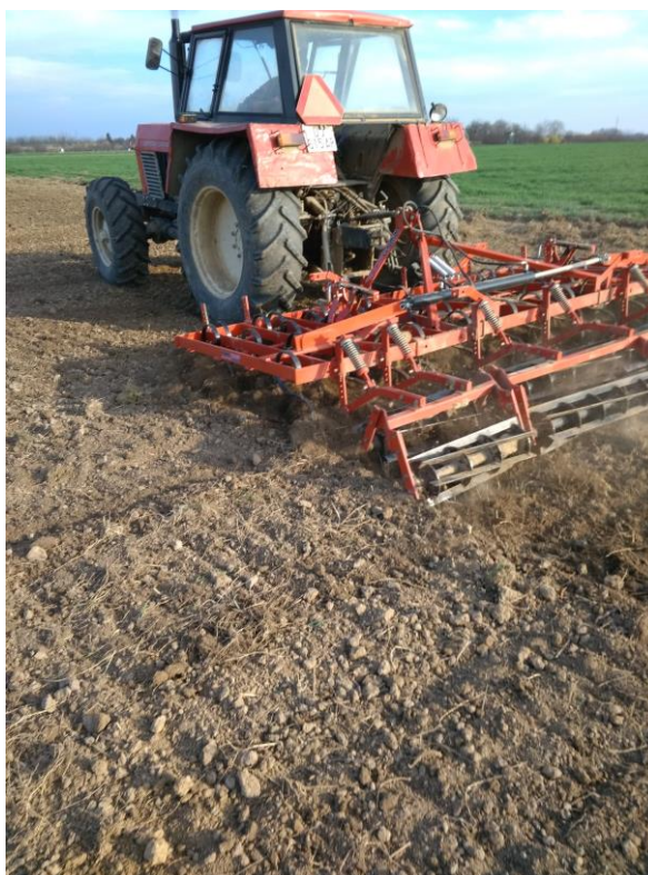
Slika 4. Predsjetvena priprema tla