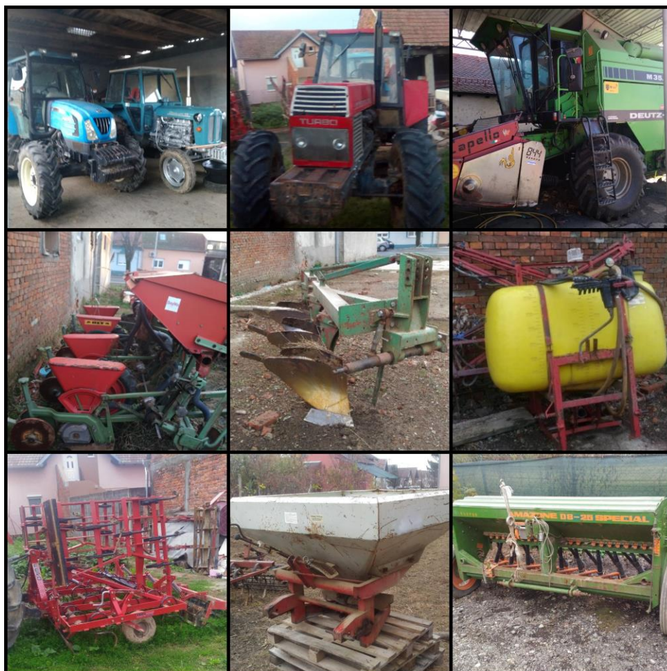
Slika 1. Dio poljoprivredne mehanizacije OPG-a

Obiteljsko poljoprivredno gospodarstvo (OPG) Lasić Franjo osnovano je 2001. godine sa sjedištem u Đakovu u ulici Marina Držića 27 (Osječko-baranjska županija). OPG se bavi samo ratarskom proizvodnjom na 65 ha oranica i trenutno broji dva zaposlena člana obitelji koji proizvode žitarice i uljarice, odnosno pšenicu, ječam, zob, kukuruz, soju i suncokret. Razlog uzgoja navedenih kultura je relativno dobra zarada i poštivanje plodoreda. Prije 10 godina obrt je proizvodio svinje za vlastite potrebe pa je proizvodnja tih kultura dobro došla za hranidbu stoke. OPG Lasić Franjo posjeduje svu potrebnu mehanizaciju koja se koristi u intenzivnoj proizvodnji (Slika 1.).