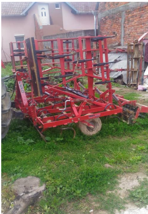
Slika 9. Sjetvospremač Ferocoop

Predkulture u proizvodnji pšenice 2019. godine su bile kukuruz i soja. Obrada tla je počela odmah nakon žetve. Biljni ostaci kukuruza i soje su zaorani na 25 cm dubine, zatim su se njive tanjurale i pripremale za sjetvu s istim poljoprivrednim strojevima.