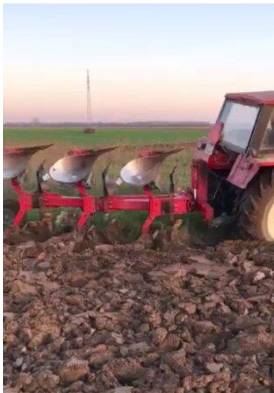
Slika 3. Osnovna obrada tla

U proizvodnji kukuruza 2019. godine predkultura je bila uglavnom pšenica. Nakon žetve kulture obavljalo se tzv. prašenje strništa radi uništavanja korova i lakšeg zimskog oranja koje je bilo izvršeno u 11. mjesecu 2018. godine. Prašenje strništa izvedeno je s teškom tanjuračom – tara (Tablica 4.).