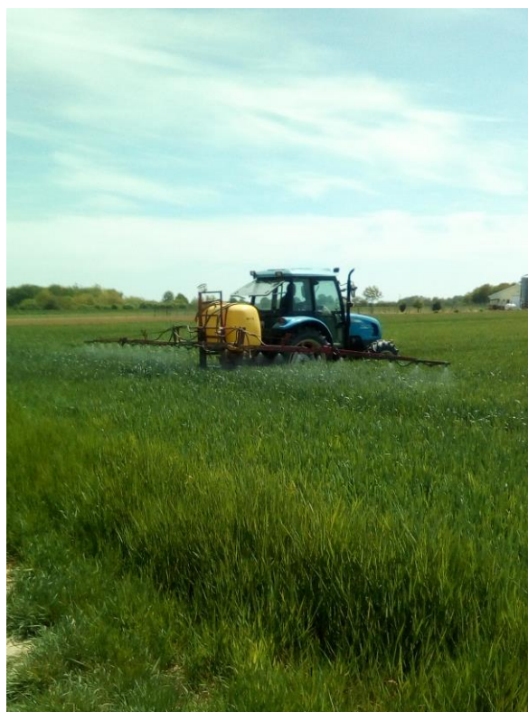
Slika 12. Tretiranje pšenice protiv bolesti