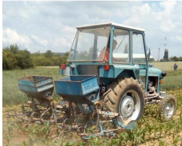
Slika 7. Kultiviranje kukuruza