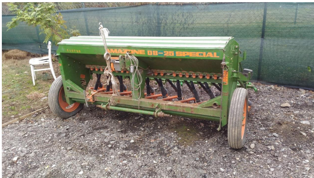
Slika 11. Sijačica Amazone

Sjetva iduće godine također je krenula u listopadu nakon obavljene obrade tla i mineralne gnojidbe. Pšenica se sijala tijekom 5 dana počevši od 16. listopada 2018. Količina sjemena po ha je bila malo veća za razliku od prethodne vegetacijske godine kako se ne bi smanjio sklop u slučaju hladnog i vlažnog zimskog razdoblje. Upotrebljavale su se 4 sorte pšenice i to Anica, Kraljica, Falado i Bologna u količini sjemena za sjetvu 330 kg/ha, 320 kg/ha, 220 kg/ha i Bologna 200 kg/ha.