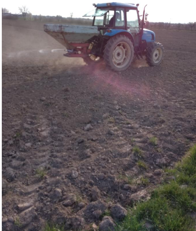
Slika 5. Predsjetvena gnojidba kukuruza