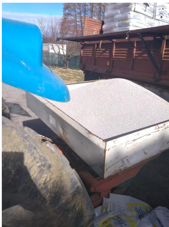
Slika 10. Prva prihrana pšenice

U listopadu 2018. godine obavljena je predsjetvena gnojidba za pšenicu uroda 2019. godine. Aplikacija gnojiva pred sjetvu pšenice je bila identična prošlogodišnjoj gnojidbi. Koristila su se ista gnojiva s istom količinom po ha. Prva prihrana je počela u veljači 2019. godine kada je pšenica u fazi busanja, a koristilo se gnojivo KAN u količini 160 kg/ha. Druga prihrana radila se u ožujku pred vlatanje pšenice uz primjenu istog dušičnog gnojiva u količini 150 kg/ha.