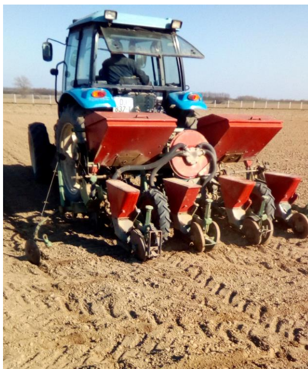
Slika 6. Sjetva kukuruza

U 2019. godini, sjetva kukuruza provodila se od 6. do 11. travnja. Tlo je bilo optimalne vlage i pripremalo se isto s sjetvospremačem. U ovoj vegetacijskog godini količina sjemena je bila ista. Korišteni su hibridi Pioneer P9911, OSSK 596 (FAO 590) i Drava 404 (FAO 400).