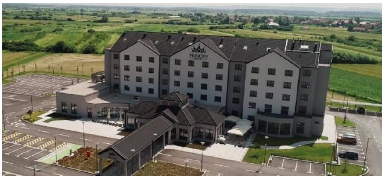
Slika 6: Hotel Princess

"Kad smo se odlučili krenuti u biznis, bilo nam je logično da bude upravo u Jastrebarskom. Kad malo bolje razmislite, Jaska ima odličnu lokaciju, navraćaju nam ljudi na proputovanju na more, a sve je više gostiju koji su orijentirani na planinarenje. Blizu nam je Bled, Plitvice, tu je i Plešivica, a naravno, pomaže i turistički procvat Zagreba iz kojeg također imamo veliki priljev gostiju" (Jagunić, 2019).