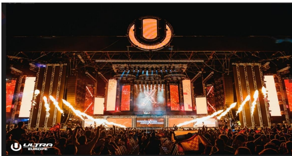
Slika 3: Ultra Europe

„Na projektu Ultra radili smo deset godina, a danas je posjećuje više od 150.000 tisuća ljudi iz više od 150 zemalja, što je izvrsna promocija Hrvatske. Ovo je pravo vrijeme da se pokrene biznis u Hrvatskoj jer su rizici najmanji otkako smo osnovali državu. Hrvatska vas zove da se vratite i ostvarite svoje snove i poslovne ideje“ (Bašić, 2018).