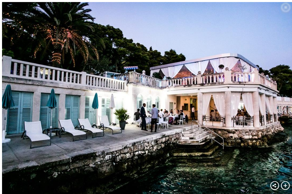
Slika4: Dreamtime vjenčanje

„Vjenčanja se planiraju najmanje godinu dana unaprijed, već imamo zakazana i za 2021., a tijekom priprema s mladencima se itekako zblizimo. Samo na dogovorima preko Skypea provedemo i po dvjesto sati. Neki dođu sami, većina s nekoliko desetaka uzvanika, a neki i više od sto. Gosti sami plaćaju smještaj i put, a budžet mladenaca kreće se od 10.000 do sto tisuća eura. Praktički nitko ne ostane kraće od sedam dana u Hrvatskoj, a imali smo slučajeve da mladenci i dio gostiju ostanu po dva, tri tjedna“ (Čubelić, 2018).