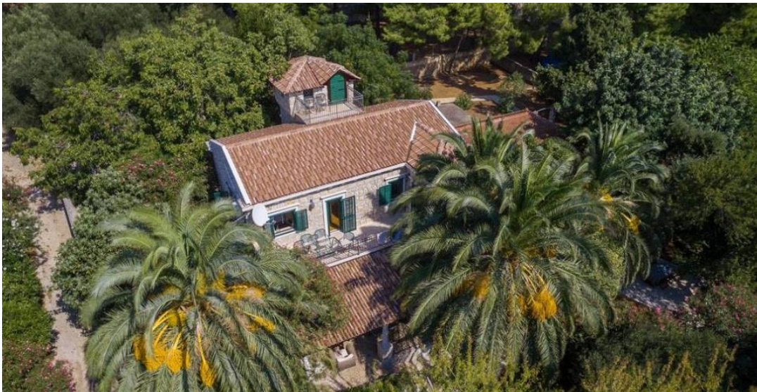
Slika 5: Villa Kustra

„Pozdrav, ja sam Amerikanac koji se preselio u Hrvatsku. Zaljubio sam se u Dalmaciji. Prije više od deset godina, nakon dugogodišnjeg stresnog gradskog života i financijskih tržišta, ovo zapanjujuće imanje izabrano zbog svoje prirodne ljepote kupljeno je instinktivno, s vizijom dijeljena njegove božanske ljepote i nevjerojatnog mira. Kupljena istog dana kada je viđena, ova vila uz obalu, smještena između nevjerojatnog drevnog maslinika, izabrana je ne samo zbog svog besprijekornog položaja, već i zbog svog nevjerojatnog potencijala koji će omogućiti odmor gostiju. Vanjski dio objekta obnovljen je u skladu s autentičnom dalmatinskom arhitekturom, a njegova unutrašnjost u potpunosti je opremljena prema vrhunskim standardima s 5 zvjezdica“ (Kustra, 2016).