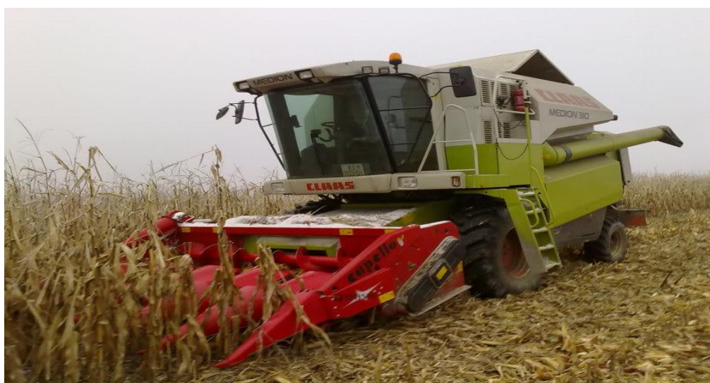
Slika 6. Kombajn Claas Medion u žetvi

Žetva kukuruza u 2018. godini je obavljena od 15. do 18. listopada, a 2019. godine 20. i 21. listopada. S obzirom da OPG ne posjeduje kombajn žetva kukuruza se uvijek obavlja uslužno. U obje godine žetva se obavila kombajnom Claas Medion 310 sa petorednim Capello adapterom. Kukuruz se odvozio u poljoprivrednu zadrugu Lovas sa traktorom Case Maxxum 110 i John Deerom 6620. Svake godine se za vlastite potrebe ostavi oko 10 - 15 t kukuruza koji se sprema na tavan čiji je kapacitet oko 20 t. Prosječan prinos u zadnje dvije godine kretao se od 11 - 14 t/ha. Vlažnost zrna 2018. godine bila je ispod 14%, a 2019. godine oko 15,5%. Cijena kukuruza određivala se prema vlažnosti zrna. Suhi kukuruz imao je cijenu od 90 do 100 lipa/kg dok je cijena za kukuruz s povišenom vlagom dosta niža jer zahtjeva sušenje.