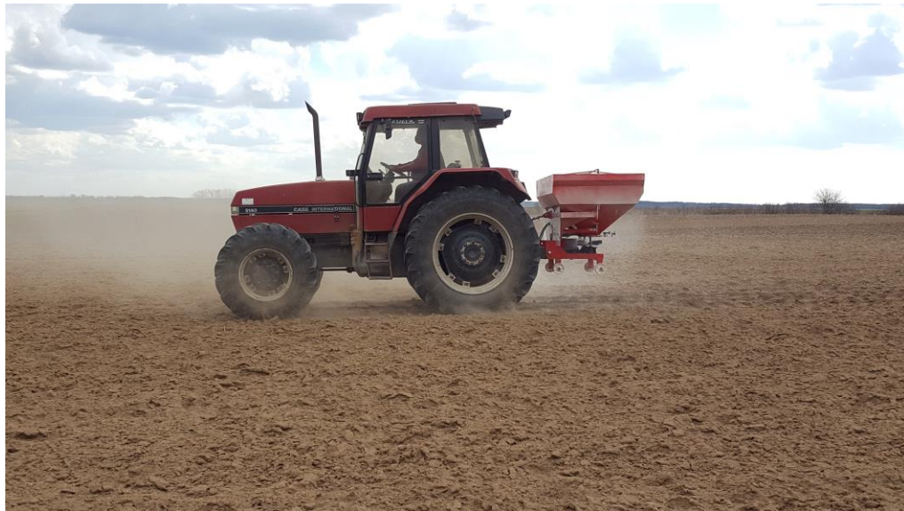
Slika 3. Gnojidba kukuruza

Gnojidba je u obje analizirane godine obavljena oko 20. ožujka prije zatvaranja brazde sa mineralnim gnojivom 15:15:15 u količini od 350 kg/ha ili sa mineralnim gnojivom 0:20:30 u količini od 300 kg/ha i sa urejom (46 % N) u količini od 250 kg/ha. Gnojidba se obavlja sa traktorom Case maxxum 5140 i rasipačem kapaciteta 1000 kg, a sama operacija obično traje samo jedan dan. Prihrana kukuruza na OPG-u se obavlja jednom sa 100 kg/ha KAN-a.