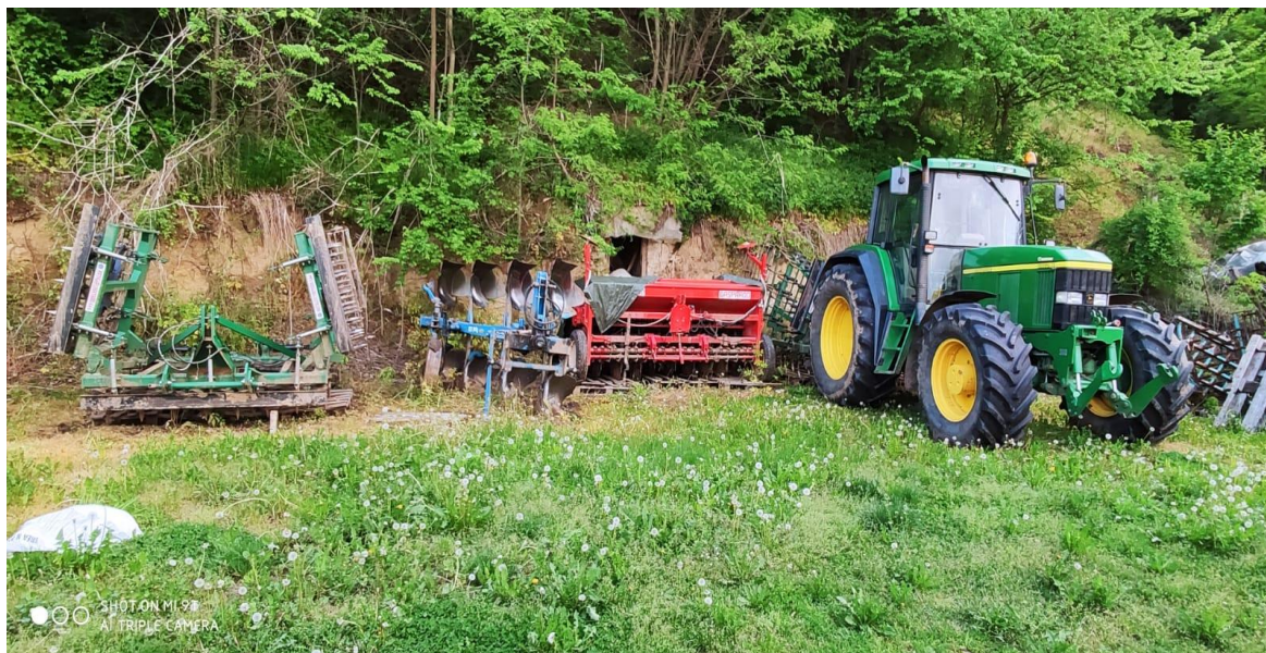
Slika 1. Dio mehanizacije na OPG-u

Obiteljsko poljoprivredno gospodarstvo Mirko Rumbočić osnovano je 2003. godine u mjestu Mohovo u Vukovarsko-srijemskoj županiji, a bavi se pretežito ratarskom proizvodnjom uz uzgoj stoke za vlastite potrebe. OPG obrađuje 55 ha vlastitih oranica i 50 ha u zakupu na kojima se uzgaja šećerna repa, pšenica, kukuruz, suncokret i ječam. Za obavljanje agrotehničkih operacija u ratarskoj proizvodnji OPG zapošljava dvoje ljudi i posjeduje svu potrebnu mehanizaciju kao i veliki broj objekata (Tablica 3.). Uzgoj pšenice se svake godine smanjuje dok površine zasijane kukuruzom i ječmom rastu iz godine u godinu. U zadnjih nekoliko godina kukuruz se pokazao kao najisplativija žitarica za uzgoju zbog malih ulaganja te visokih i sigurnih prinosa, dok je cijena pšenica uzrokovala smanjenje zasijanih površina. Sjetva pivarskog ječma osigurava veću zaradu za oko 20% u odnosu na cijenu pšenice sa pripadajućom klasom. Svake godine na gospodarstvu se provodi plodored što pomaže pri suzbijanju bolesti i štetnika.