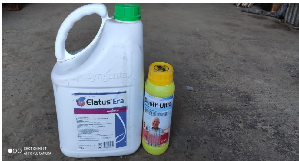
Slika 9. Fungicidi za zaštitu pšenice

( www.agro.basf.hr/hr/Products/ ). Također, koristi se i fungicid Elatus era koji štiti pšenicu od pjegavosti lista i hrđe. Aktivna tvar u njemu je protiokonazol (150 g/l) i benzovindiflipir (75 g/l), a dodaje se u količini od 0,8 l/ha ( www.agroklub.com ). Zaštita se obavlja sa traktorom Case Farmall 105c i prskalicom Agromehanika kapaciteta 1000 l. U obje analizirane godine nije bilo tretiranja protiv štetnika.