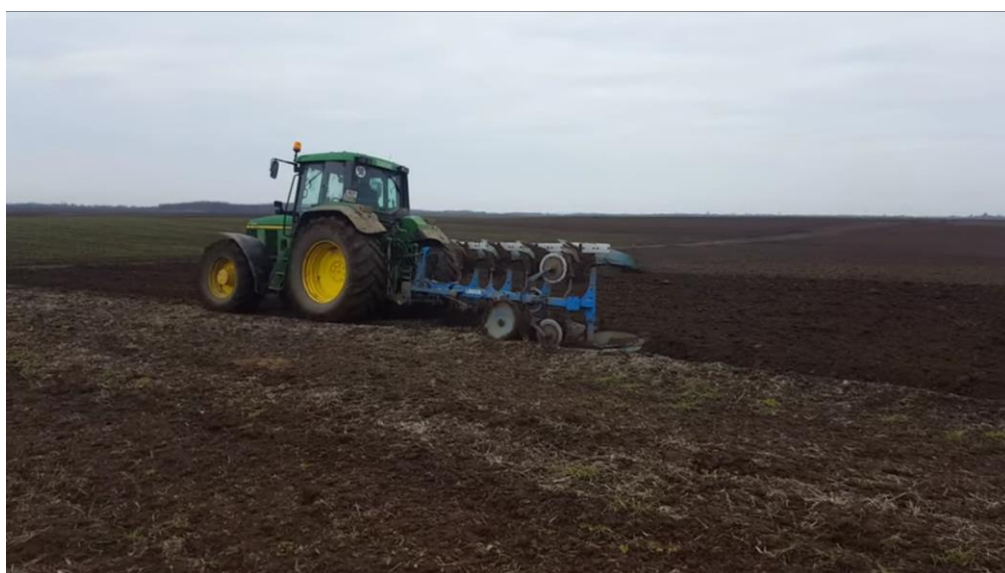
Slika 8. Osnovna obrada

Obrada tla i priprema tla za sjetvu ovisi o predkulturi. Na OPG-u obrada tla obično započinje sa tanjuranjem najčešće 10 - 15 dana nakon žetve sa tanjuračem Olt na dubinu 10 cm. Na jesen odnosno prije sjetve se obavlja duboko oranje na dubinu 25 - 30 cm traktorom John Deere i Lemken plugom od 4 brazde (Slika 8.). Predusjev pšenici u 2018. je bio suncokret, a u 2019. šećerna repa. Prije sjetve obavlja se predsjetvena priprema tla sa sjetvospremačem Metalac zahvata 4,6 m ili drljačem zahvata 4,4 m.