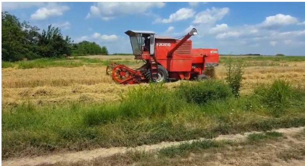
Slika 10. Žetva pšenice