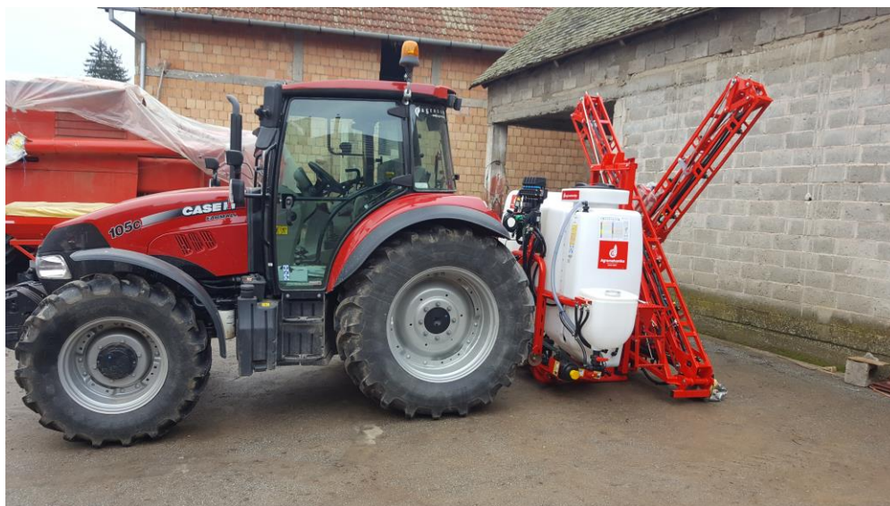
Slika 5. Priprema za zaštitu kukuruza

S obzirom da kukuruz pripada u kategoriju širokorednih kultura ili okopavina vrlo važna agrotehničke mjera je pravilna i pravovremena zaštita od korova. Tijekom 2018. godine zaštita je obavljena krajem travnja sa herbicidom Cambio koji je namijenjen za suzbijanje jednogodišnjih širokolisnih korova poput mračnjaka, štira, ambrozije, kamilice, lobode i drugih. Aktivna tvar je bentazon (320 g/l) i dikamba (90 g/l), a dodaje se u količini od 2 l/ha ( www.pinova.hr/ ). Također, korišten je i herbicid Motivel koji suzbija jednogodišnje i višegodišnje uskolisne i jednogodišnje širokolisne korove poput sirka, pirike, koštana, ambrozije, lobode, štira i mnogih drugih. Aktivna tvar je nikosulfuron (40 g/l), a dodaje se u količini 1 l/ha u fazi kukuruza od 4 – 6 listova ( www.pinova.hr/ ). Tijekom druge analizirane godine zaštita je obavljena sa herbicidima Nikoš i Motivel. Nikoš je namijenjen za suzbijanje jednogodišnjih i višegodišnjih uskolisnih i nekih širokolisnih korova (divljeg sirka, svračice, pirike, koštana i drugih). Aktivna tvar u njemu je nikosulfuron (40 g/l) i dodaje se u količini u količini 1 l/ha ( www.pinova.hr/ ). U obje analizirane godine nije bilo zaštite protiv bolesti i štetnika. Zaštita se obavlja sa traktorom Case Farmall 105 c i prskalicom Agromehanika kapaciteta 1000 L (Slika 5.).