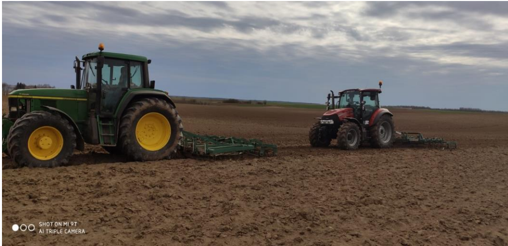
Slika 2. Zatvaranje zimske brazde