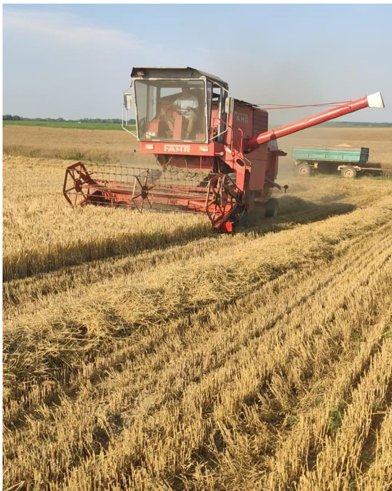
Slika 12. Žetva pivarskog ječma

koji mora biti od 9-11%, a sve ispod i iznad toga odlazi u stočni ječam. Sadržaj proteina je na OPG-u svake godine u dozvoljenim granicama. Vlaga zrna u obje godine kretala se od 10 - 12,5%. Ječam se isplaćuje prema prosječnoj cijeni pšenice na koju se uračuna još 20 %. Proizvodnja ječma na OPG-u svake godine je sve veća zbog manjih ulaganja, a znatno veće cijene od pšenice pa samim time i bolje zarade.