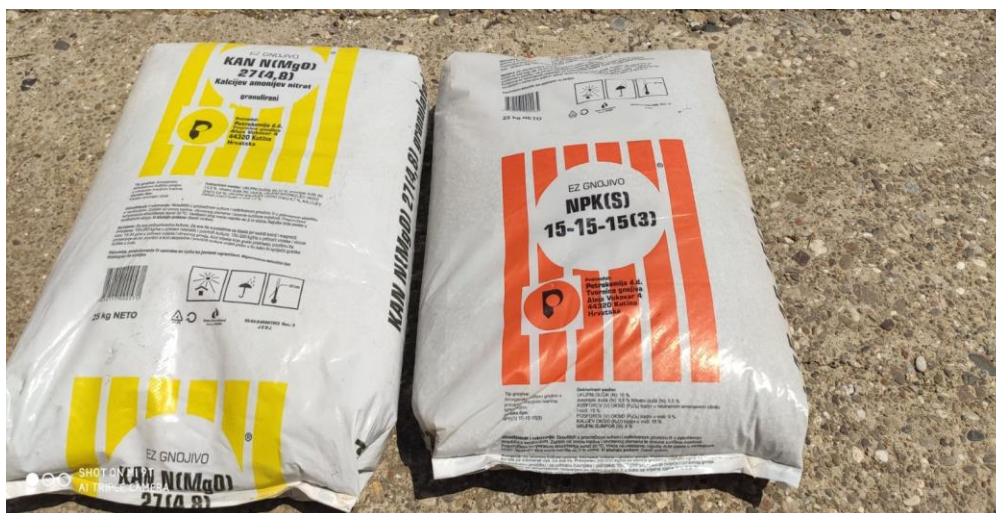
Slika 11. Mineralna gnojiva KAN i NPK