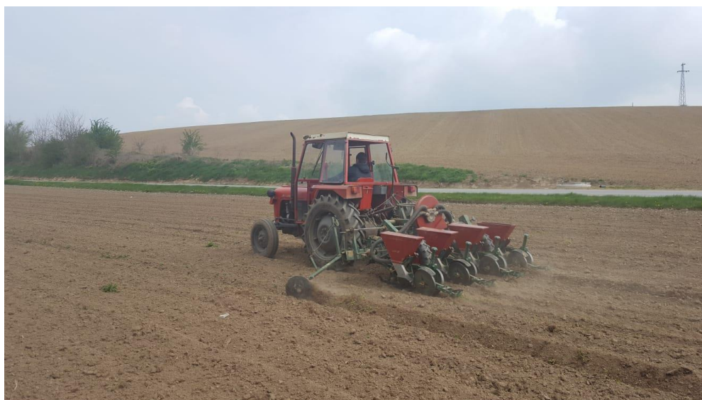
Slika 4. Sjetva kukuruza

Sjetva kukuruza je u obje analizirane godine obavljena u prvoj dekadi travnja sa sijačicom OLT PSK s 4 reda i traktorom IMT 539. Sijalo se na dubinu od 7-8 cm što je standardna dubina sjetve svake godine. Sjetva u obje godine je trajala obično 2 – 3 dana, a korišteni su hibridi sjemenske kuće Pioneer. U 2018. godini korišteni su hibridi P9903 i P9911. Prema katalogu proizvođača P9903 je hibrid FAO grupe 390 koji je izuzetno tolerantan na sušu, stabljike mu je srednje visine te odlične kvalitete zrna, a pogodan je za sjetvu na svim tipovima tala ( www.corteva.hr/proizvodi/sjeme/kukuruz.html ). Hibrid P9911 je iz FAO grupe 450, visokog potencijala rodnosti, tolerantan na sušu, izrazite kvalitete zrna i pogodan za uzgoj u svim krajevima Hrvatske. Može se koristiti za spremanje kvalitetne silaže ili za proizvodnju suhog zrna ( www.corteva.hr/proizvodi/sjeme/kukuruz.html ). Tijekom 2019. godine korišteni su drugi hibridi iste sjemenske kuće. Hibrid P9415 pripada FAO grupi 450, visokog je prinosa, srednje visine, zrno u tipu zubana sa izuzetno visokim potencijalom rodnosti. Zbog svoje tolerantnosti na sušu i ranijeg dozrijevanja odličan je za uzgoj u područjima na kojima se javlja problem suše i nedostatka vlage u tlu. Drugi korišten hibrid je P9757 iz FAO grupe 380. Razvija višu stabljiku, zrno u tipu zubana koje vrlo brzo otpušta vlagu, a pošto ima odličan rani porast pogodan je za ranije rokove sjetve i za sjetvu na težim tlima ( www.corteva.hr/proizvodi/sjeme/kukuruz.html ).