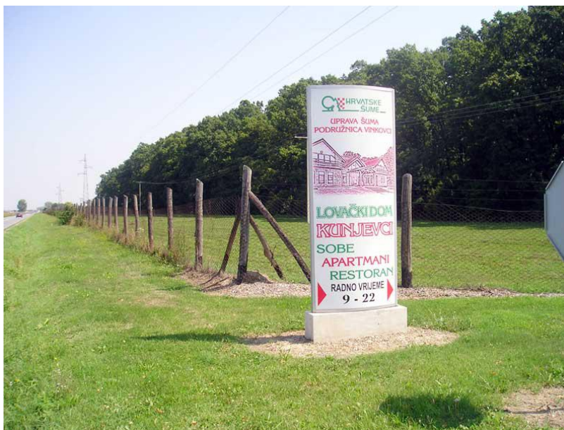
Slika 11. Prilaz Lovačkom domu Kunjevci

Lovište je poznato po atraktivnom zimskom lovu na divlje svinje prigonom uz upotrebu posebno dresiranih lovnih pasa. Lov na plemenitog jelena u rici u barama, poseban je lovački doživljaj ( www.hrsume.hr ).