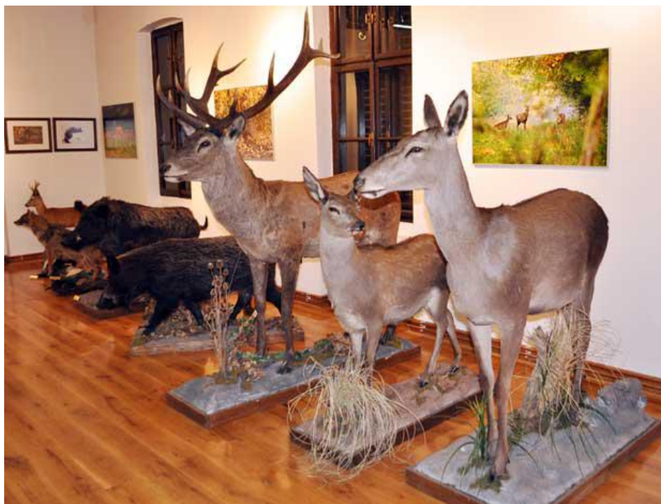
Slika 12. Izložci trofeja u Bošnjacima

Izložbeni trofeji najvećim dijelom potječu iz vremena prije 1914. godine, kad je u ratnim razdoblju, premda je bio zabranjen lov, očito nestalo visoke divljači. Tek 1931. Martin Balling ustrijelio je srnjaka, a 1936. dr. Detlef jelena svjetske klase. Interes za ovu izložbu bio je velik, tako da je organiziran zajednički posjet lovaca među kojima su bili i lovci iz Vinkovaca, Nuštra i Vukovara. (LG, Novi Sad, 1937.)