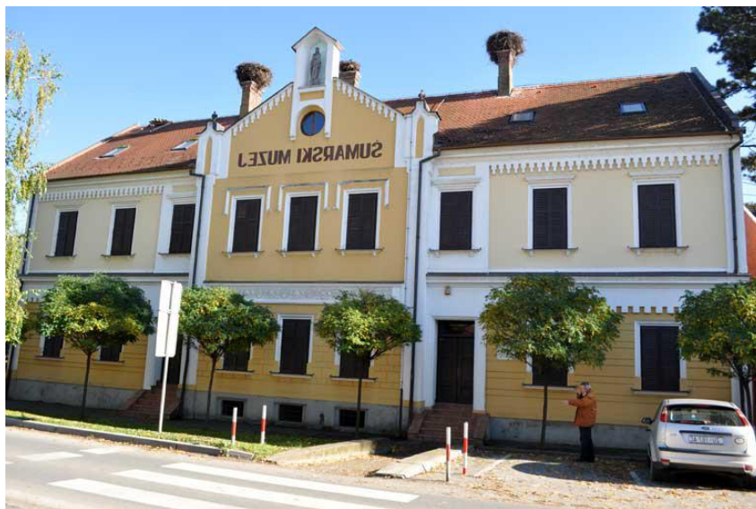
Slika 10. Šumarski muzej u Bošnjacima

povijest šumarstva ovog kraja, a poglavito Spačvanskog bazena poznatog po šumi hrasta lužnjaka odnosno na daleko znanog slavonskog hrasta.