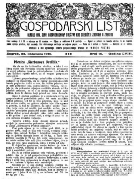
Slika 1. Gospodarski list iz 1943. godine

U 19. stoljeću poljoprivredna proizvodnja Hrvatske prisutna je na međunarodnom tržištu, a sva zbivanja na tržištu imala su i posljedice na našu proizvodnju. Prva agrarna kriza javlja se oko 1830. godine u trgovini žitom, a uzrok je bio u sve većoj konkurenciji jeftinijeg ruskog žita. Mnogo veću važnost imala je velika europska agrarna kriza u zadnjoj četvrtini 19. stoljeća. Uzrok je bila konkurencija jeftinog američkog žita koje je u sve većim količinama dolazilo na tržište. To je dovelo do pada cijene žitarica, a zatim do velikog smanjenja prihoda seljaka. Druga velika kriza počela je 1926. te dolazi do pada cijene žita, a između 1925. i 1930. cijene agrarnih proizvoda padaju za 50 % što opet najjače pogađa male seljake. U Hrvatskoj poljoprivredi 19. stoljeća prevladava sitno gospodarstvo (Defilippis, 2005.).