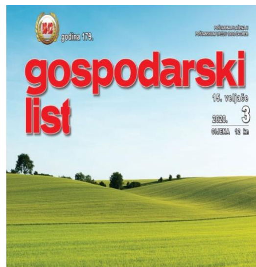
Slika 2. Gospodarski list iz 2020. godine