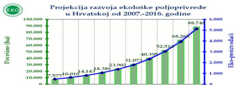
Slika 5. Projekcija razvoja ekološke poljoprivrede u Hrvatskoj od 2007. - 2016. godine

Zajedničkom poljoprivrednom politikom (ZPP) je utvrđen opći okvir za razvoj poljoprivrede u EU za razdoblje 2014. – 2020. Cilj je novih odredaba uspostaviti održivu konkurentnost kako bi se postigao gospodarski održiv sektor proizvodnje hrane te održivo gospodarenje prirodnim resursima EU u kojemu je ekološka proizvodnja prepoznata kao ključan element. U ovom se programskom razdoblju pridaje još veći značaj okolišu i utjecaju poljoprivrede na okoliš. Ekološka poljoprivreda je izdvojena iz mjere agro-okoliš kao zasebna mjera čime se dodatno naglasio njezin povoljni utjecaj na okoliš. U sklopu Programa ruralnog razvoja potpora se daje ekološkim proizvođačima koji tek ulaze u sustav ekološke proizvodnje kao i onima koji nastavljaju ovaj vid proizvodnje (ruralnirazvoj.hr, 2020).